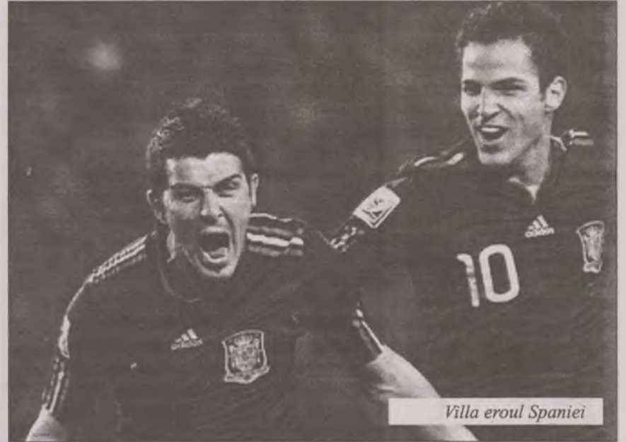
Villa eroul Spaniei

cat să desfacă apărarea nemților, dar nu a avut câștig de cauză din acest punct de vedere, Messi a fost inexistent, fiind blocat foarte bine de fundași germani, nu a reușit să dezvolte atacuri periculoase pentru echipa sa.