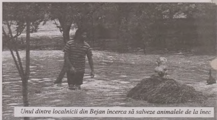
Unul dintre localnicii din Bejan încerca să salveze animalele de la înec