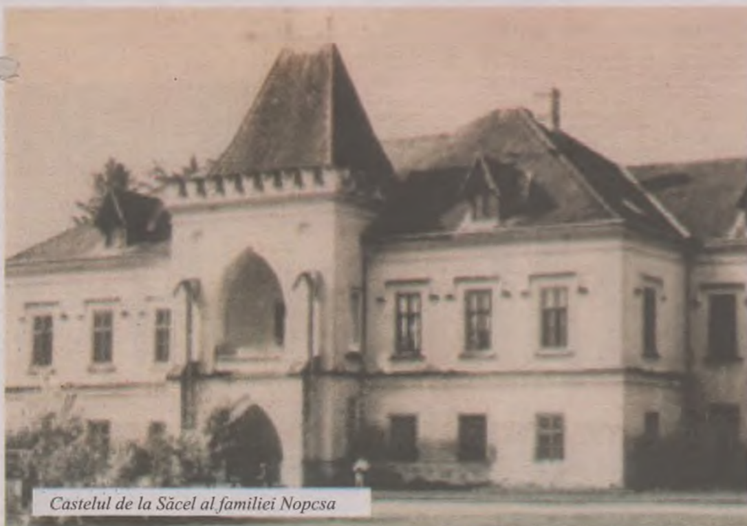
Castelul de la Săcel al familiei Nopcsa