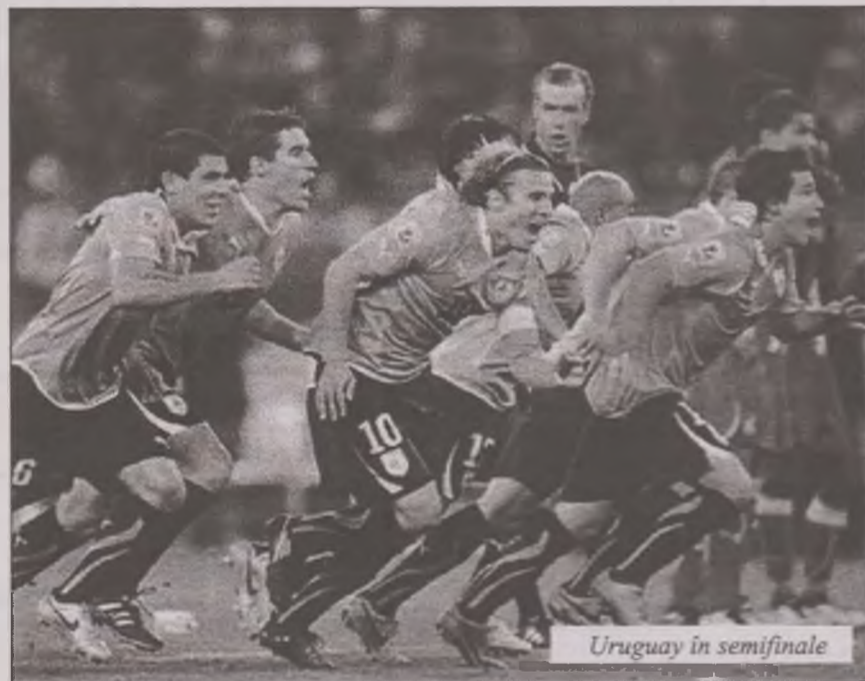
Uruguay în semifinale

Reprezentativa Germaniei s-a calificat în semifinalele Cupei Mondiale, după ce a învins, cu scorul de 4-0, selecționata Argentinei, sâmbătă, la Cape Town, într-un meci contând pentru sferturile de finală ale competiției din Africa de Sud. Toată lumea se aștepta la un meci echilibrat, nicidecum ca una dintre echipe să se impună categoric, dominând clar partida de la un capăt la celălalt. Germania a început meciul în forță, iar în minutul trei era deja 1-0, Muller a deschis scorul cu o lovitură de cap, după lovitură liberă executată de Schweinsteiger. Până la pauză meciul a avut ritm, dar nici una dintre cele două echipe nu a mai avut ocazii clare de a marca. Argentina a încer-