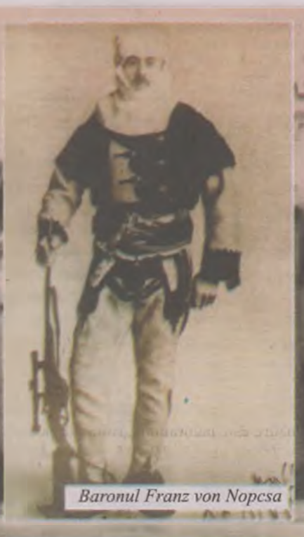
Baronul Franz von Nopcsa