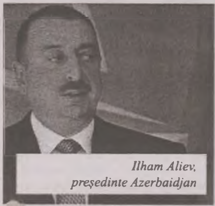
Ilham Aliiev, președinte Azerbaidjan

Președintele azer, Ilham Aliiev, a cerut duminică ajutorul Statelor Unite pentru găsirea unei soluții "bazate pe legislația internațională" a conflictului cu Armenia pentru enclava Nagorno Karabah.