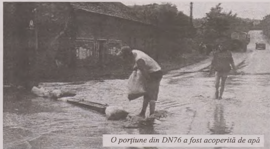
O porțiune din DN76 a fost acoperită de apă