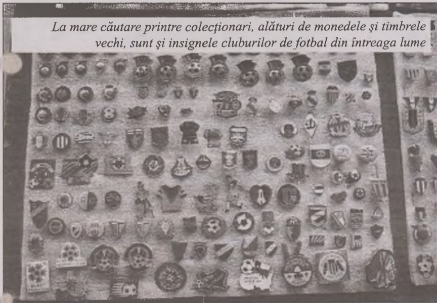
La mare căutare printre colecționari, alături de monedele și timbrele vechi, sunt și insignele cluburilor de fotbal din întreaga lume