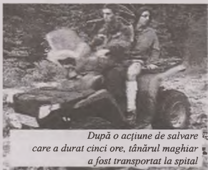
După o acțiune de salvare care a durat cinci ore, tânărul maghiar a fost transportat la spital

zana Cărnice, de personalul ambulanței și transportat la spitalul din Hațeg.