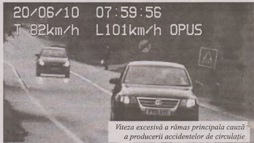
Viteza excesivă a rămas principala cauză a producerii accidentelor de circulație

Nerespectarea limitei legale de viteză sau neadaptarea acesteia la condițiile meteo-rutiere, neacordare priorității de trecere pietonilor, depășiri neregulate, au fost doar câteva dintre motivele pentru care oamenii legii au reținut, în vederea suspendării, 1.428 permise de conducere și au retras 1.298 certificate de înmatriculare. Cele mai multe sancțiuni au fost aplicate pentru depășirea vitezei regulamentare, numărul acestora fiind de peste 10.500. Nici pietonii nu au scăpat de ochiul vigilent al polițiștilor. Astfel că, pentru nerespectarea regulilor de circulație, 2.441 pietoni au fost sancționați contravențional.