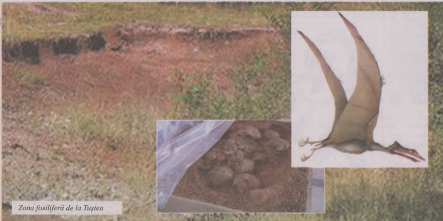
Zona fosiliferă de la Tuștea