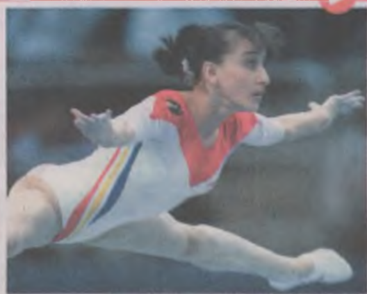
Steaua gimnasticii mondiale a rămas la Deva