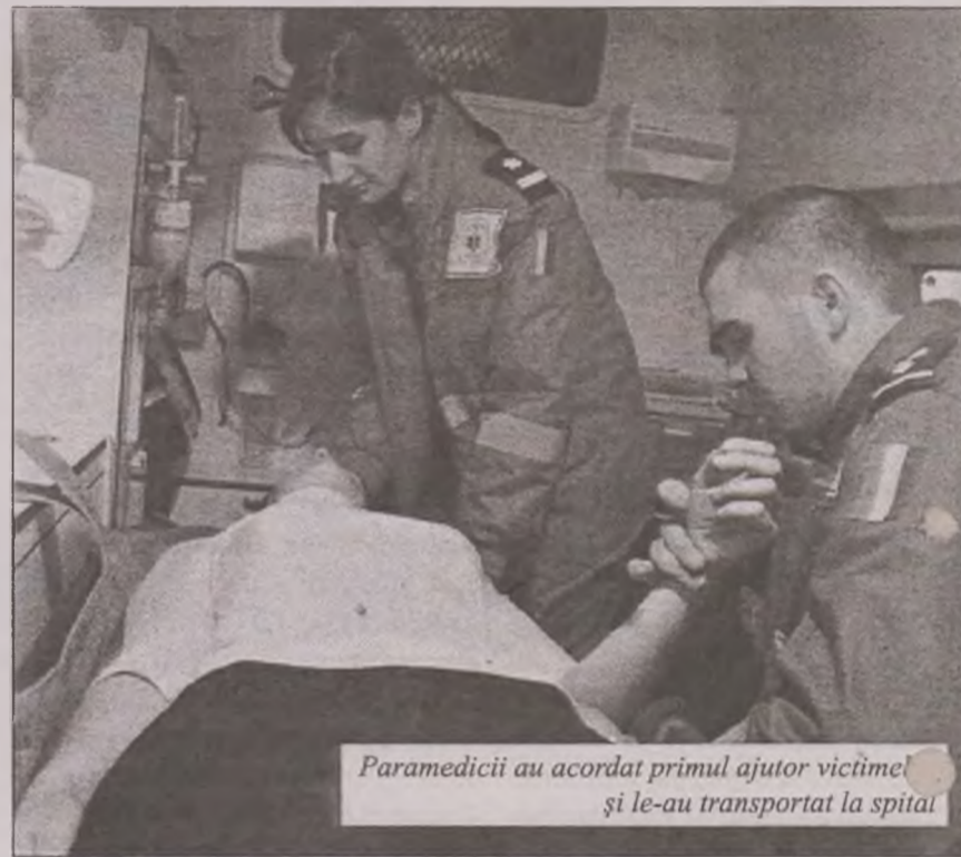
Paramedicii au acordat primul ajutor victimei și le-au transportat la spital

Un copil, în vârstă de opt ani, a fost grav rănit în urma unui accident produs în aceeași zi, în jurul orei 19:30, pe o stradă din localitatea Cristur. Minorul a pătruns pe partea