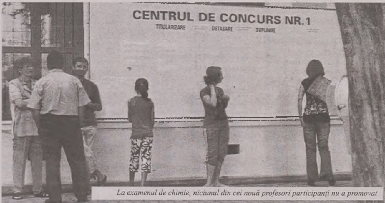
La examenul de chimie, niciunul din cei nouă profesori participanți nu a promovat

O situație deosebită se înregistrează la disciplina Chimie. Niciunul dintre cei nouă profesori participanți nu a luat nota de trecere. Cea mai mare notă la această materie a fost 4,3. Astfel, posturile disponibile vor fi ocupate de profesorii care au susținut examenul de titularizare anul trecut sau în anul 2008. Ei vor fi selectați în ordine descrescătoare a notelor și vor fi încadrați ca suplinitori.