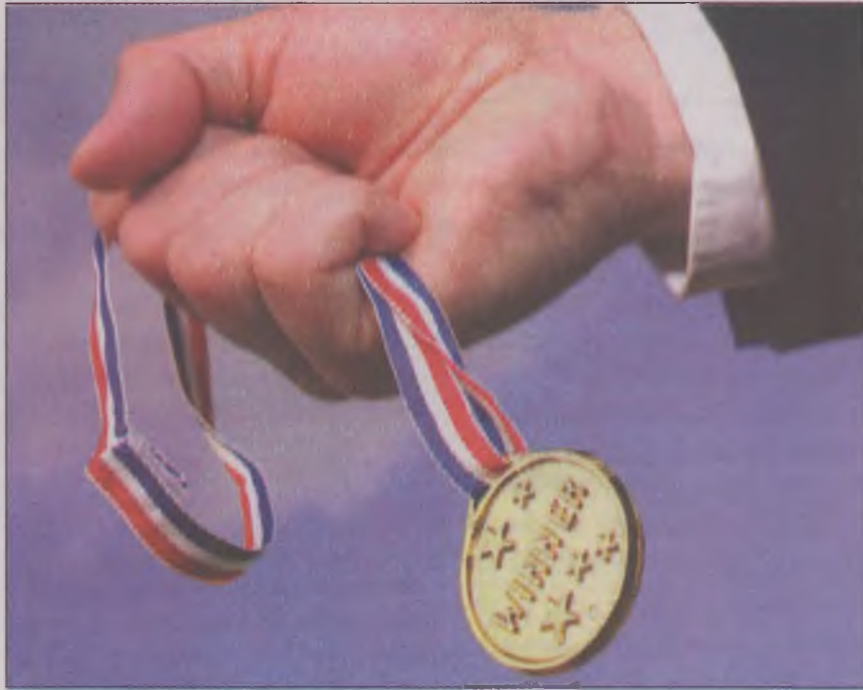
La Olimpiada Internațională de Biologie din Coreea de Sud au participat 233 de concurenți din 58 de țări.