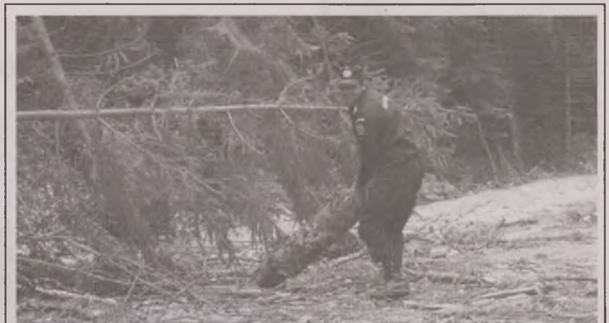
Jandarmii montani din cadrul Postului Câmpu lui Neag au intervenit ieri, în jurul orei 15.00, pentru a îndepărta un copac doborât de vânt pe DN 66 A, în zona Câmpușel. Circulația în zonă s-a desfășurat în condiții normale.