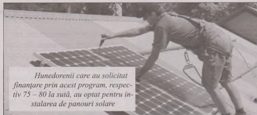
Hunedorenii care au solicitat finanțare prin acest program, respectiv 75 – 80 la sută, au optat pentru instalarea de panouri solare

La mai puțin de o lună de la debutul programului „Casa Verde”, peste o sută de hunedoreni doresc să-și doteze casele cu sisteme de încălzire din surse alternative regenerabile.