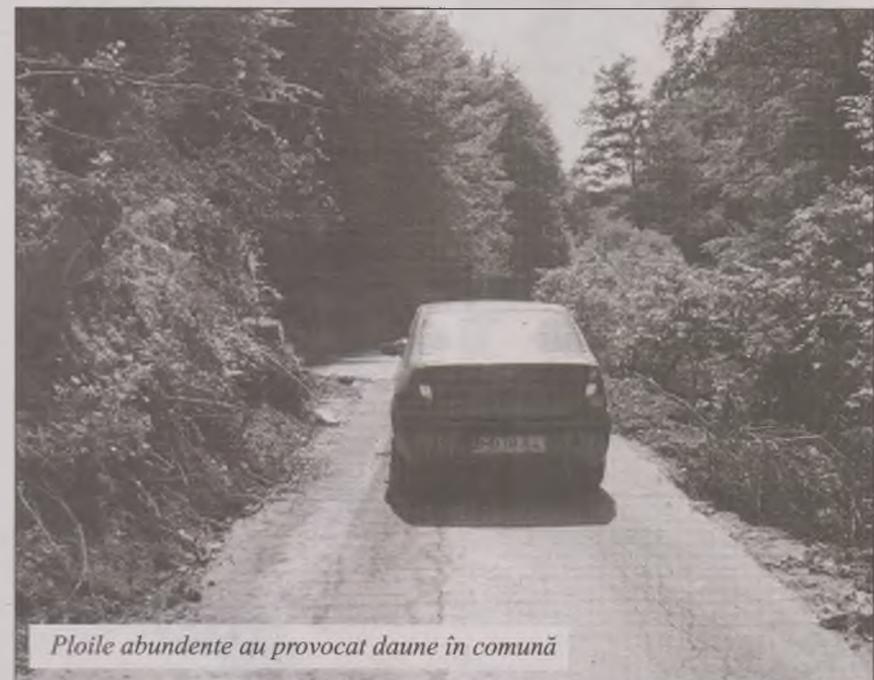
Ploile abundente au provocat daune în comună