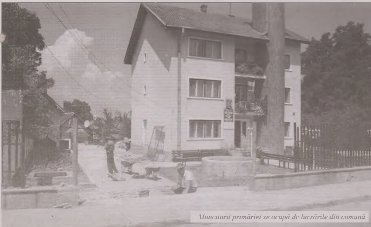
Muncitorii primăriei se ocupă de lucrările din comună