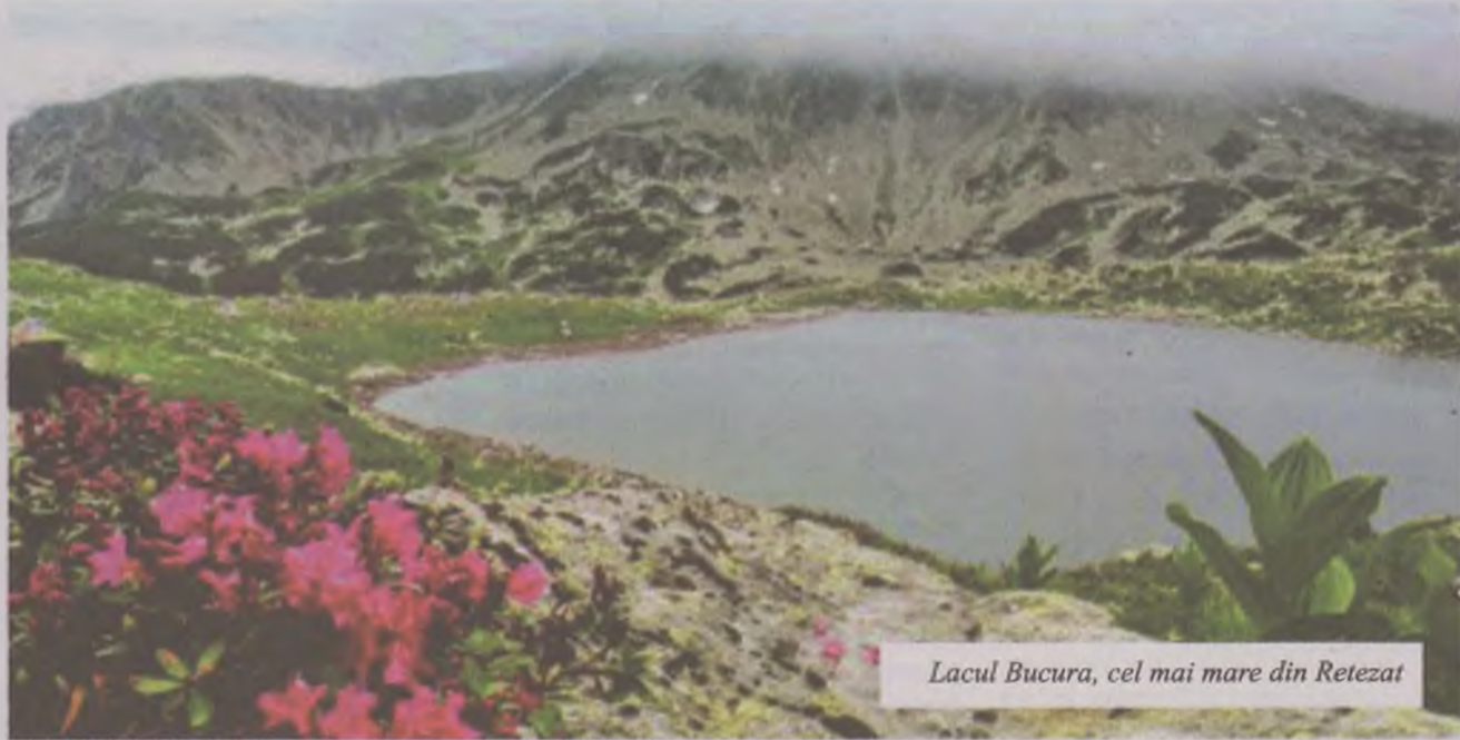
Lacul Bucura, cel mai mare din Retezat

Șirul nordic începe la vest de Vârful Zlata, trece prin Vârful Bucura și Peleaga către Cleanțul