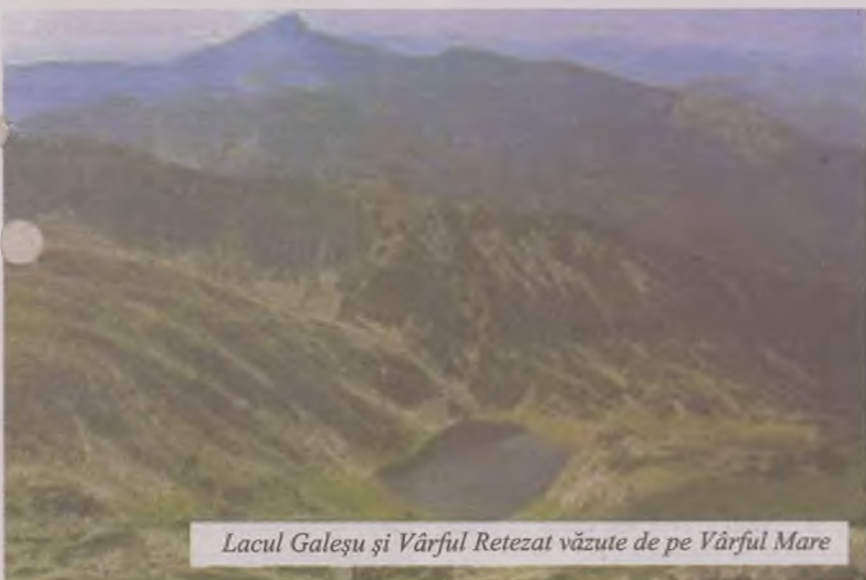
Lacul Galeșu și Vârful Retezat văzute de pe Vârful Mare