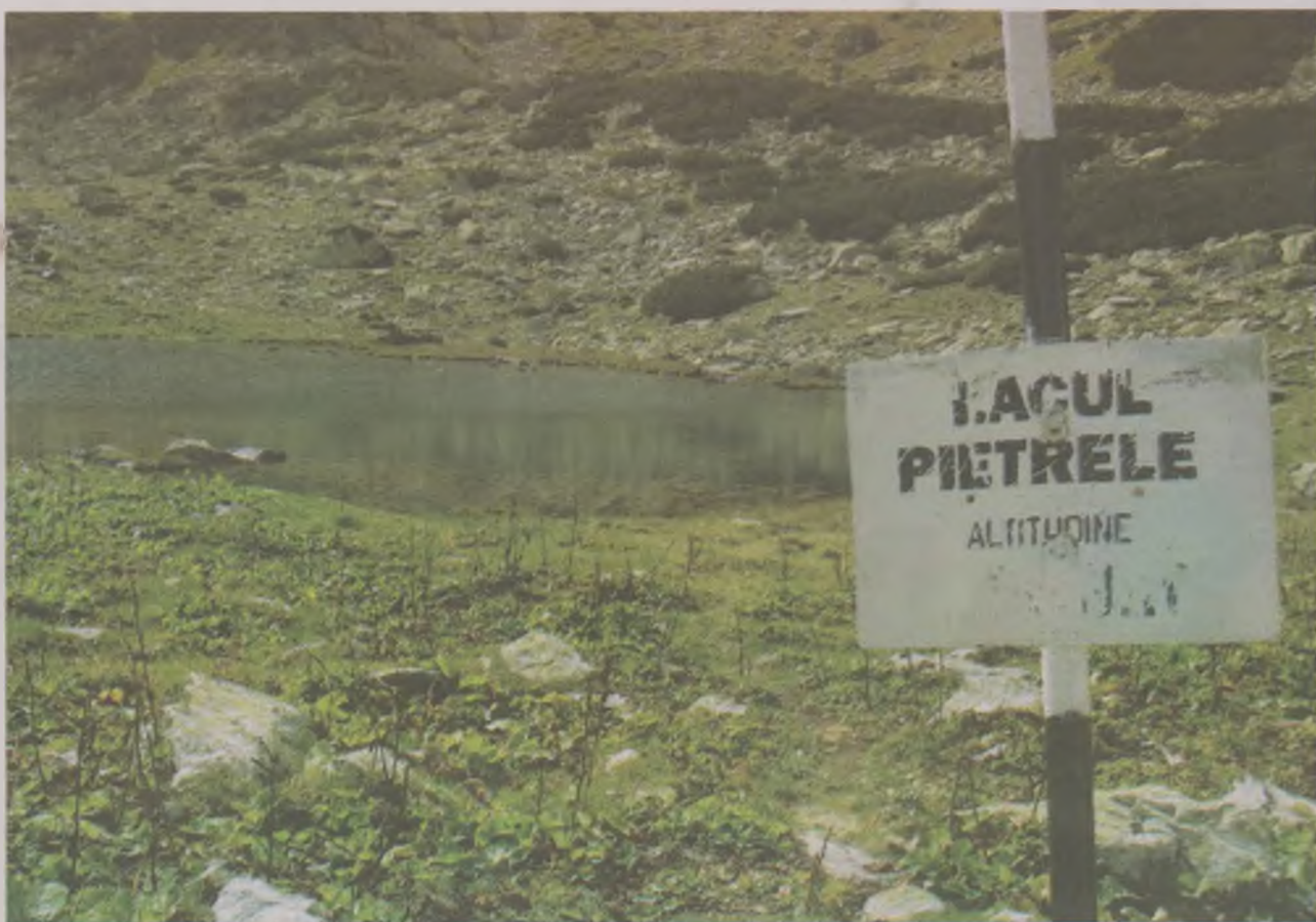
LACUL PIETRELE ALTITUDE