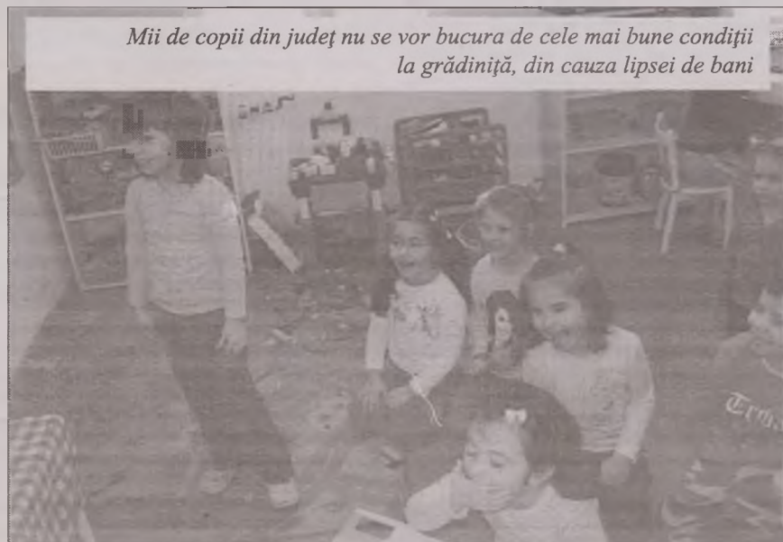
Mii de copii din județ nu se vor bucura de cele mai bune condiții la grădiniță, din cauza lipsei de bani