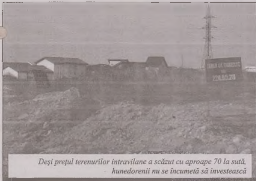
Deși prețul terenurilor intravilane a scăzut cu aproape 70 la sută, hunedoreni nu se încumetă să investească