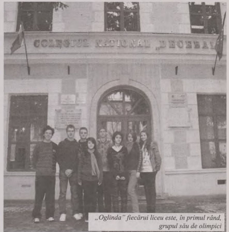
„Oglinda” fiecărui liceu este, în primul rând, grupul său de olimpici