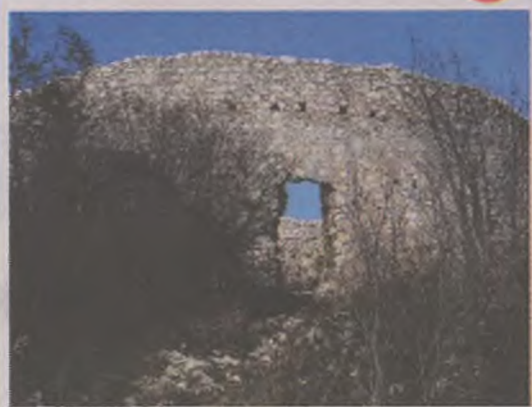
Fortărețele hunedorene (I)