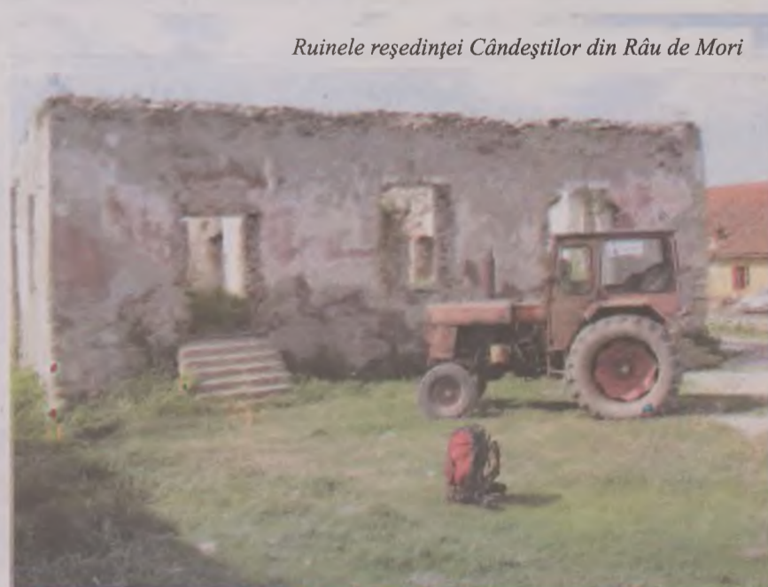
Ruinele reședinței Căndeștilor din Râu de Mori