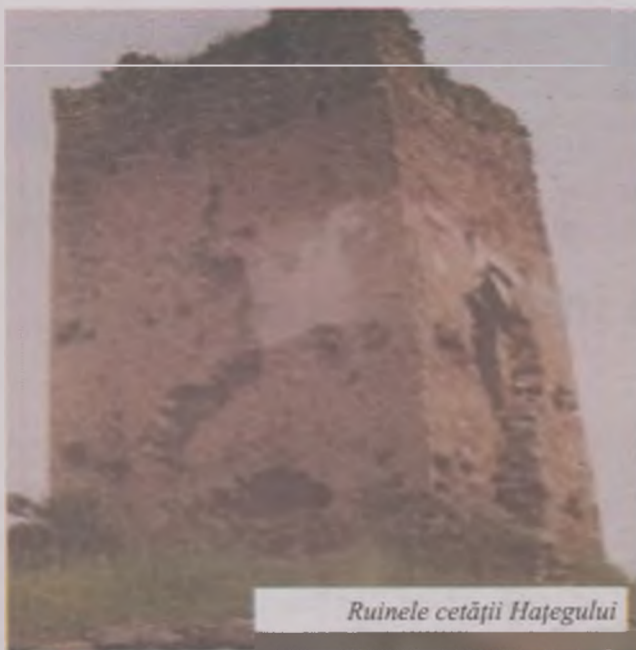
Ruinele cetății Hațegului