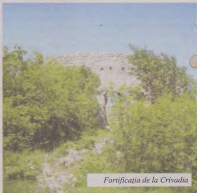
Fortificația de la Crivadia