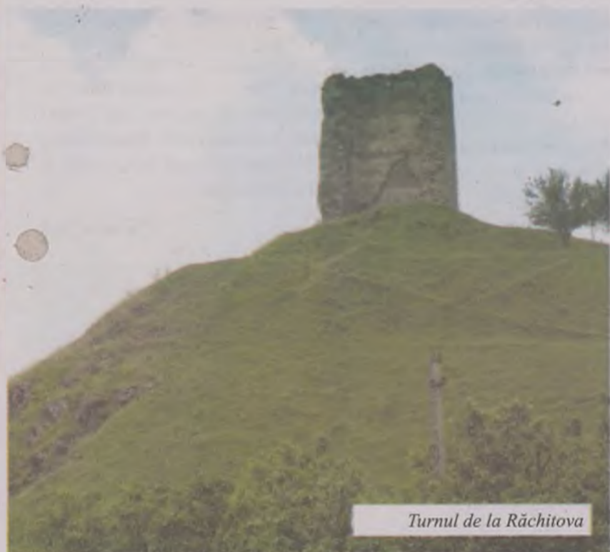
Turnul de la Răchitova