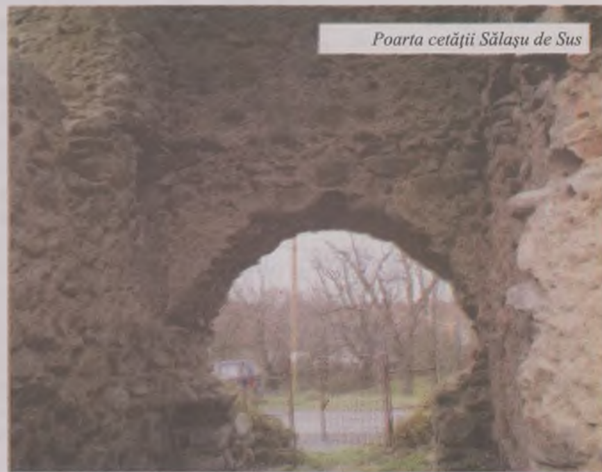
Poarta cetății Sălașu de Sus