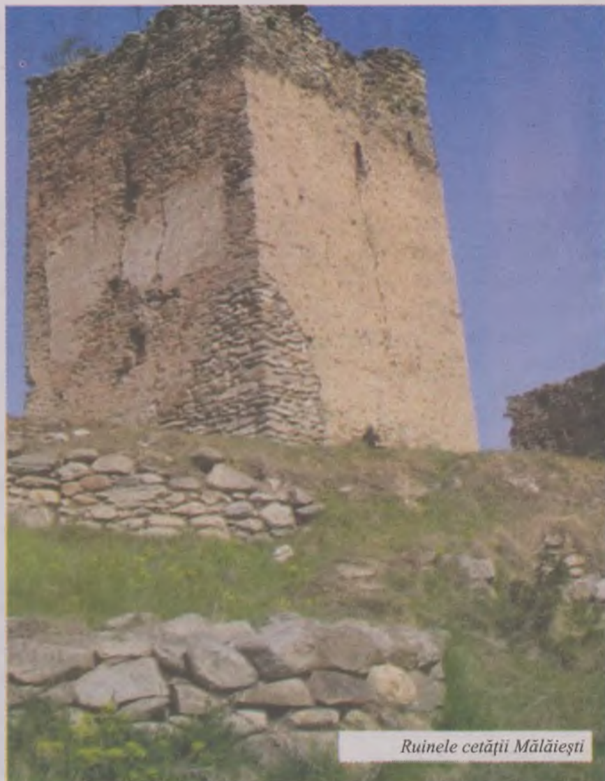
Ruinele cetății Mălăiești

Pentru vitejia și eroismul de care au dat dovadă în luptele cu turcii, câteva din vechile familii cneziale hațegane, își vor lărgii domeniile avansând totodată și în ierarhia socială. Printre ruinele conacului Kendeffy din comuna Râu de Mori, transformat de comuniști, ciudată ironie a soartei, în sediu C.A.P., stă îngropată istoria uneia dintre cele mai vechi familii cneziale din ținutul de la poalele Retezatului, Căndea. Destinul Căndeștilor, cunoscuți sub numele de Kendeffy abia din secolul al XVI-lea, când pentru a-și păstra privilegiile vor trece la religia calvină, este emblematic pentru mulți dintre nobilii din Țara Hațegului. Din rândul lor se vor desprinde, încă din secolul al XIV-lea, două mari familii cneziale: Bărbat, stăpâni peste 33 de sate și Căndea, cu un număr de 40 de sate și părți de sate. În anul 1420, o puternică armată otomană înfrânge sub zidurile cetății Hațegului oștile transilvane conduse de voievodul Nicolae Csaki. Acestuia îi urmează la tron Iancu de Hunedoara. Cunoscător al realităților hațegane, el va deschide practic procesul de