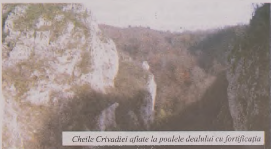
Cheile Crivadiei aflate la poalele dealului cu fortificația

Muntenia. Construcția domina pasul Merișor și cumpăna de ape dintre Strei în nord și Jiu în sud. Ea se înrudește destul de bine cu cele care spre Sibiu, pe Valea Oltului, apărau Pasul Turnu Roșu.