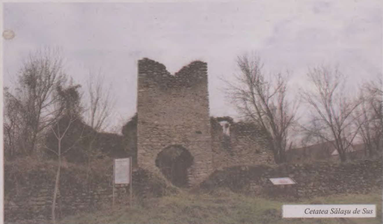
Cetatea Sălașu de Sus