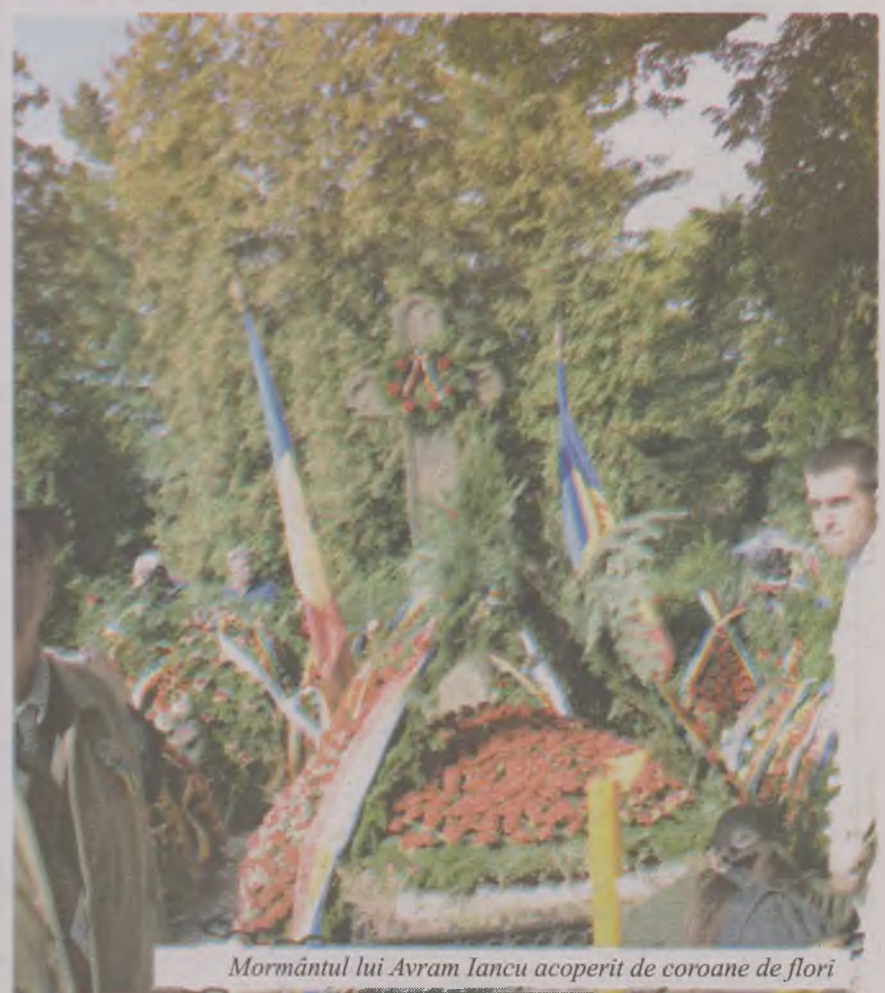
Mormântul lui Avram Iancu acoperit de coroane de flori