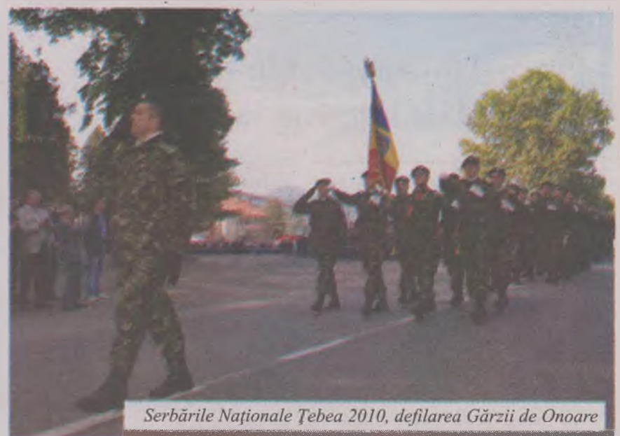
Serbările Naționale Țebea 2010, defilarea Gărzii de Onoare