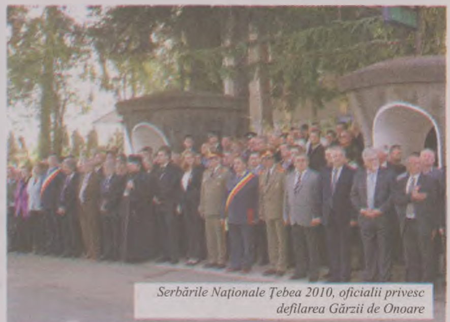
Serbările Naționale Țebea 2010, oficialii privesc defilarea Gărzii de Onoare