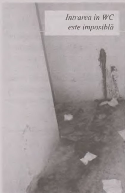
Intrarea în WC este imposibilă