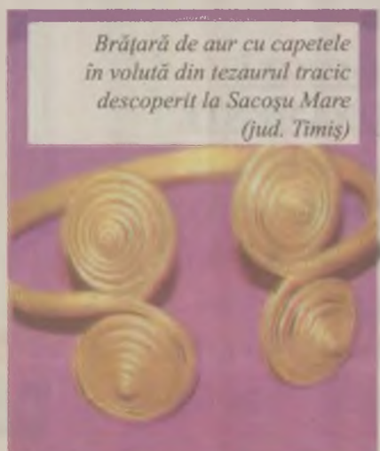
Brățară de aur cu capetele în volută din tezaurul tracic descoperit la Sacoșu Mare (jud. Timiș)