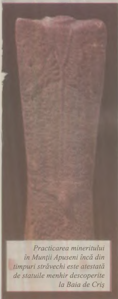
Practicarea mineritului în Munții Apuseni încă din timpuri străvechi este atestată de statuile menhir descoperite la Baia de Criș