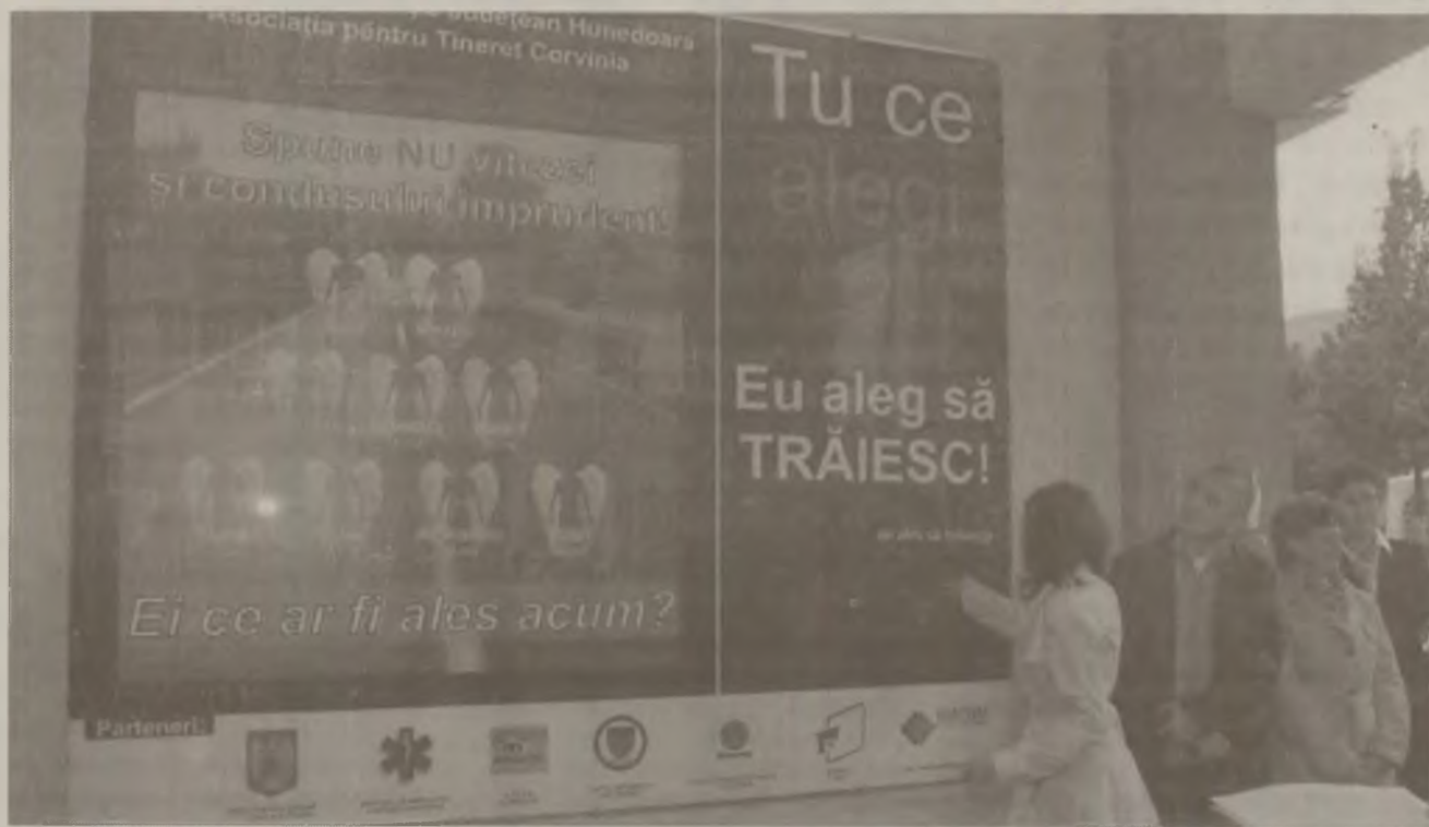
Peste 1.800 de hunedoreni au votat, în doar 24 de ore, pentru viață