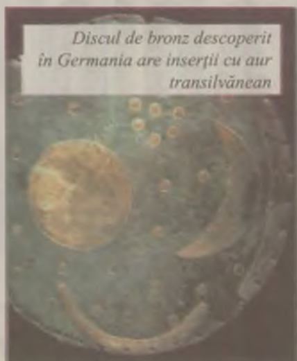
Discul de bronz descoperit în Germania are inserții cu aur transilvănene