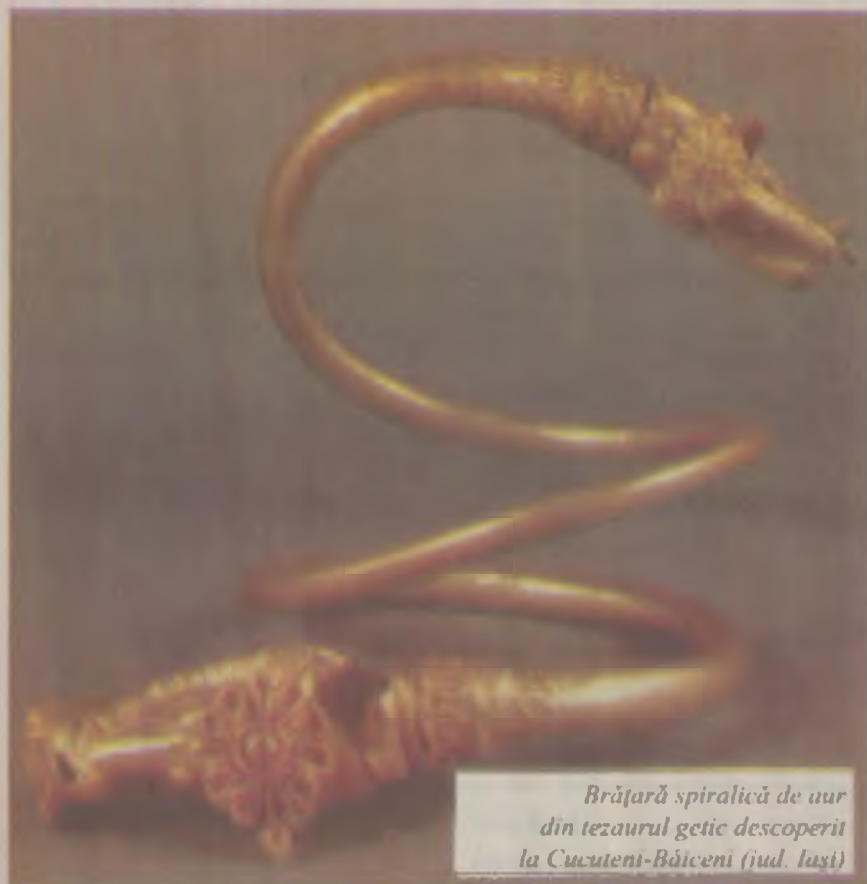
Brățară spiralică de aur din tezaurul getic descoperit la Cucuteni-Băiceni (jud. Iași)