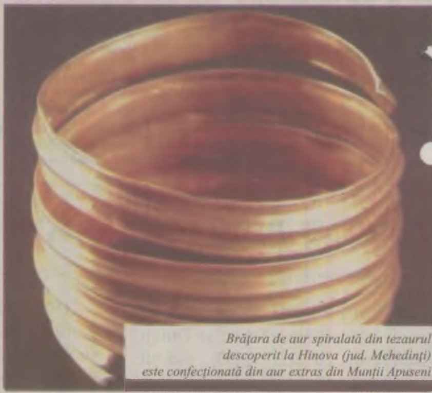
Brățara de aur spiralată din tezaurul descoperit la Hinova (jud. Mehedinți) este confecționată din aur extras din Munții Apuseni