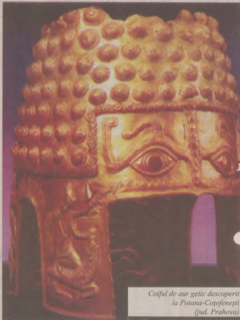
Coiful de aur getic descoperit la Poiana-Coșofenești (jud. Prahova)