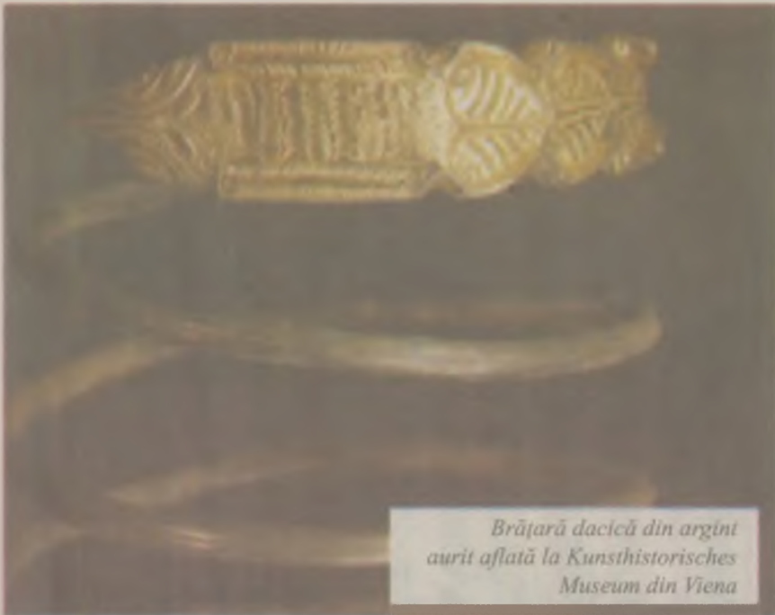
Brățară dacică din argint aurit aflată la Kunsthistorisches Museum din Viena