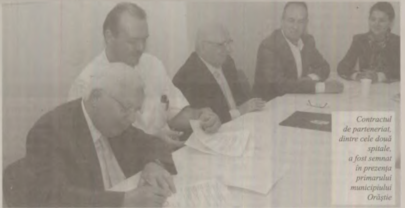
Contractul de parteneriat, dintre cele două spitale, a fost semnat în prezența primarului municipiului Orăștie