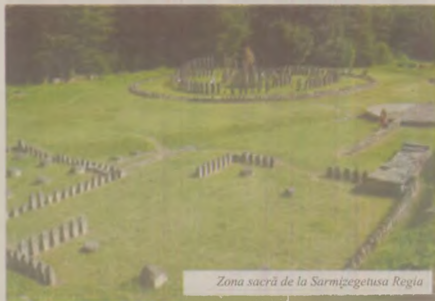
Zona sacră de la Sarmizegetusa Regia