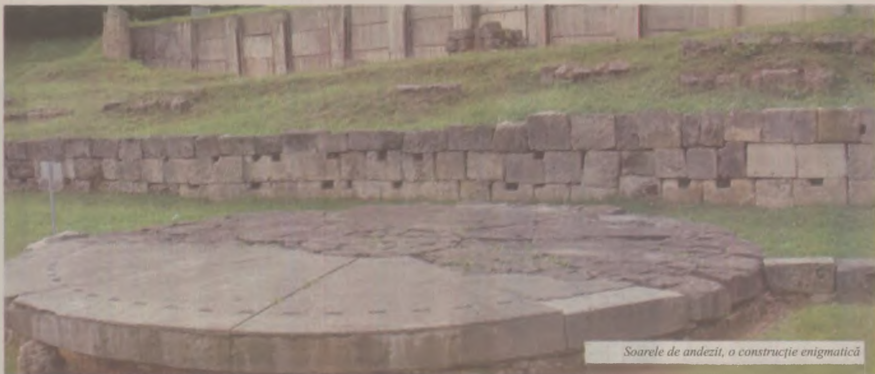
Soarele de andezit, o construcție enigmatică