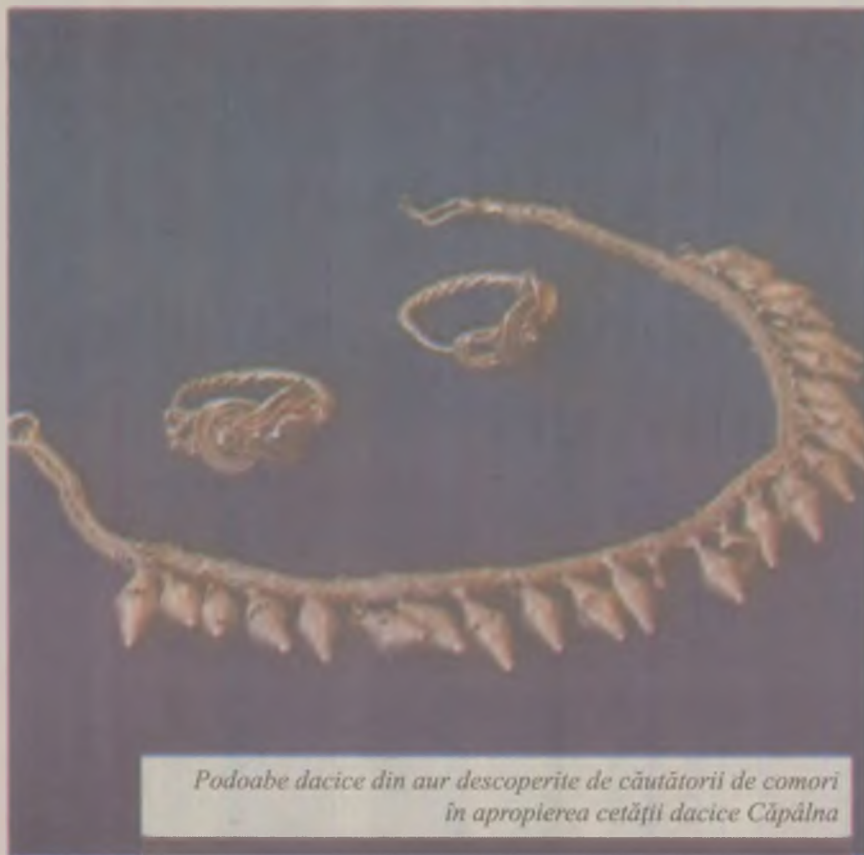
Podoabe dacice din aur descoperite de căutătorii de comori în apropierea cetății dacice Căpâlna