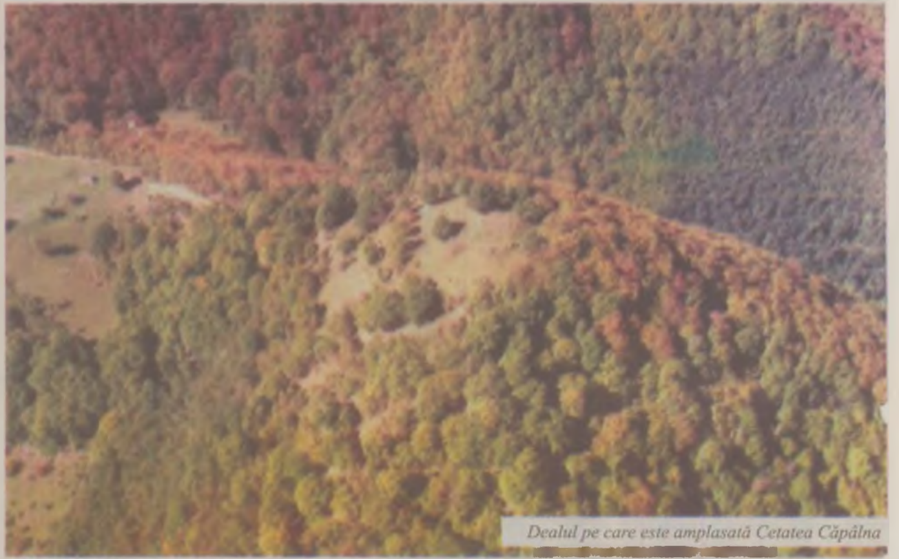
Dealul pe care este amplasată Cetatea Căpâlna

Ascunse azi sub stratul gros de sol și năpădite de flori, aproape toate cetățile dacice, ridicate pe dealuri și culmi muntoase greu accesibile, la fel ca și cea de la Căpâlna, au fost descoperite și studiate relativ recent, de către arheologi. Până la săpăturile, inițiate în prima jumătate a secolului trecut, de către Constantin Daicoviciu și desfășurate în mai multe etape, se știau extrem de puține lucruri despre ruinele de pe Dealul Cetății de la Căpâlna, din versantul stâng al râului Sebeș. Au urmat, din anul 1939 și până în anul 1954, trei campanii de săpături în care s-au scos la lumină: primul val de pământ de pe sa, turnul-locuință și parțial construcțiile de pe același nivel, precum și scara spre o altă