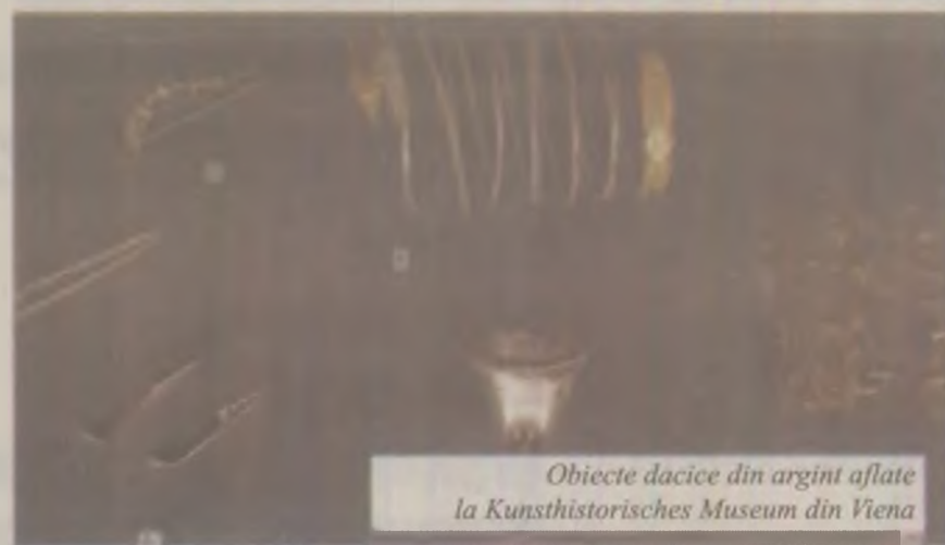
Obiecte dacice din argint aflate la Kunsthistorisches Museum din Viena