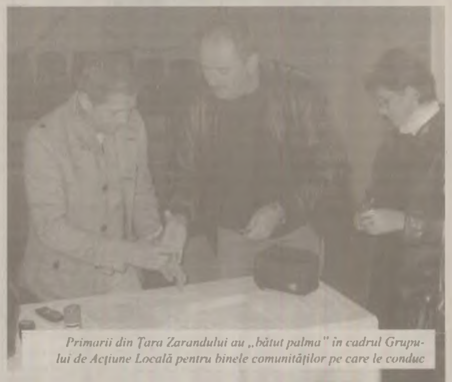
Primarii din Țara Zarandului au „bătut palma” în cadrul Grupului de Acțiune Locală pentru binele comunităților pe care le conduc

acestei sesiuni vor fi selectate aproximativ 80 de GAL-uri.