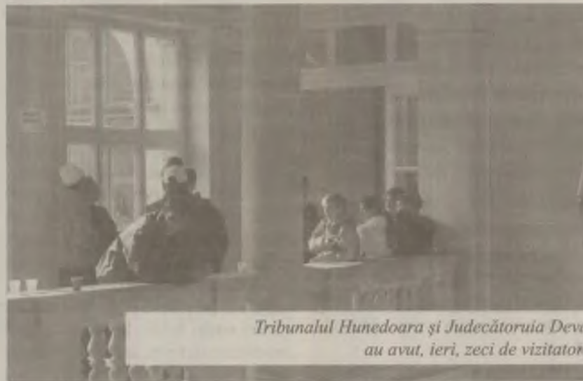
Tribunalul Hunedoara şi Judecătoria Deva au avut, ieri, zeci de vizitatori.

Atât tinerii care au venit în grupuri organizate de la şcoli, cât şi cetăţenii, care au dorit să afle mai multe informaţii despre circuitul cererii de chemare în judecată, etapele procesuale care se parcurg până la soluţionarea unui caz sau cum se procedează în cazul martorilor aflaţi sub identitate secretă, au fost încântaţi că au avut posibilitatea să asiste la procese şi să viziteze sălile de judecată. Spre deosebire de anul trecut, anul acesta sălile de