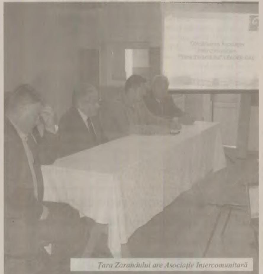
Țara Zarandului are Asociație Intercomunitară

Constituirea GAL-urilor este un tip de asociere micro-regională sub forma parteneriatului public – privat în cadrul căruia se regăsesc administrația și serviciile publice – pe de o parte și agenții economici, asociațiile nonprofit sau persoanele fizice interesate – pe de altă parte. Până în prezent au fost înființate în județul Hunedoara patru GAL-uri. După întemeierea unui GAL, comunitățile rurale pot accesa o serie de fonduri prin Programul Național pentru Dezvoltare Rurală (PNDR), Programul Operațional Sectorial Dezvoltarea Resurselor Umane (POSDRU) sau prin intermediul programelor gestionate de Administrația Fondului pentru Mediu (AFM). Chiar și întemeierea GAL-urilor este susținută financiar prin aceste programe. Astfel, în aceste zile se derulează sesiunea de selecție a GAL-urilor în cadrul axei 4 Leader a PNDR. Depunerea Planurilor de Dezvoltare Locală se face la sediul Direcției pentru Agricultură și Dezvoltare Rurală (DADR) Hunedoara până la data de 15 noiembrie 2010, după ce termenul limită de 29 octombrie a fost prelungit. Potențialul GAL pentru care se solicită finanțare trebuie să îndeplinească cerințele de conformitate și eligibilitate cuprinse în Ghidul solicitantului. La nivel național, fondurile alocate pentru GAL-uri se cifrează la 228.543.337 euro. Suma maximă care poate fi solicitată de un GAL este de 2.856.791 euro. În cadrul