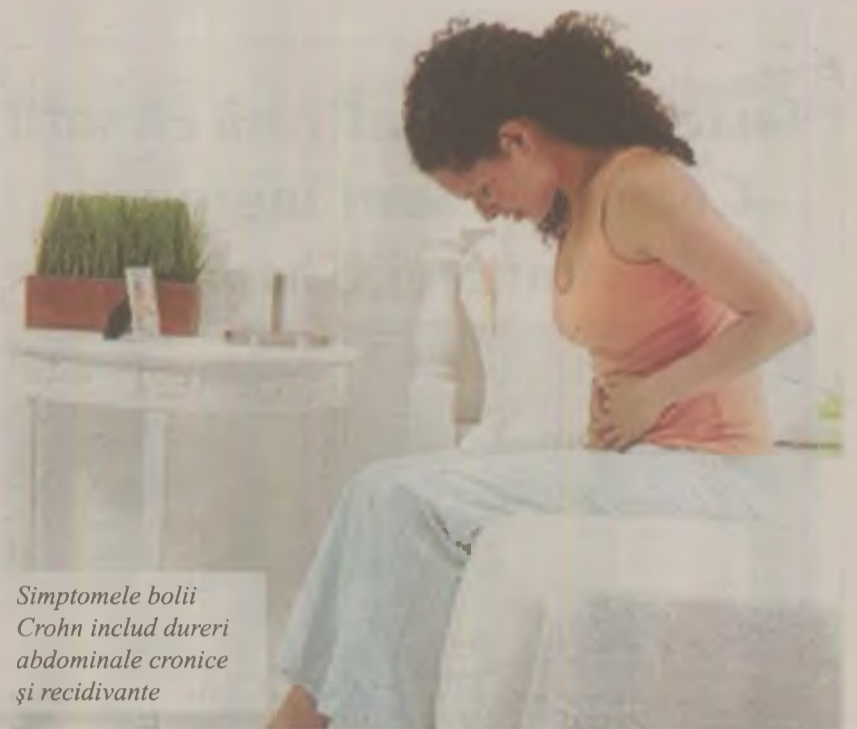
Simptomele bolii Crohn includ dureri abdominale cronice și recidivante

În boala Crohn cu o evoluție trenantă, îndelungată, poate apărea înlocuirea țesutului inflammat sau ulcerat cu un țesut de granulație (cicatrice), favorizând astfel apariția obstrucției intestinale (blocaje intestinale). Această complicație este destul de des întâlnită în această afecțiune și stopează tranziția fiziologică a alimentelor. Ocluziile intestinale pot fi determinate și de inflamația accentuată a intestinului, care însă poate fi ameliorată prin administrarea medicației antiinflamatorii. Majoritatea cazurilor de ocluzie intestinală necesită însă tratament chirurgical. În cazul în care boala se complică prin apariția fistulelor, există un risc mare de infecție la acest nivel.