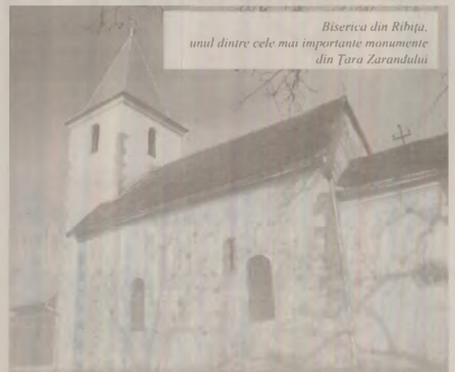
Biserica din Ribița, unul dintre cele mai importante monumente din Țara Zarandului