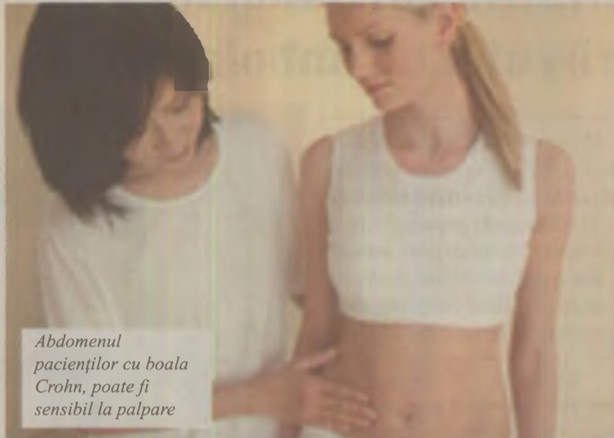
Abdomenul pacienților cu boala Crohn, poate fi sensibil la palpare

Simptomele bolii Crohn includ dureri abdominale cronice și recidive.