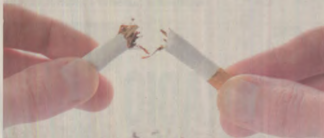
Stoparea fumatului aduce un beneficiu în evoluția bolii Crohn