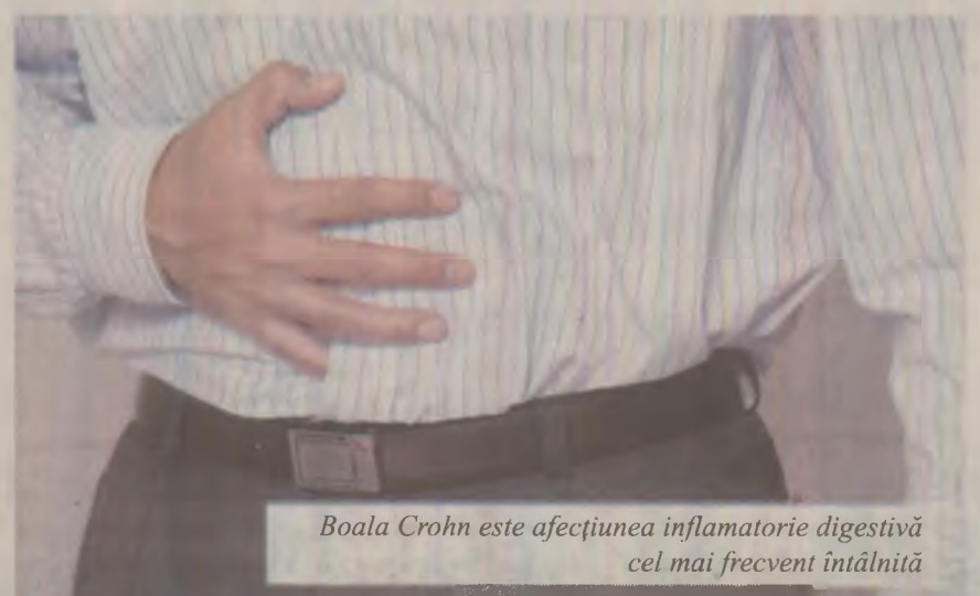
Boala Crohn este afecțiunea inflamatorie digestivă cel mai frecvent întâlnită