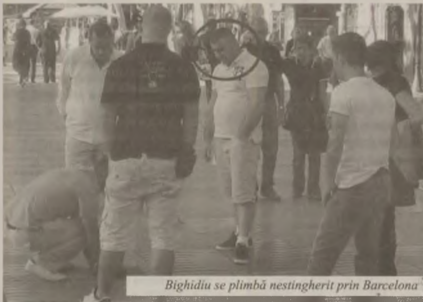
Bighidiu se plimbă nestingherit prin Barcelona

„Nu vreau să le fac probleme prietenilor mei așa că nu am să spun unde am locuit, dar am stat două săptămâni în județul Hunedoara, și nu m-am ferit