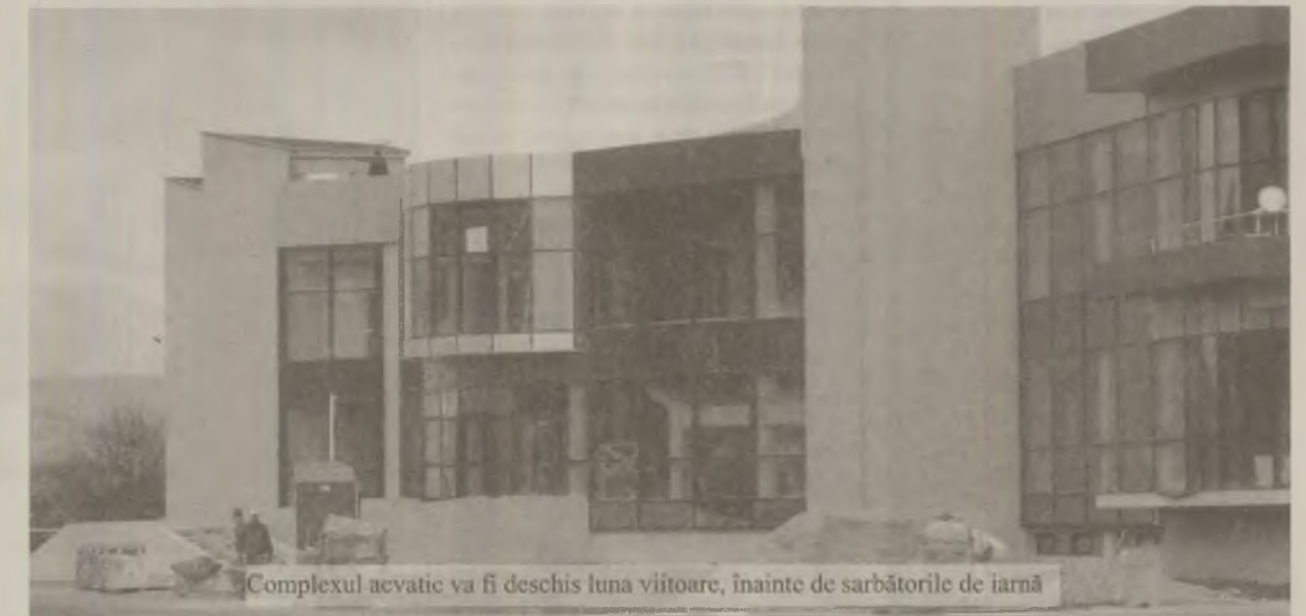
Complexul acvatic va fi deschis luna viitoare, înainte de sărbătorile de iarnă

Lucrările de construire a parcului acvatic din Deva au început în urmă cu șase ani, iar valoarea totală a investiției se ridică la aproximativ zece milioane de euro. Ca mărime, Aqualand Deva este al doilea parc acvatic din țară, după cel amenajat la Brașov, care se diferențiază prin faptul că dispune și de un strand exterior. Aqualand Deva dispune de o suprafață construită de 4.200 de metri pătrați, care adăpostește 600 de metri pătrați de luciu de apă. În interiorul complexului sunt amenajate cinci bazine de înot cu diferite dimensiuni, o parte dintre acestea dispunând și de instalație generatoare de valuri. De altfel, unul din bazine este special amenajat pentru cei mici, unde atât adâncimea apei, cât și mărimea valurilor este adecvată pentru copiii cu vârste cuprinse între 2 și 4 ani. Capacitatea parcului acvatic este de 500 de persoane simultan, care pot beneficia de tobogane, jacuzzi,