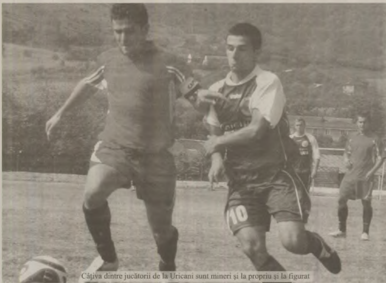
Câțiva dintre jucătorii de la Uricani sunt mineri și la propriu și la figurat

Tehnicianul echipei din sudul județului vrea ca echipa sa să iasă campioană de toamnă și este convins că elevii săi vor face o figură frumoasă în derbiul din ul-