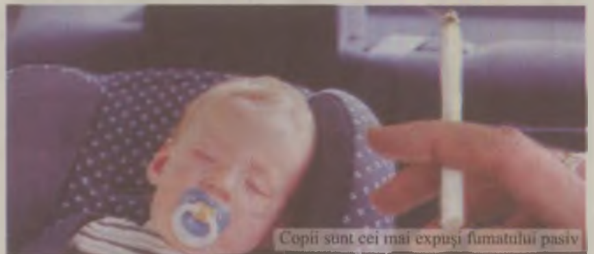
Copii sunt cei mai expuși fumatului pasiv

8. Dacă aveți un tic din a ține o țigară în gură, înlocuiți-o cu o scobitoare.