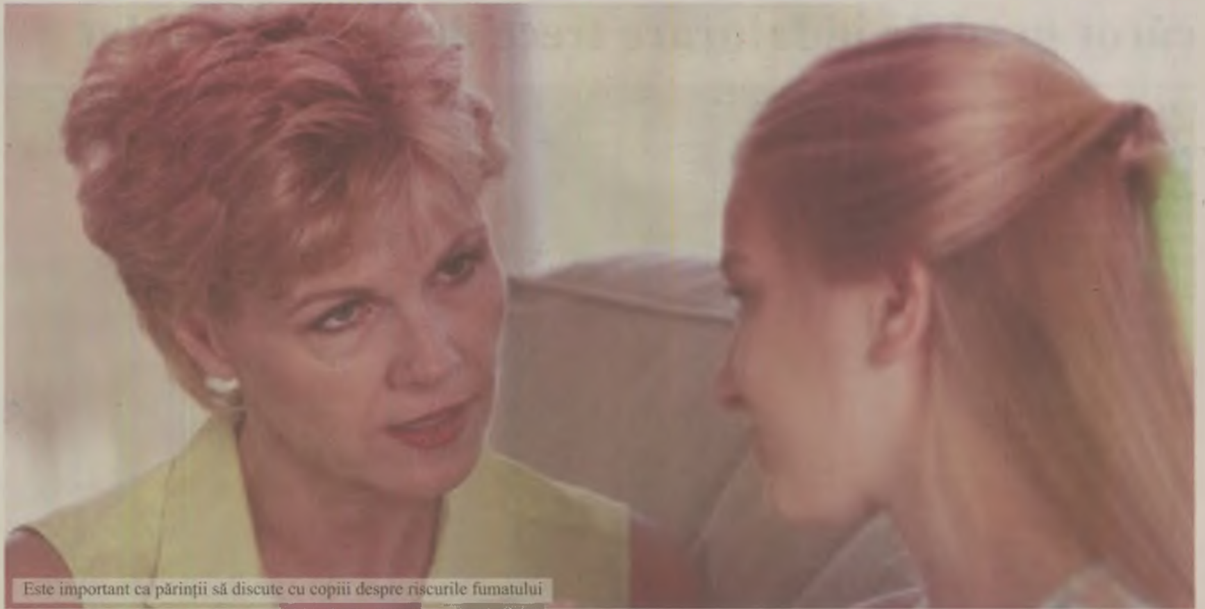
Este important ca părinții să discute cu copiii despre riscurile fumatului

Cancerul și fumatul pasiv Fumul conține substanțe care favorizează apariția tumorilor maligne. Aceste substanțe nu sunt prezente numai la fumători, ci au fost detectate și în organismul fumătorilor pasivi. În plus, cu cât expunerea la fum este mai prelungită, cu atât concentrația substanțelor crește în anumite organe, în sânge, în urină. Studiul efectelor pe care le are fumatul pasiv asupra apariției cancerului este dificil. Substanțele toxice produse prin arderea tutunului trebuie să acționeze o perioadă lungă de timp înainte ca o eventuală tumoră canceroasă să fie detectată. Cercetările științifice au demonstrat că acest risc există. Substanțele nocive din fumul de țigară nu-i afectează doar pe cei care fumează. Fumatul pasiv, ce constă în respirarea aerului poluat de țigările celorlalți, este la fel de nociv și crește riscul îmbolnăvirilor la cei supuși acestei poluări. După o oră de fumat într-o cameră închisă, nefumătorul care se află în aceeași încăpere cu cel care