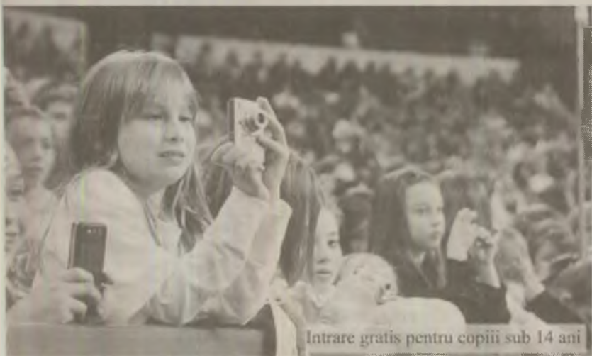
Intrare gratis pentru copiii sub 14 ani

Decizia a fost luată cu 57 de voturi „pentru” și o abținere. (C.S.)