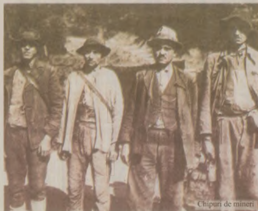
Chipuri de mineri

Unul dintre cele mai importante și mai vechi drumuri, care pleacă de la Deva spre vest, traversează Mureșul, iar după câțiva kilometri la Bejan, se bifurcă spre nord către Brad, localitate intrată în istorie ca centru al uneia dintre cele mai intense activități miniere din Munții Apuseni. După ce traversează apele molcome, adânci și înșelătoare ale Mureșului, drumul principal se bifurcă și se avântă dincolo de calcarele de la Băița - Crăciunești, într-un peisaj de vis, către Brad, spre inima Munților Metaliferi. Acest sector muntos delimitat de culoarul Deva – Ormindea și Valea Ampoiului care se extinde la nord de Mureș, dincolo de depresiunea Brad, până spre Roșia Montană și Baia de Arieș este format dintr-o complicată