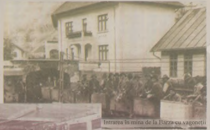
Intrarea în mina de la Barza cu vagonetii