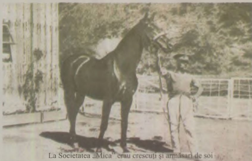
La Societatea „Mica” erau creșcuți și armăsari de soi

colo de munte de la Roșia Montană, în perioada dintre cele două războaie mondiale.