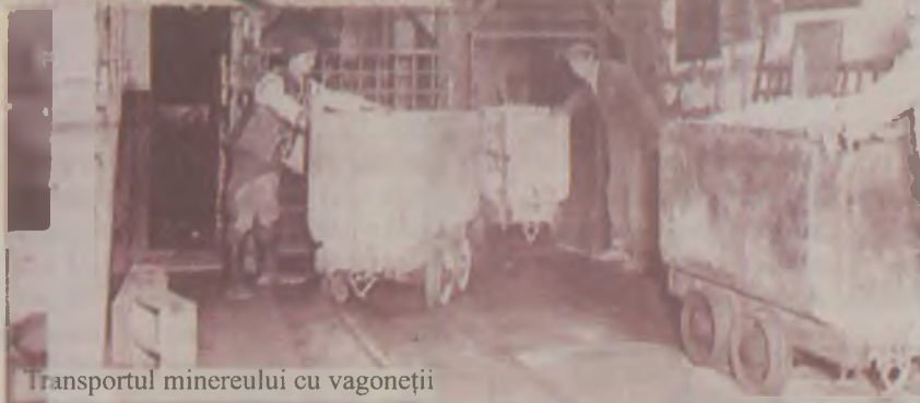
Transportul minereului cu vagonetii

structură de roci cristaline extrem de vechi și roci sedimentare mai noi, străbătute ulterior de corpuri de roci vulcanice și subvulcanice care au produs importante mineralizații. El a intrat în istorie datorită bogatelor sale zăcăminte de metale prețioase sub numele de „Patruleterul Aurifer”.