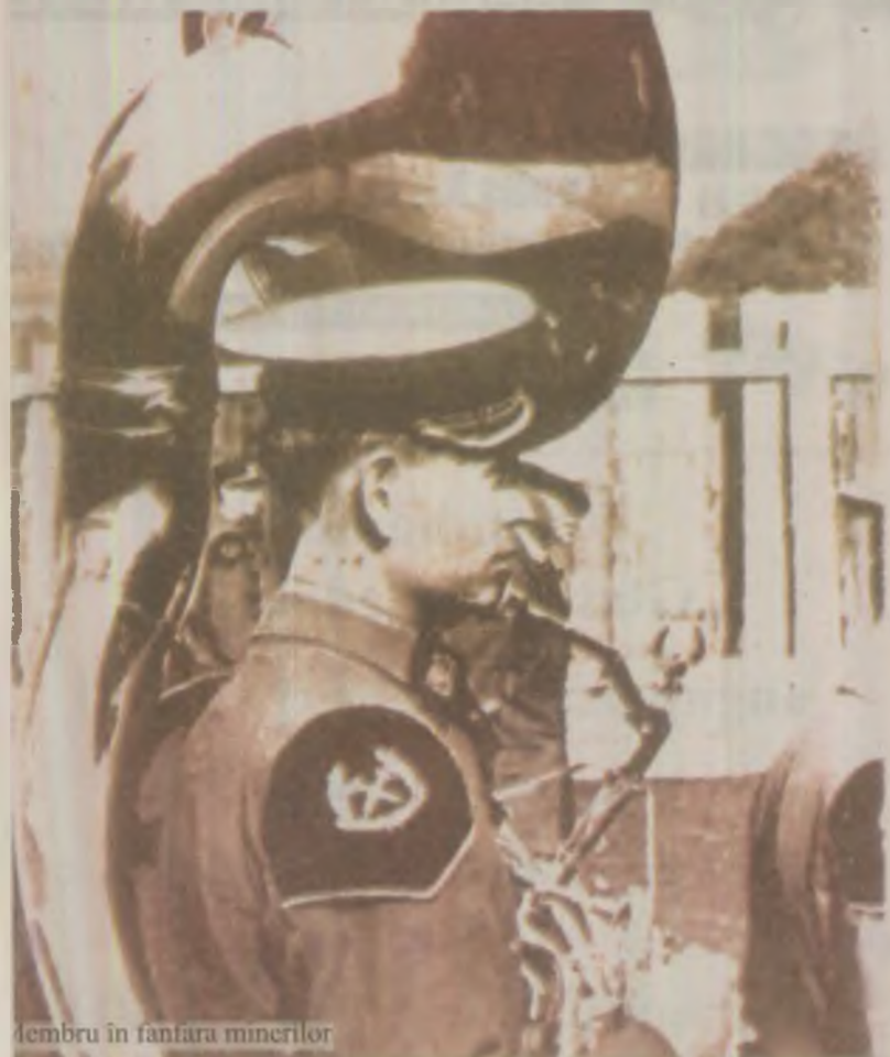
Membru în fanfara minerilor