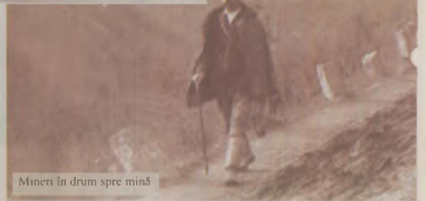
Mineri în drum spre mină

la cei din vechime toate secretele mineritului. Astăzi nimeni nu le va dărâma zidurile acestor amintiri. Singurul lor dușman rămâne timpul. Oamenii locului încă mai speră să se întoarcă la ceea ce știu mai bine să facă. Să smulgă aurul pe care îl simt ascuns în inima muntelui. Pentru a zdrobi și măcina minereul au inventat cândva roți, hidraulice și șteampurile alimentate de apa tăurilor, suspendate astăzi la capătul tuturor văilor ce coboară din versanți. Au încercat apoi toate metodele de extracție și de recuperare a aurului