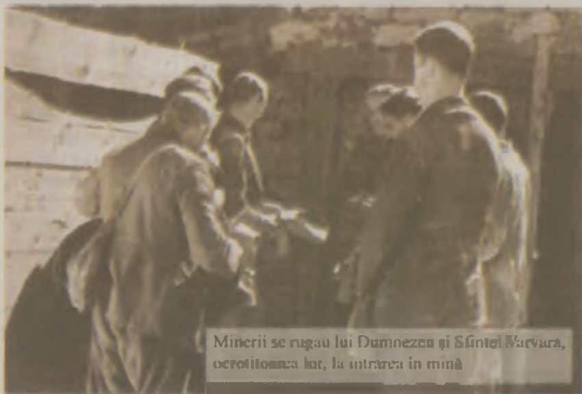
Minerii se rugau lui Dumnezeu și Sfintei Varvara, ocrotitoarea lor, la intrarea în mină

Cristina Rișcuța – istoric : „...Toate realizările de ordin social, cultural, economic... la Roșia Montană trebuie înțelese strict în raport cu ponderea capitalului și cu puterea capitalului economic al statului acolo. Și sigur dacă acest capital a fost redus, deci... dacă investițiile au fost reduse, atunci și realizările au fost la fel de reduse... ei... La Brad, Societatea „Mica” având acționari de talia lui Ion Gigurtu și a câtorva bănci, sigur că și realizările au fost pe măsura investițiilor, adică mari și foarte importante”.