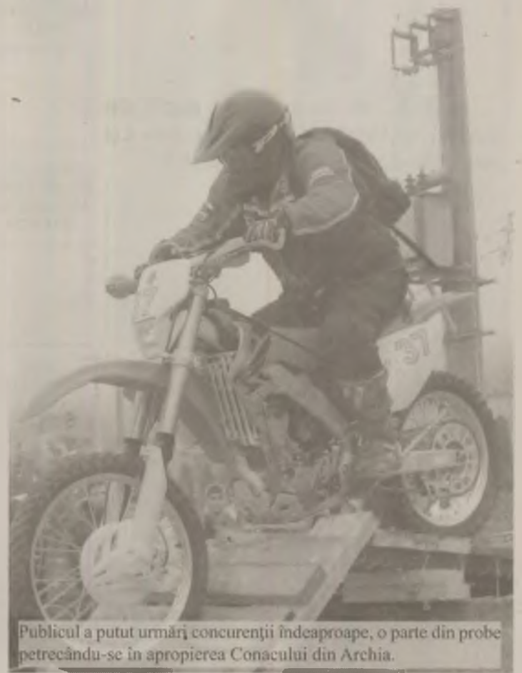
Publicul a putut urmări concurenții îndeaproape, o parte din probe petrecându-se în apropierea Conacului din Archia.

Zeci de pasionați ai motociclismului au participat, ieri, la un concurs inedit de Enduro, organizat de Clubul „Haita” din Deva.