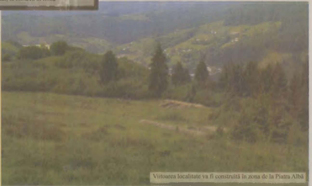
Viitoarea localitate va fi construită în zona de la Pietra Albă

După recenta închidere a minelor de la Roșia Montană, singura speranță pentru oamenii locului îl reprezintă preconizatul proiect minier de exploatare modernă a impresionantului zăcământ de aur care se ascunde în adâncurile muntelui. Același gen de proiect a fost probat recent, departe de aceste locuri are suferă în tăcere, undeva în Finlanda, în cazul unui zăcământ aproape identic cu acesta. Primii care au aflat de asta au fost locuitorii Roșiei Montane din împrejurimi, mineri din tată în fiu, care mai visează încă la aurul ascuns în inima muntelui, dar și la sezarea modernă preconizată să fi ridi-