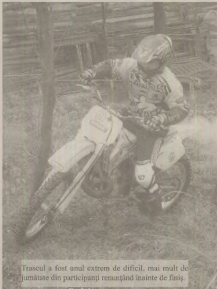
Traseul a fost unul extrem de dificil, mai mult de jumătate din participanți renunțând înainte de finis.