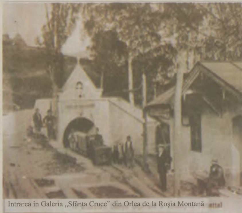
Intrarea în Galeria „Sfânta Cruce” din Orlea de la Roșia Montană (arhivă)

S-au închis recent ultimele abataje care mai scoteau din subteran sau din cariere, aurul de la Roșia Montană. Doar Piatra Corbului, singulară, de pe