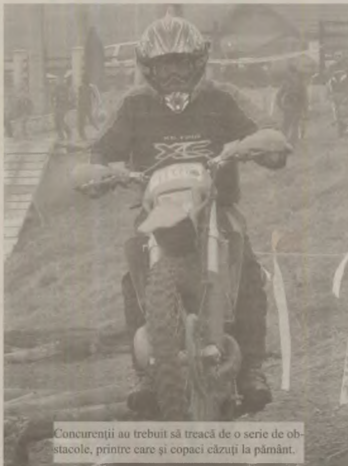
Concurenții au trebuit să treacă de o serie de obstacole, printre care și copaci căzuți la pământ.