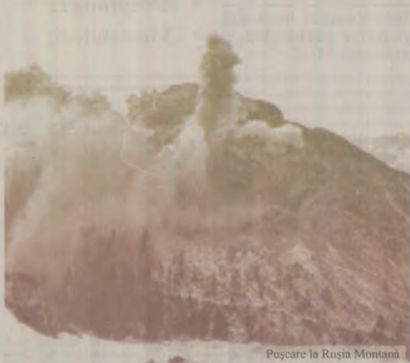
Pușcare la Roșia Montană