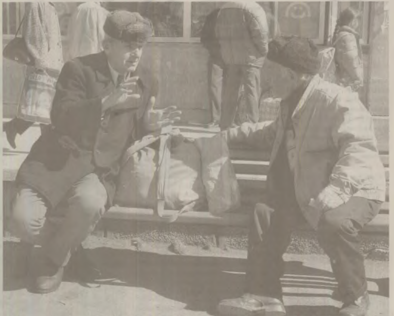
Pensionarii încă mai așteaptă, probabil, să primescă banii promiși de Mariana Câmpeanu

Candidatul parașutat de PNL în Colegiul 3 Hațeg, Mariana Câmpeanu, îi minte pe alegători în dorința de a câștiga voturile acestora, în special pe cel al pensionarilor. Mariana Câmpeanu nu are nici un argument solid pentru a fi votată într-o zonă prin care a trecut doar ca turistă, și în această situație inventează minciuni pe care foarte puțină lume le poate verifica. Una dintre „legende” populiste lansate de Câmpeanu este legată de aportul ei în majorarea pensiilor, pe vremea când conducea Ministerul Muncii. În realitate, Mariana