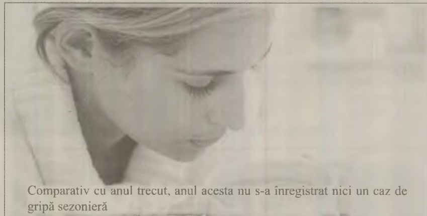
Comparativ cu anul trecut, anul acesta nu s-a înregistrat nici un caz de gripă sezonieră