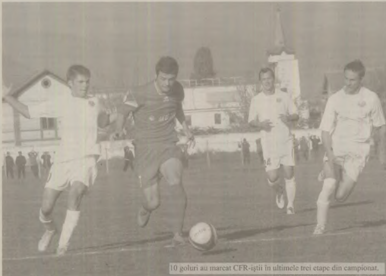
10 goluri au marcat CFR-iștii în ultimele trei etape din campionat.