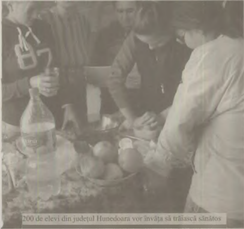
200 de elevi din județul Hunedoara vor învăța să trăiască sănătos

Inspectoratul Școlar Județean (ISJ) Hunedoara organizează luni, un concurs care se adresează elevilor din clasele IV-XII care participă la activități extracurriculare sau extrașcolare de educație pentru sănătate. Concursul se va desfășura pe două categorii de vârstă: clasele IV-VIII și X-XII. Vor participa două sute de elevi din județul Hunedoara, iar câștigarea va fi tip grilă, portofoliu.