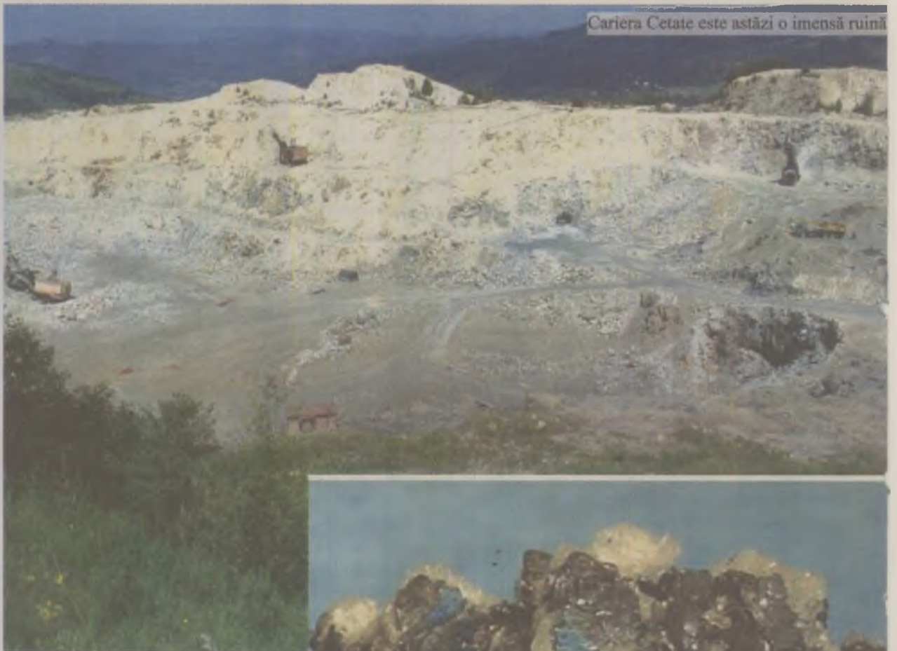
Cariera Cetate este astăzi o imensă ruină