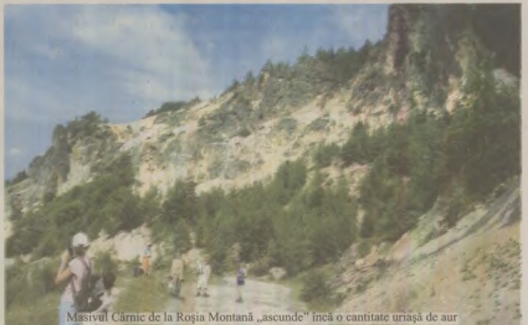
Masivul Cărnice de la Roșia Montană „ascunde” încă o cantitate uriașă de aur

tel/fax: 0354/501021/22, e-mail: silva@silva.ro