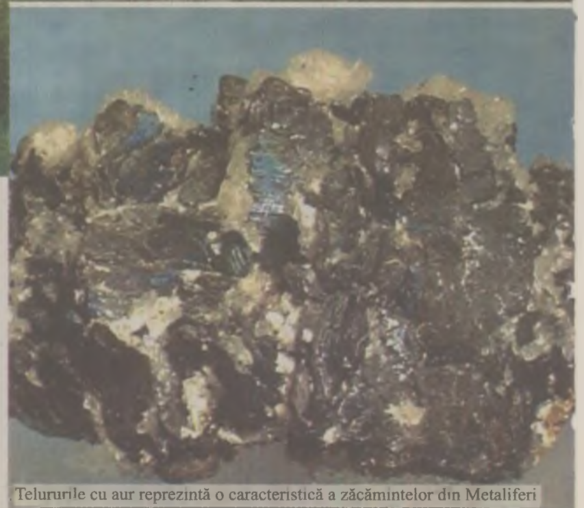
Telururile cu aur reprezintă o caracteristică a zăcămintelor din Metaliferi

Zăcămintele aurifere, strict secret argint, cupru, uraniu sau alte meta strategice au fost păzite cu strășnicie în România după 1948, datele referitoare la zăcămintele și rezervele de aur, secrete de stat și încă mai sunt inaccessibile și astăzi cercetătorilor și oam-