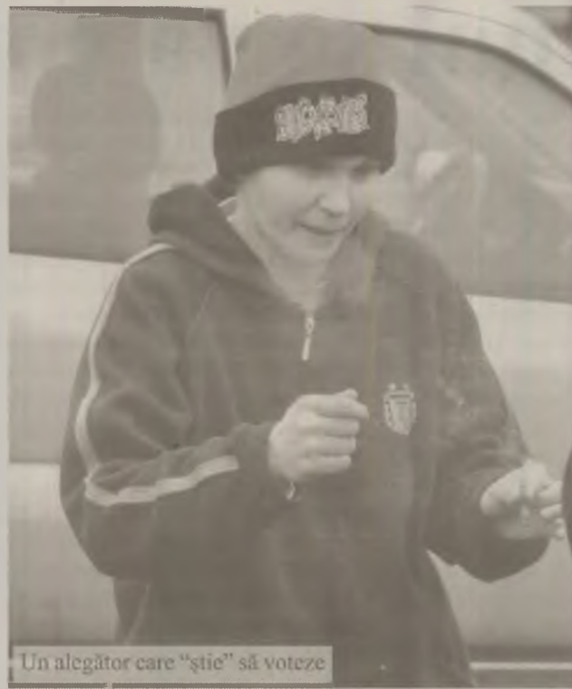
Un alegător care „știe” să voteze

Un număr de 13 persoane cu handicap psihic, dar care nu au fost puse sub interdicție, și-au exercitat dreptul de vot la școala din Păclișa. Numărul electorilor cu probleme psihice nu este oficial ci i-a scăpat președintelui secției involuntar într-o discuție cu jurnaliștii, pen-