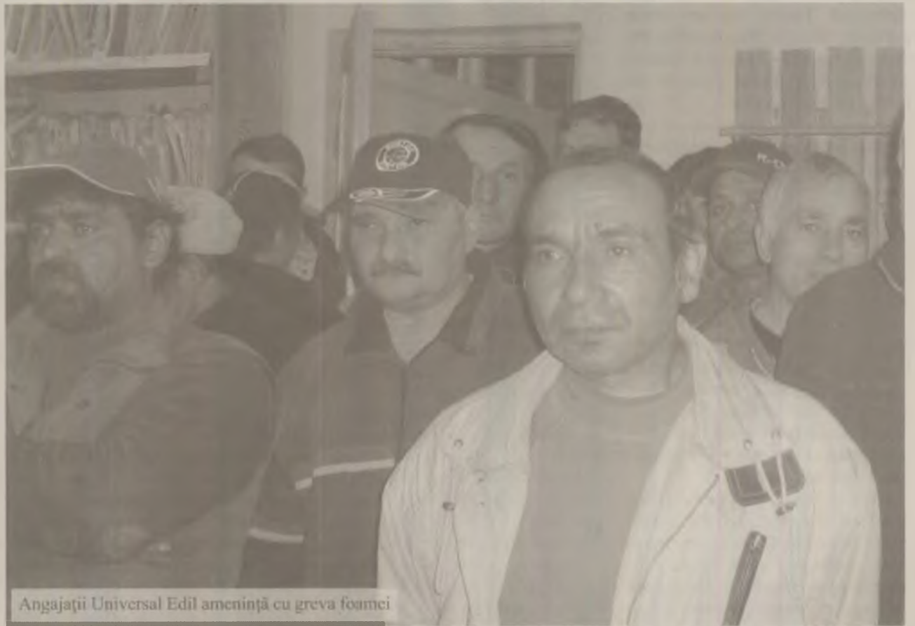
Angajații Universal Edil amenință cu greva foamei

Cu nervii încordați la maximum, un alt angajat al societății își strigă nemulțumirea. „Numai să vină să dea utilajele la Hațegan! Atâta le trebuie! Pe acela îl domnesc iar de noi își bat joc. O să mor cu ei de gât și tot nu-i las să pună mâna pe mașini! Vom face greva foamei,