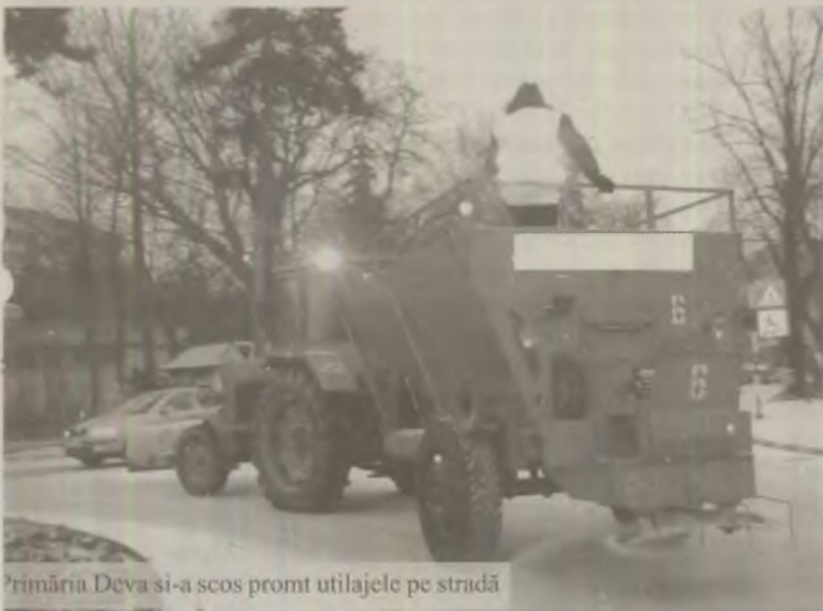
Primăria Deva și-a scos prompt utilajele pe stradă