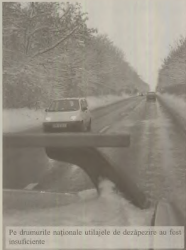
Pe drumurile naționale utilajele de dezăpezire au fost insuficiente

ntu a nu părea că vor fi surprinși de nirea iernii, în ședința din data de .11.2010, șefii CJ au supus spre apro- re „Planul operativ de acțiune pe tim- l iernii 2010 – 2011 pentru drumurile lețene”. Acest plan de acțiune urma fie pus în operă de o serie de firme ivate care au primit contractele de szăpezire pe drumurile județene. imai că modul în care se circula ieri, majoritatea drumurilor județene, vedește faptul că șefii CJ Hunedoara înlocuit managementul defectuos al recției Județene de Drumuri și Poduri nedoara, cu dezinteresul firmelor e casă”. Exemplul cel mai conclu- nt este DJ 687 pe tronsonul Sân- ralm – Hunedoara, unde s-a circulat eară în condiții foarte grele. Traficul ost blocat timp de mai multe ore, mai s pe sensul de mers spre Hunedoara. nivel județean, nu există un coman- ment care să se ocupe cu dezăpezirea umurilor. După unele surse, coordo- torul activităților de dezăpezire este