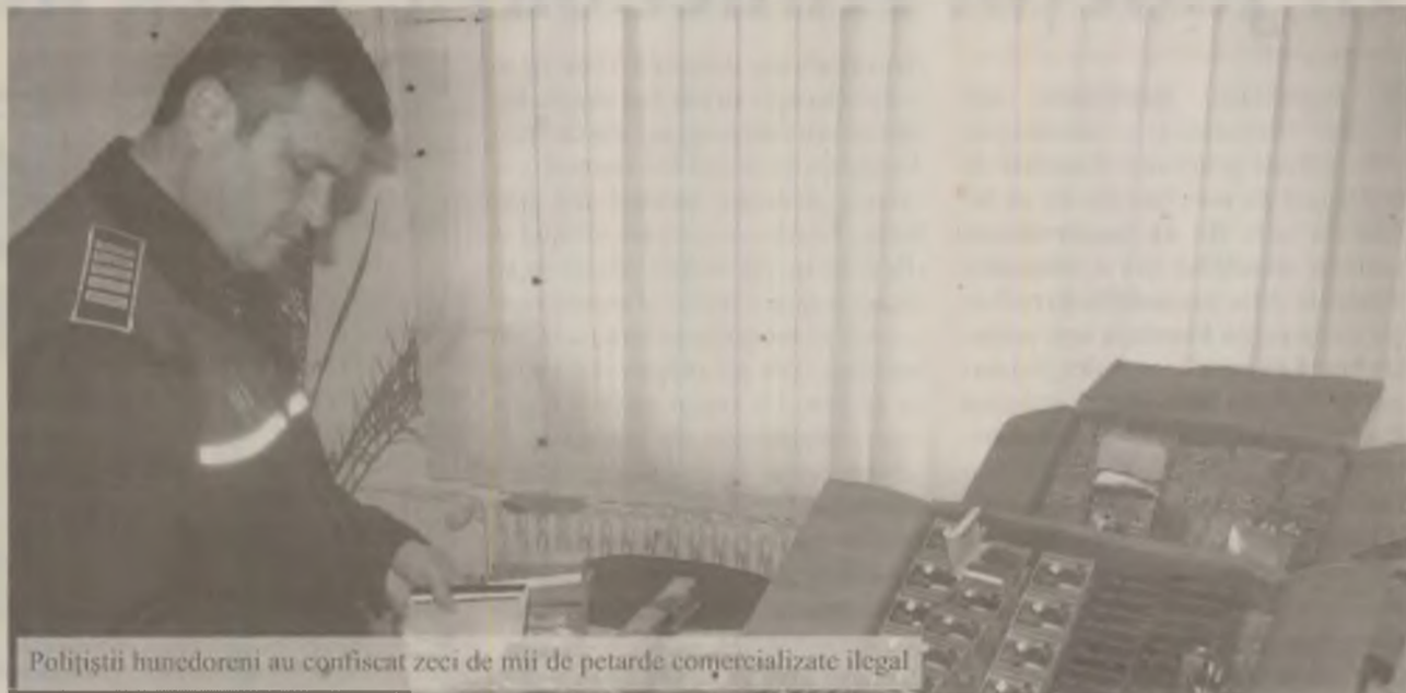
Polițiștii hunedoreni au confiscat zeci de mii de petarde comercializate ilegal

„Polițiștii au ridicat în vederea confiscării peste 34.900 de petarde și minipetarde din clasa I și 38 de bucăți articole pirotehnice din clasa a-II-a, care erau expuse la vânzare și comercializate către persoane fizice. În cauză se efectuează cercetări sub aspectul comiterii infracțiunii de efectuare fără drept de operațiuni cu articole pirotehnice”, a declarat purtătorul de cuvânt al IPJ Hunedoara, inspector