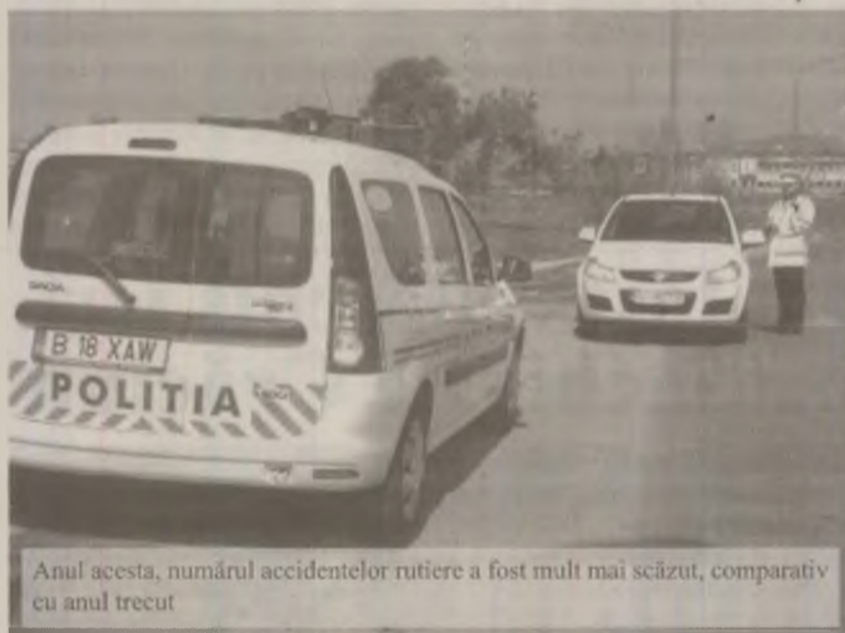
Anul acesta, numărul accidentelor rutiere a fost mult mai scăzut, comparativ cu anul trecut

tiere a fost realmente mai scăzut, comparativ cu anul trecut. Astfel că, anul acesta au fost înregistrate 265 de accidente, cu 63 mai puține față de anul precedent, când au fost înregistrate 328. Numărul persoanelor care au fost grav rănite, anul acesta, a fost și el mai scăzut comparativ cu anul 2009. Astfel, dacă anul trecut au fost 338 de persoane grav rănite, în acest an au fost înregistrate 265 de astfel de cazuri.