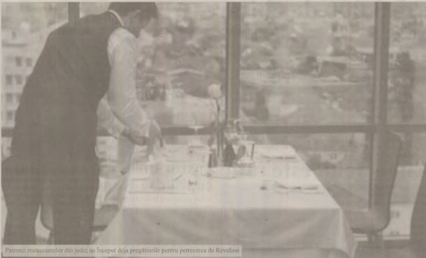
Patronii restaurantelor din județ au început deja pregătirile pentru petrecerea de Revelion