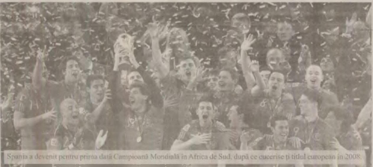
Spania a devenit pentru prima dată Campioană Mondială în Africa de Sud, după ce cucerise și titlul european în 2008.