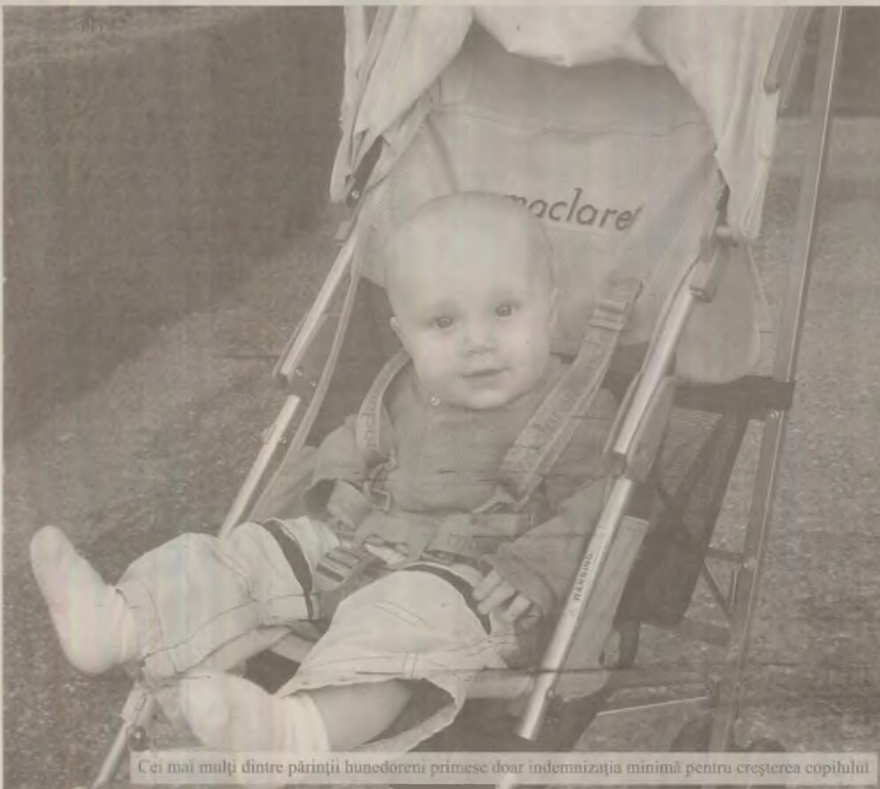
Cei mai mulți dintre părinții hunedoreni primesc doar indemnizația minimă pentru creșterea copilului

42 dintre părinții hunedoreni încasează indemnizația maximă pentru creșterea copilului în cuantum de 3.400 lei, iar 65 la sută dintre aceștia primesc doar suma minimă de 600 de lei.