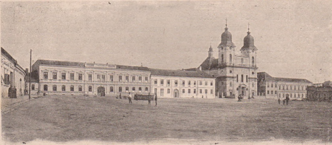
Teologia, catedrala și gimnaziul romin din Blaj.

La anul 1754 s'au deschis două școale, una pentru pregătirea mai înaltă preoțească, din care s'a dezvoltat cu timpul gimnaziul de astăzi, iar