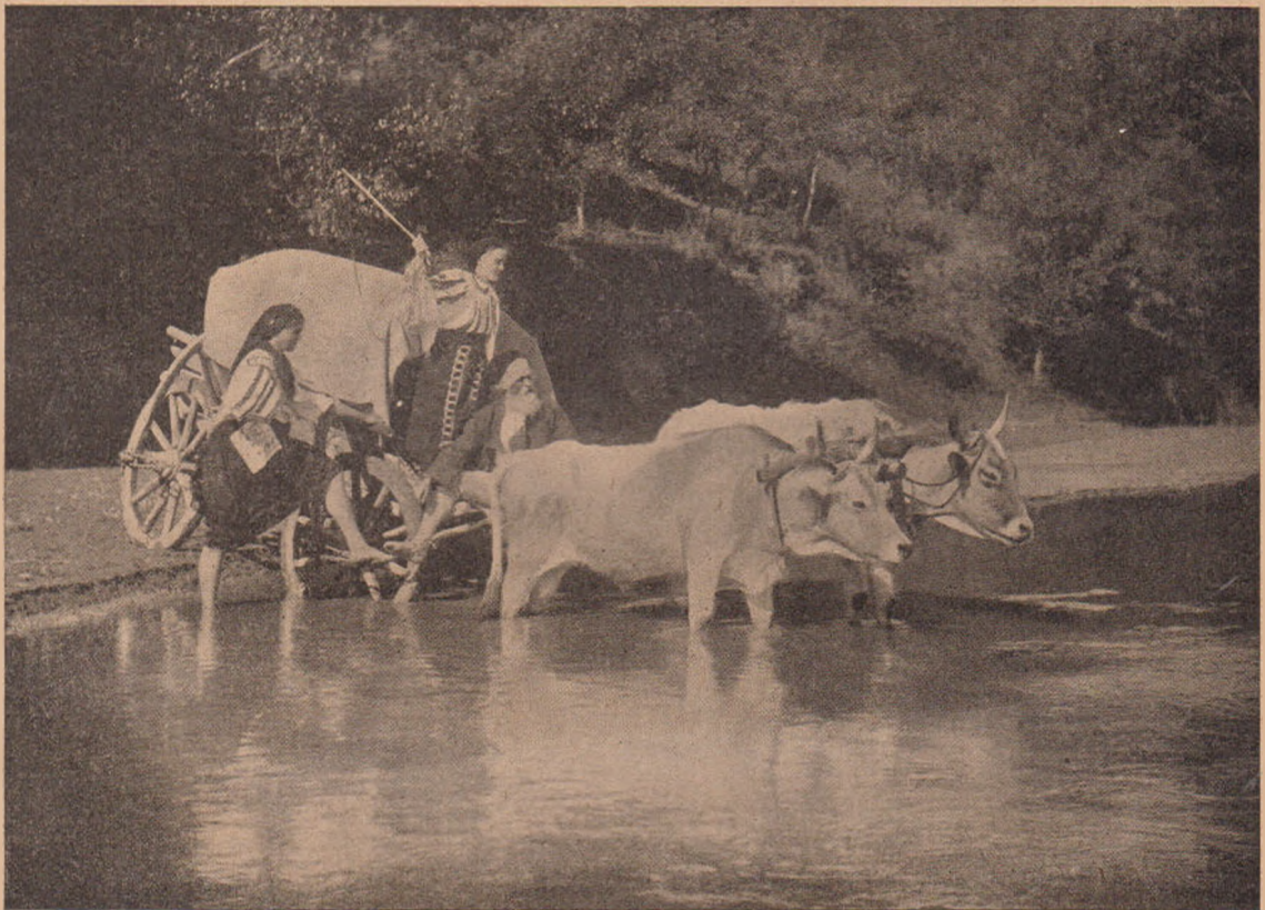
Vederi din România.

Se daseră cele dintâi răspunsuri și profesorii se minunară mult de cuminența orfanei. Colegii și fetele dela curs priviră cu mirare la fata aceasta care a făcut atâta vreme, pe care o credeau de tot mărginită.