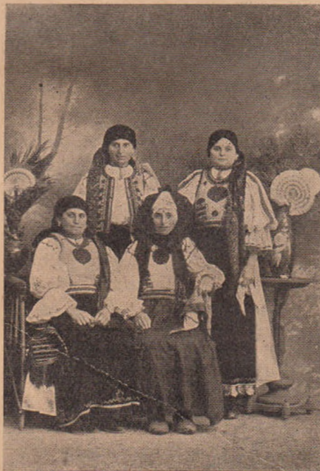
Țărance din Ardeal.

fesorul e legea să râzi, să glumești, să vorbești noutățile din oraș. Mai ales domnișoarele dela curs nu-i dădeau pace. Dacă ar fi vorbit numai din depărtare de ea, luându-i la ochi haina, ori pălăria, Lenuții nu i-ar fi păsat. Știa că nu poate să umble ca celelalte și nu afla o nenorocire într'asta. Altă haină de doliu n'a avut decât aceea ce-a purtat-o și acasă. Celelalte i le-a făcut preo-