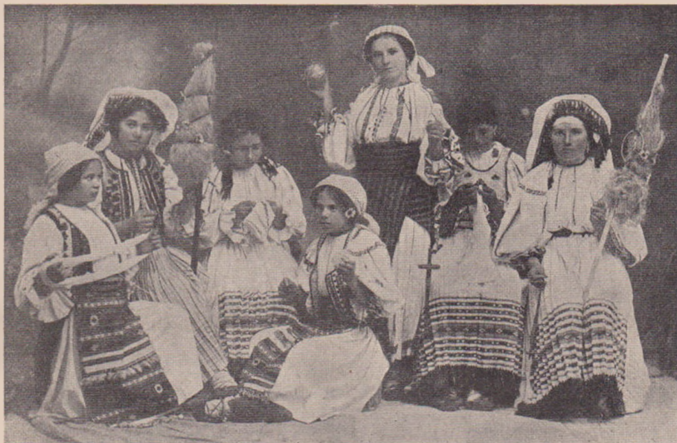
Lucrătoare în „Atelierul de țesături și cusături românești“ din Orăștie.

Ierotei privi atunci cu dușmănie la bătrâna: „Cinci pietri, înțelegi d-ta, cinci pietri sunt ale mele. Asta n'a muncit încă la moară. Eră în fașe când eu mă zoleam toată ziua. Dreptate a avut taica, după dreptate am să lucru.“