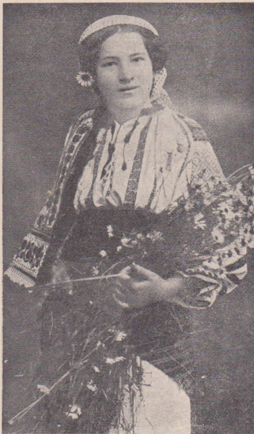
Port din Giurgeu.

Ne arată biserica din sat, ridicată de Ștefan cel Mare. O biserică micuță în care miroasă