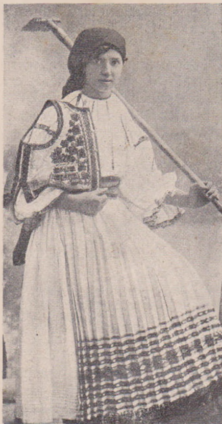
Port din Huneadoara.

La casin suntem primiți cu multă voie bună. Strănepoții plăieșilor lui Ștefan cel Mare