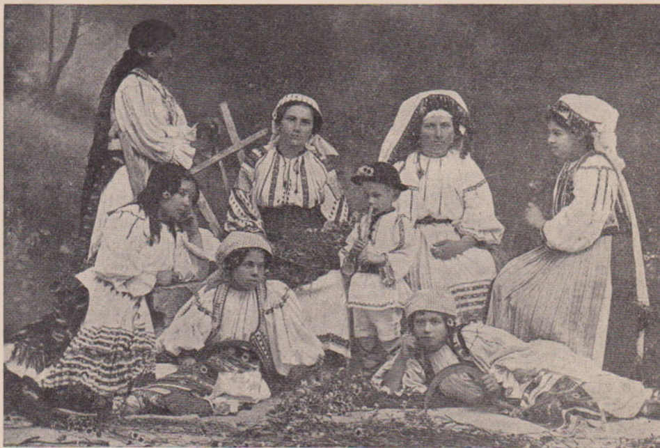
Lucrătoare în „Atelierul de țesături și cusături românești“ din Orăștie.

„Trageți în jos unde se potolesc valurile“,