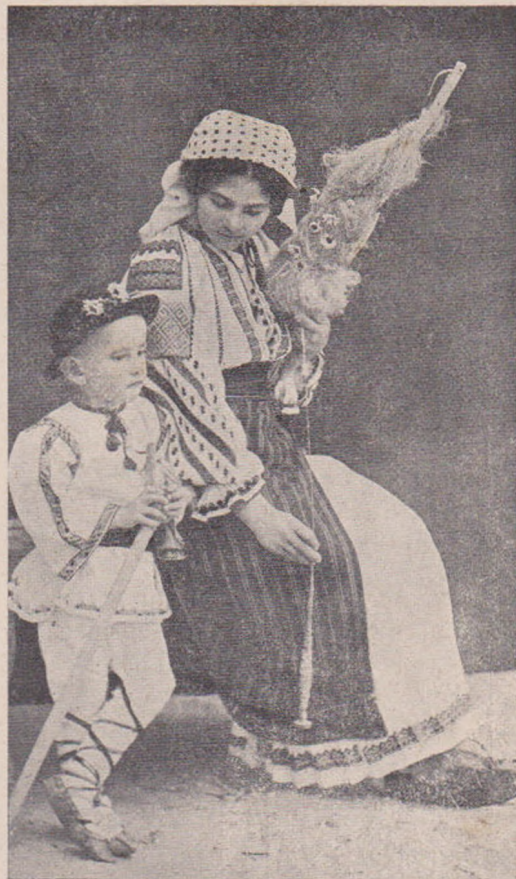
Port din Giurgeu.

Câteva femei, cu desagii pe umeri, trec pe lângă noi, vorbind rusește, iar o Româncă din urmă zice: