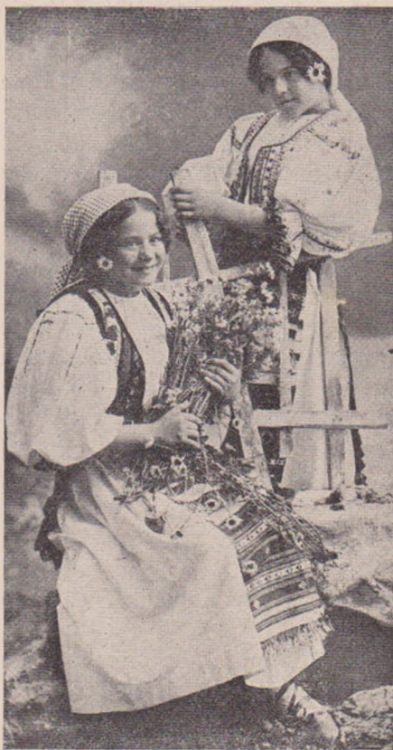
Flori de câmp.

deodată se arată în vale mănăstirea Dragomirna, iar mai la dreapta Mitocul Dragomirnei, un sat tăiat în două de graniță.