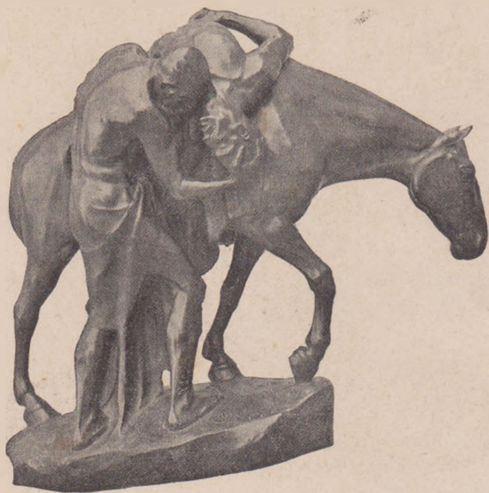
Dederer: Bunul Samaritean.

— „Nu domnule Carol. Lasă. Și dumitale-ți