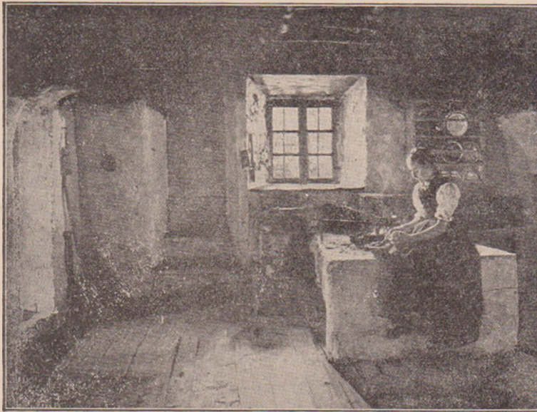
Interior la țară.

Luase în spinare crucea vieții, ca boul jugul în gât și o ducea încet, liniștit, fără șovăire și mulțumit chiar cătră sfârșitul obștesc. Dar a venit o împrejurare, care a adus schimbare mare în mersul acesta obișnuit al lui Dumitru Bröcea, turburându-i mințile, strângându-i inima în cătușe grele de fier. Eră pe timpul când se stricase biserica cea veche din Joseni și se croiseră șanțuri lungi și mari pentru lăcaș nou lui Dumnezeu și mai încăpător pentru mulțimea enoriașilor, cari căutau în