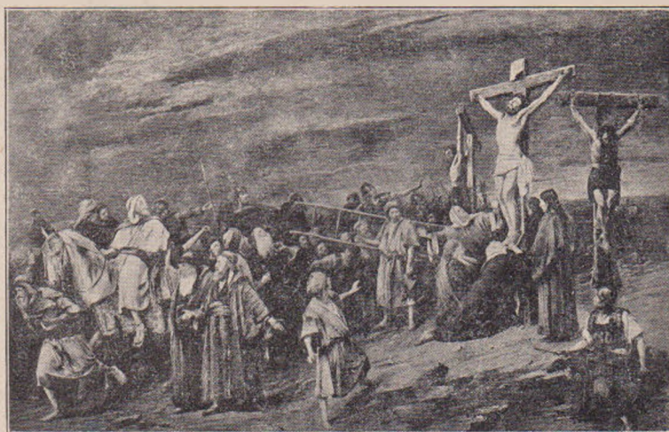
Keoping: Răstignirea. (Gravură după tabloul lui Munkácsy).

De câteori zăria însă, de acolo de pe coastă, biserica din vale, cum se înalță, nouă, fătoasă, aproape gata, în lumina bogată a soa-