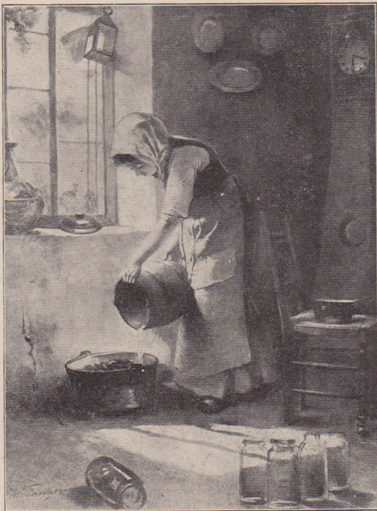
Faugeron: Interior de gospodărie.

l-am întrebat dacă-i așa. Stătû în cumpănă. Mă măsură puțin. Apoi spuse cu gura toată: da. Din bătrân și bolnav odată par'că se făcu un flăcău tânăr și voinic. Se înfoiă ca un bălaur. Și bine-i mai stă astfel. Nu știu ce-mi veni să-l întreb: