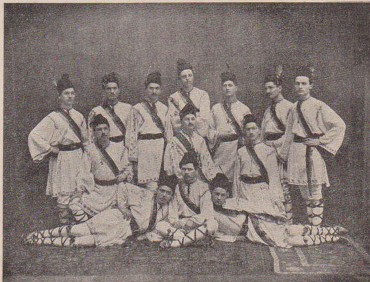
Călușerii la revelionul societății „România Jună“ din Viena.