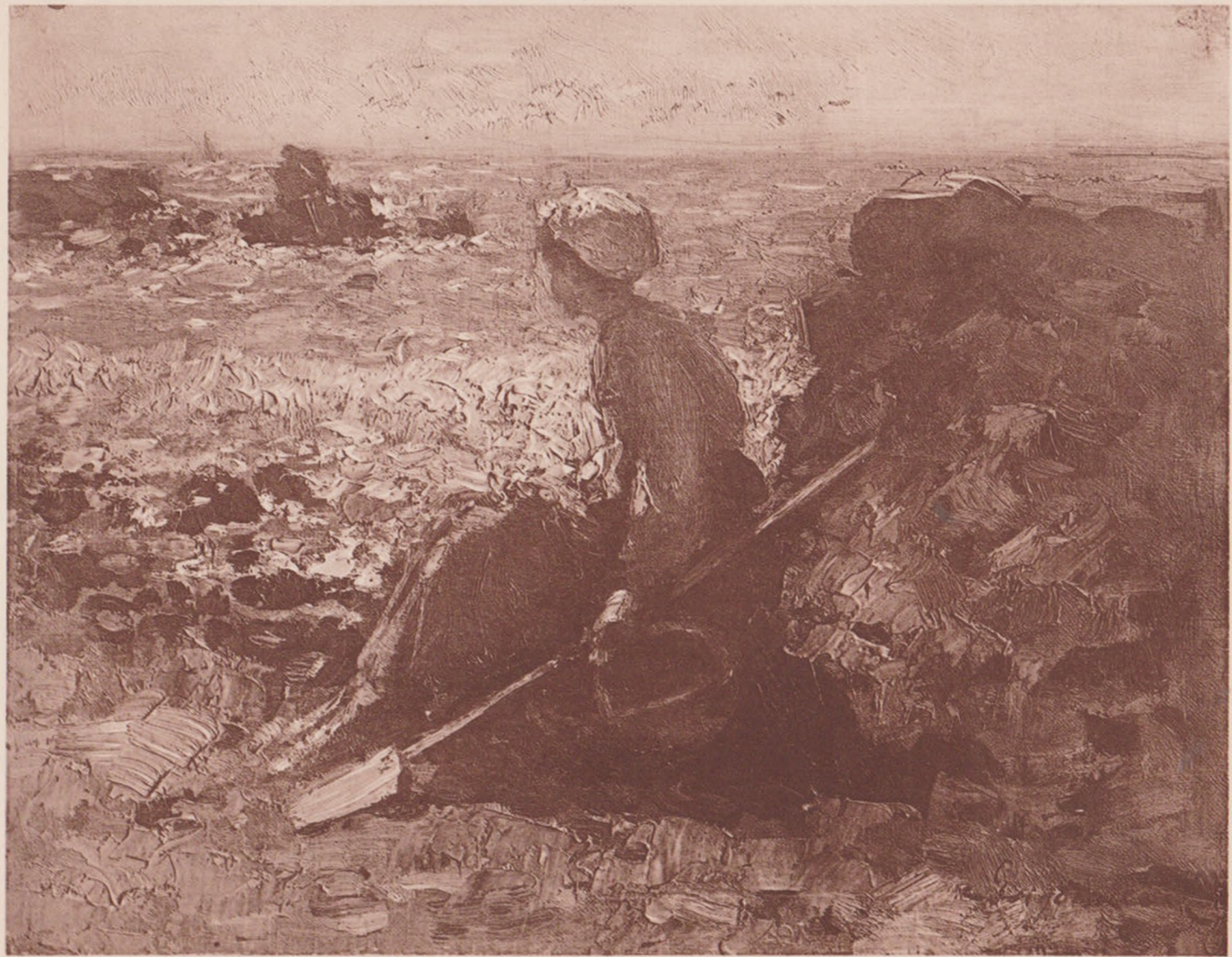
Grigorescu: La Granville.