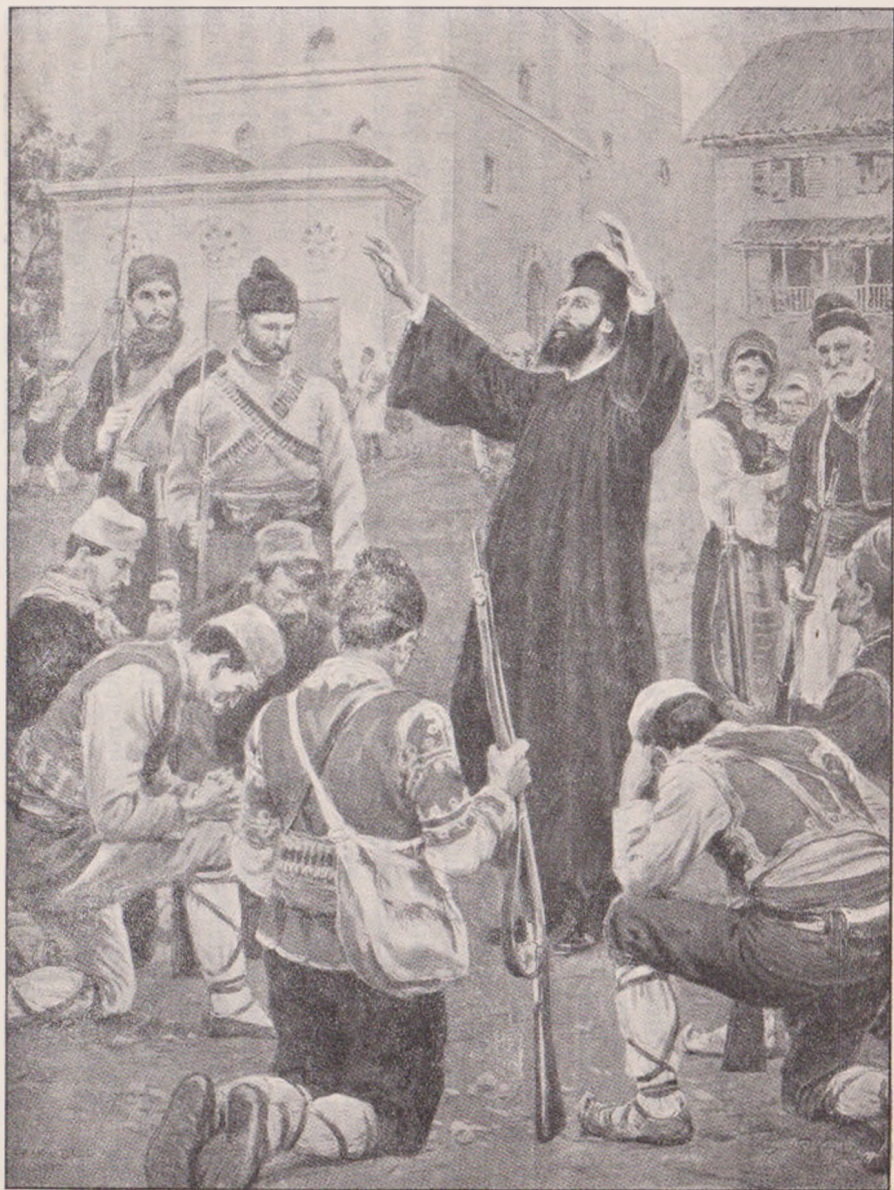
Preotul binecuvântând pe soldații cari pleacă în război.