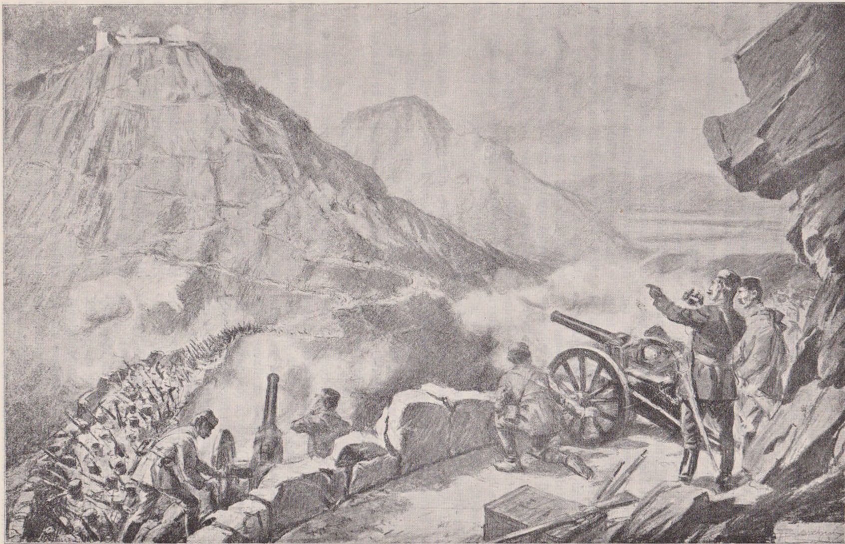
Cea dintâiu luptă în războiul din Balcani: artileria sprijinește atacul infanteriei muntenegrine asupra fortăreței turcești Decici (10 Oct.).