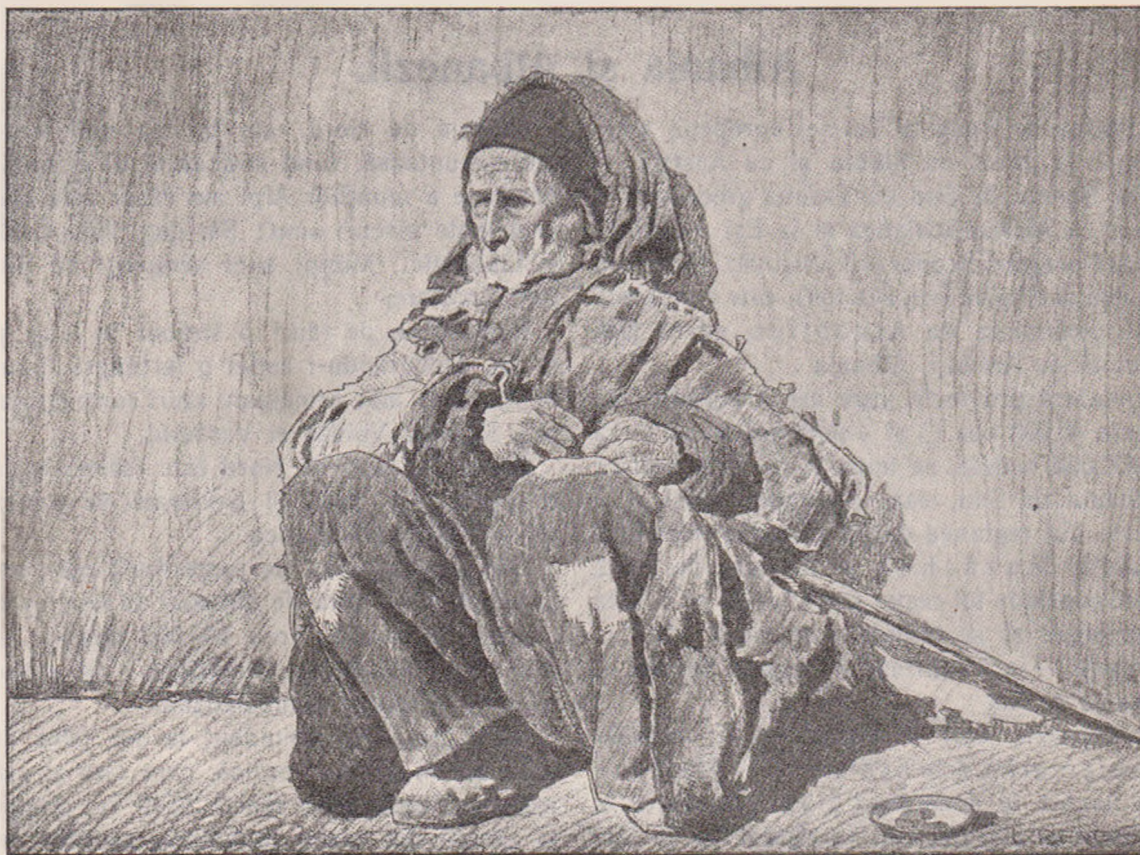
Turcia: Alah e mare. Numai el știe de ce-a lăsat pe pământ atâția câini, cari îmi rup sdrențele împărăției.

Pe baza acestui tacrir s'au putut deschide în urmă numeroase școale, iar învățământul românesc a putut lua un avânt însemnat.