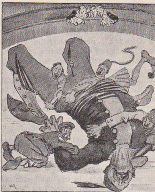
Situație critică în ciroul din Balcani.

În toate timpurile Români din Macedonia,