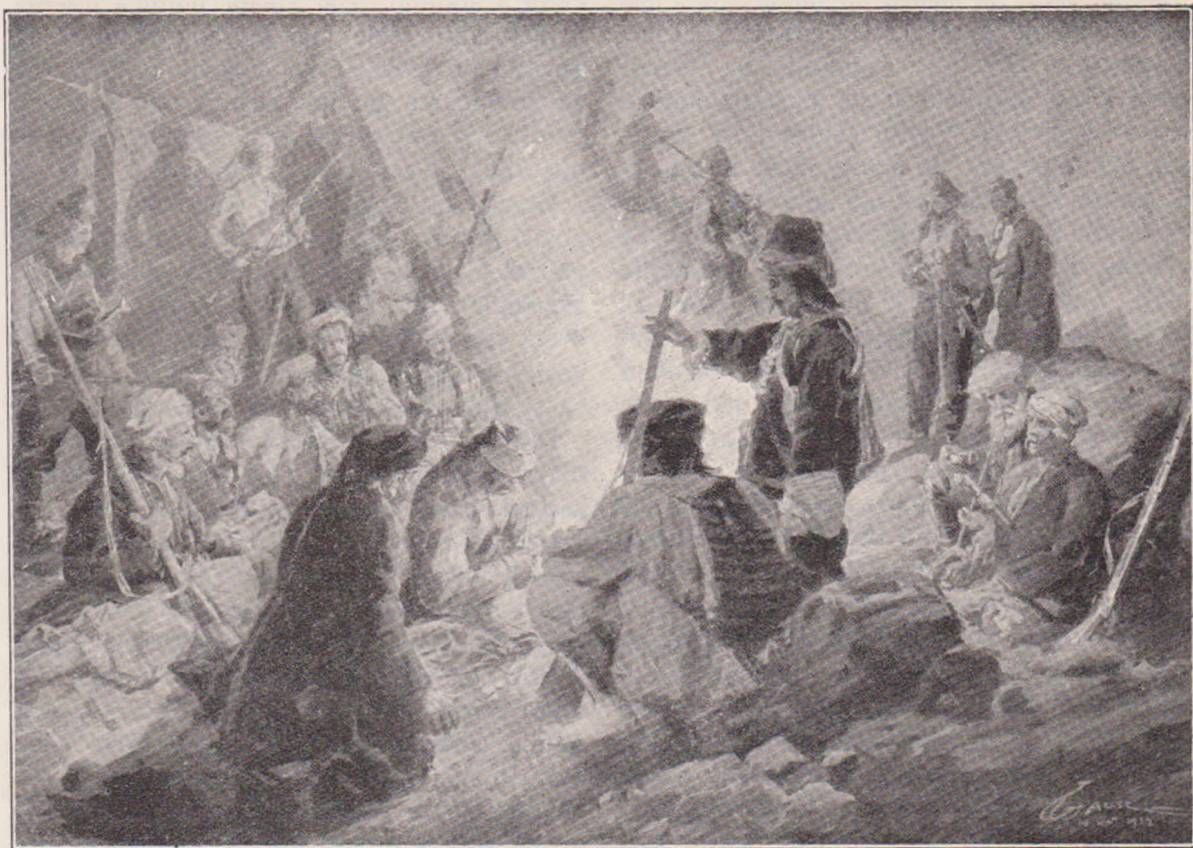
Lagărul unei bande Turcești în Sandjac.

cultura elină găsi un centru pe pământul ortodox românesc, unde Grecii se bucurau de multă trecere și de multă cinste. Sub influința lor Țările românești deveniră centrul ortodoxismului, iar Bucureștii o lumină a Răsăritului. Se înființară tipografiile, școalele, se tipăreau cărțile oamenilor învățați a căror faimă eră cunoscută pretutindeni, iar domniile țărilor româ-