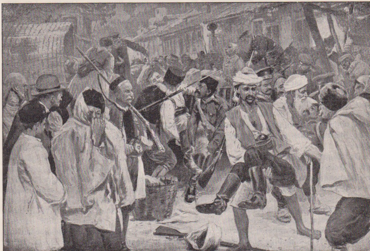
Orașul turcesc Verane după cucerirea Muntenegrinilor în 16 Octomvrie. În față transportul răniților Muntenegrini. În fund prizonieri Turci.

Doar Muntenegrinii de mai respirau liber în cetatea lor de munți nebiruiți. Și totuș „raia“-ua turcească din țările, cari au fost mai înainte ale Sârbilor, nu eră cu totul amortită. A început să-și făurească visuri, să învie amintirea eroilor săi naționali și să-și creieze, în poezia lor poporală, un izvor neseecat de nădejde pentru viitor. Din principii, regii și țarii lor au făcut sfinți, pe cari