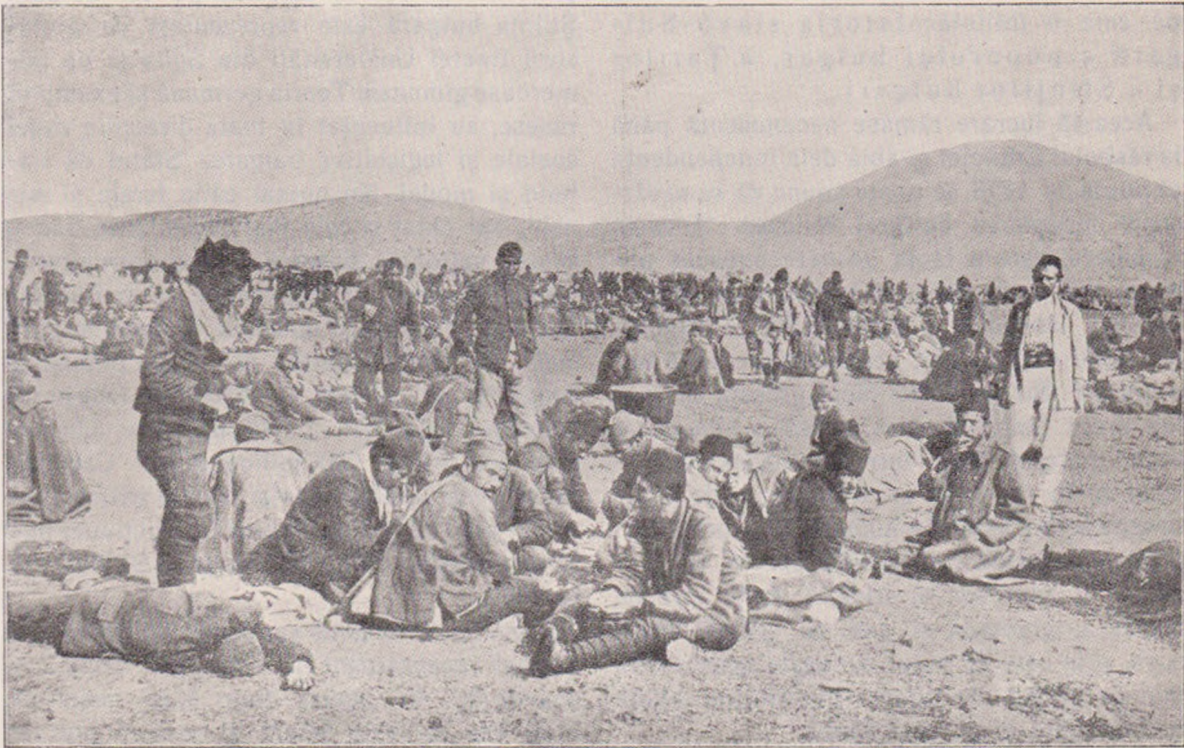
Tabără lângă Podgorița. Turci făcuți prizonieri de Muntenegrini.

Dar, odată cu căderea Bulgarilor sub stăpânirea Turcilor, ei își pierdură nu numai independența de stat ci și cultura de popor civilizator în orientul creștin.