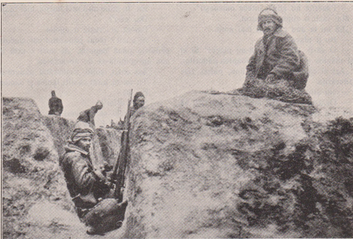
Soldați Turci în întăriturile dela Ciataldgea.

În seara aceea pădurarul veni mai de vreme ca de obicei. Eră mâniaș și izbiă porțile cu sunet mare.