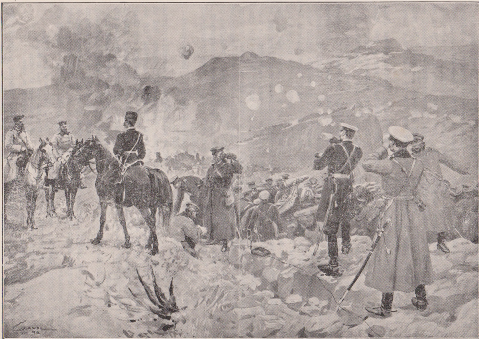
Războiul din Balcani: Lupta dela Ciataldgea. Cucerirea unei poziții turcești de trupele bulgare.