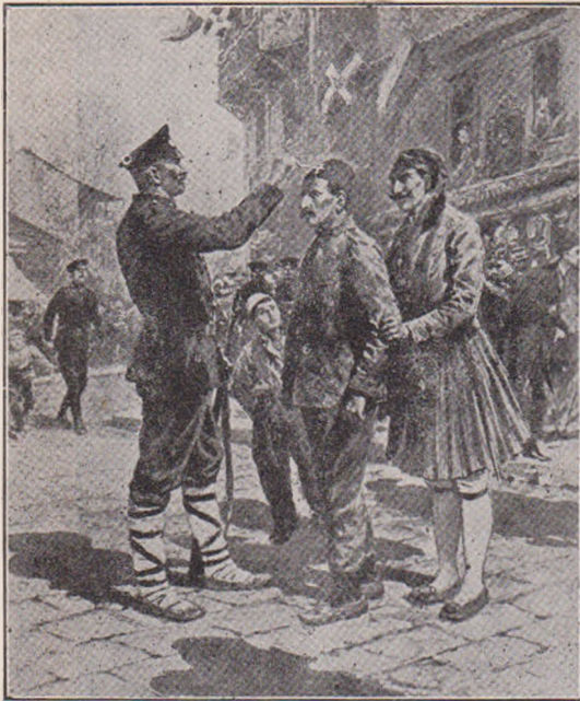
Ocuparea Salonicului: Un soldat bulgar și grec făcând cruce pe fesul unui soldat Turc.

și se întorcea seara. În ogradă oamenii umblau încet după treabă. În livada întinsă intrase o pace adâncă și arborii stăteau în soare ca într'un straiu de spumă de argint. În liniștea, care o împresură, Anișoara stă singură la fereastra deschisă și se gândea, se gândea cu întristare la măicuța moartă. Asta era mai ales în amurg, după luminile și bucuriile zilei, când toate tac.