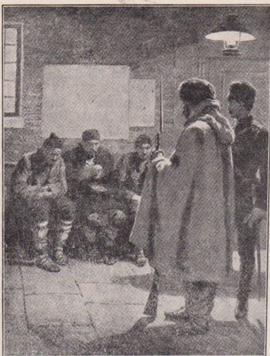
Prizoneri Turci păziți de Bulgari.

tinatul. Dar de-acum simția că-i iartă, că nu le mai dorește nici rău nici bine, că pentru ea nu mai există. Simția, c'o sfâșietoare durere fizică, cum vieța ei se-adună, se concentrează într'o singură dorință. Și aceasta nu eră o micșorare, nu-i strimțta vieța. Dorința aceea, una singură, îi arătă vieța mai plină, mai largă, nemărginită. Și vieța se contopiă acum cu bucuria, cu deliciul, cu fericirea care nu se va mai sfârși niciodată. În alergarea trenului, aici pe catifeaua verde, ar fi dorit să stringă în brațele sale lumea întreagă, să-i ierte pe toți, să-i iubească. O milă nesfârșită îi umplu sufletul.