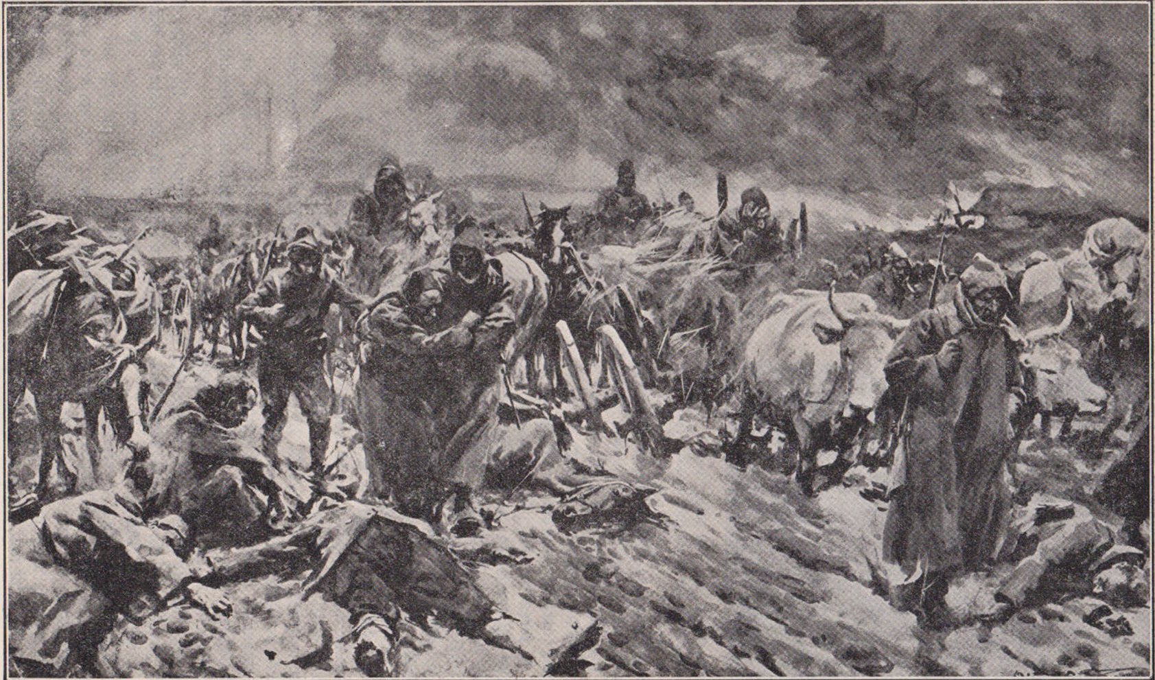
Războiul din Balcani: Retragerea Turcilor după lupta dela Lule-Burgas.