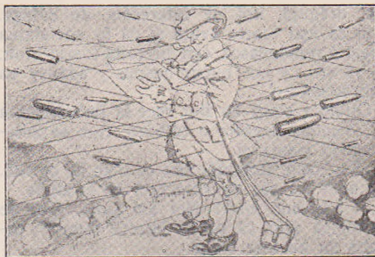
Correspondentul de războiu englez (caricatura).

Ele se confundară în amintirile anilor de școală. Iși aduceau aminte de profesoare, de bone, de colege. Din când în când vr'una se miră: cealaltă spunea de o colegă care a murit. Ele își avuseră paturile vecine în