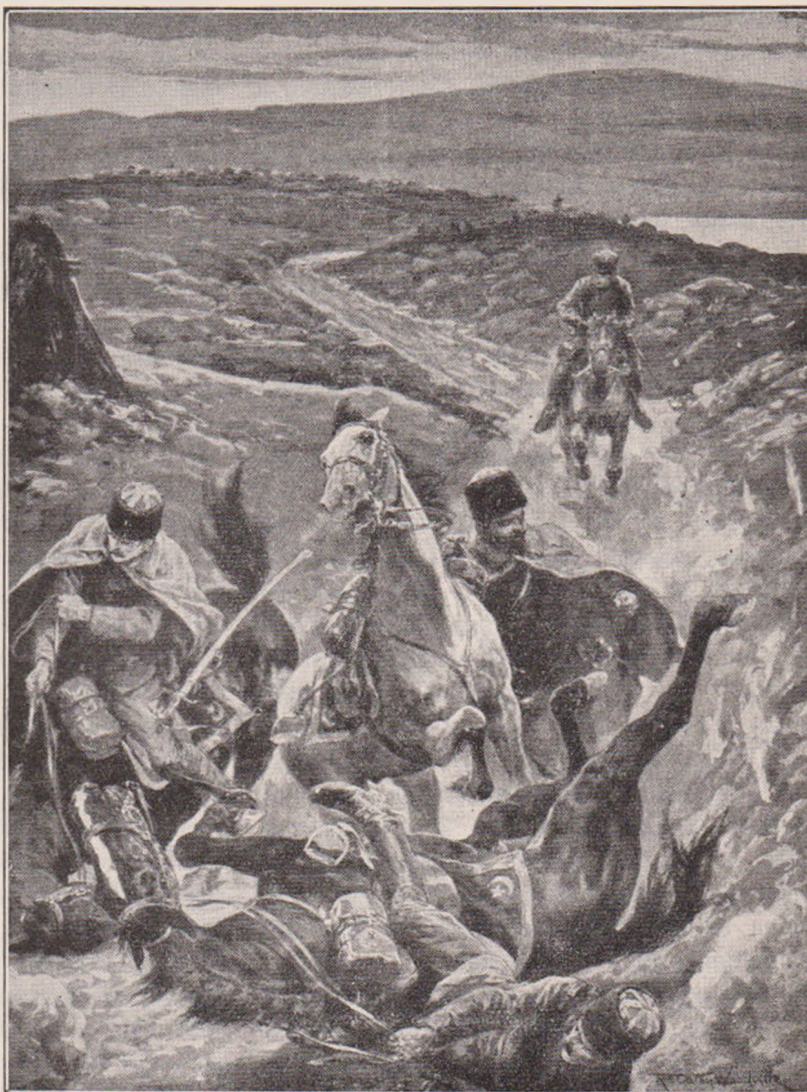
Răsboiul din Balcani: Muctar Pașa rănit într'o recunoaștere a forturilor dela Ciataldgea.

sgomot enorm. PISOIUL S'A TREZIT ȘI EL DE UNDEVA DE SUB VATRĂ, ATAȘÂNDU-SE CU TOATĂ NERVOSITATEA RASEI LA CONCERT. SĂREĂ NEBUN PE PĂREȚI, MIORLÂIND ÎN MEZZO-SOPRAN. CÂNI HĂULEAU ȘI EI PE APROAPE ȘI PRIN DEPĂRTĂRI, ÎN ÎNTREG SATUL.