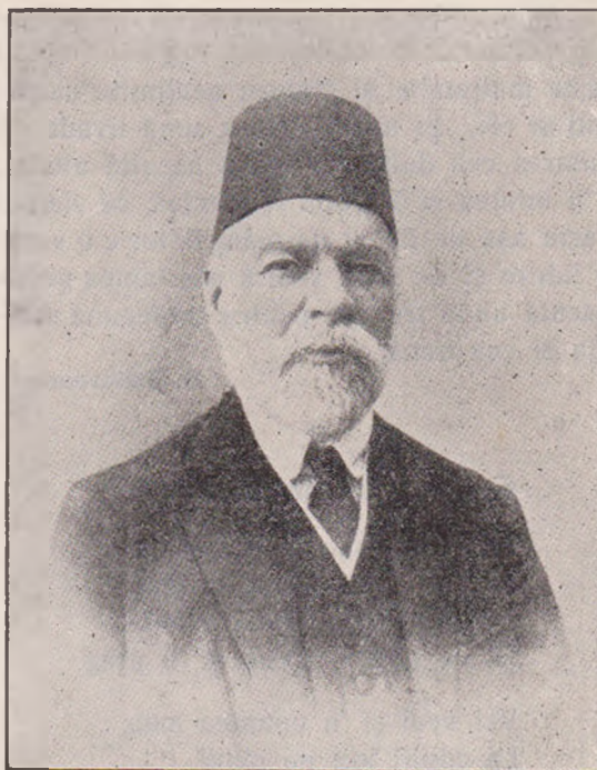
Șeful Albanezilor Beiul Ismail Kemal, sub conducerea căruia s'a proclamat în 23 Noemvrie independența Albaniei.

Sfatul ușurel al berzelor tăcu. Cocostârcul își întinse aripile și se desprinsese lin de lângă cuib; plutii ca o umbră prin amurgul fumuriu și fetița ridică ochii spre el. Lipsi o vreme, apoi se întoarse, pe când seara umplea livada de taină, se roti deasupra șurei și se lăsă la cuib lângă baba lui. Amândouă pa-