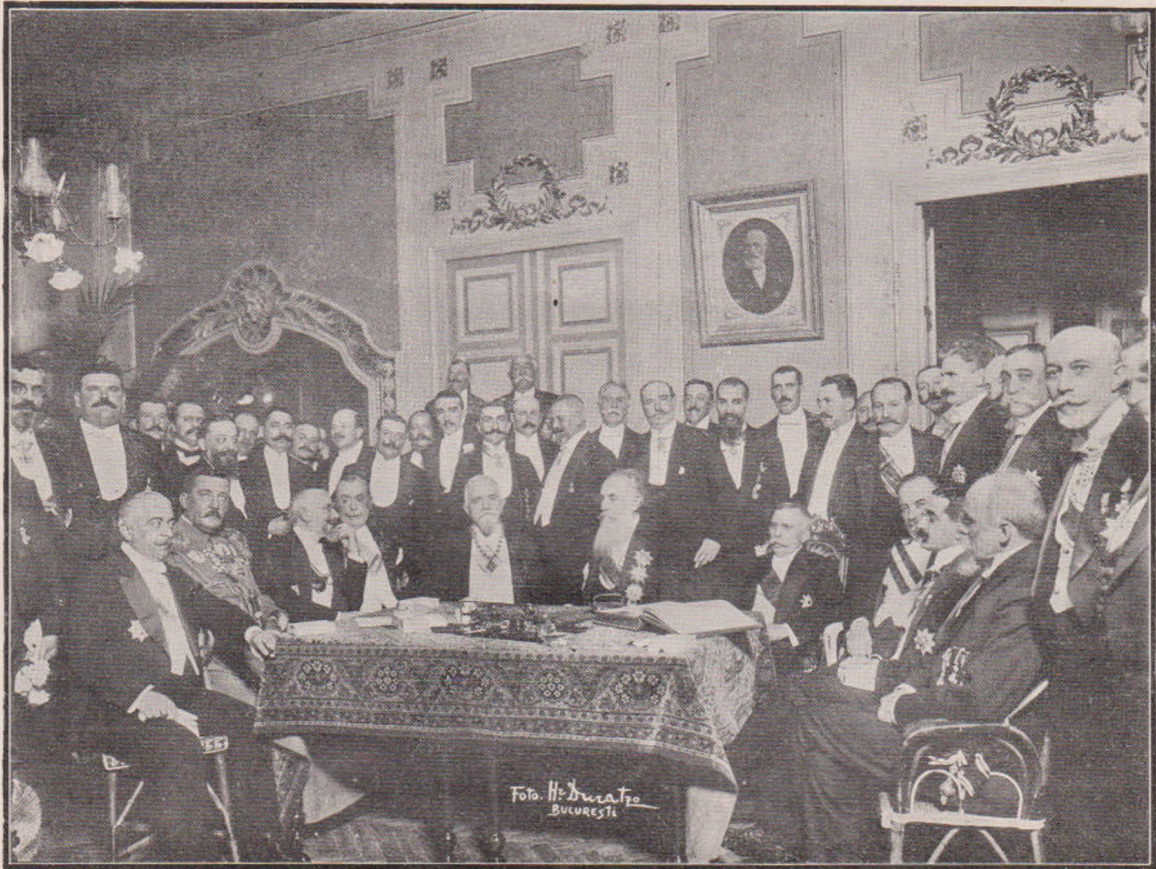
Banchetul oferit de Sindicatul presei în onoarea delegaților la Conferința Păcii din București.

„Domnule, să nu iei în nume de rău manifestația noastră. Aceștia-s Turcii, aceștia suntem noi; simpli până și în năcazurile noastre. Ce vrei? Doar facem ce știm. Da,