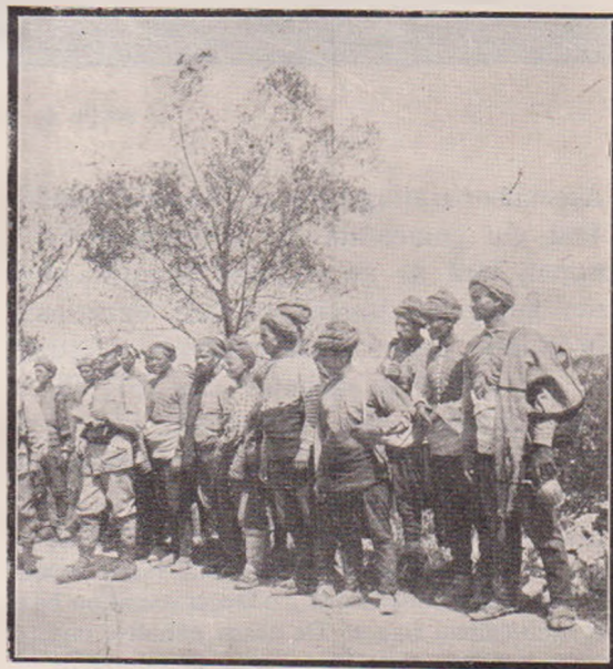
Tipuri din România nouă.

România anunțase guvernul bulgar că, în cazul unu războiu între aliași, armata română va primi ordin de mobilizare ca să apere interesele țării. În îngâmfarea lor nesocotită, Bulgarii au disprețuit sfaturile prietenești ale Regatului român și au început războiul împotriva aliașilor lor de mai nainte, Sârbii și Grecii România și-a tras consecvențele și armata mobilizată cu o iușeală care a uimit Europa întregă a primit ordin să treacă în Bulgaria. Unul dintre generalii bulgari, Dandarevsky, a spus atunci o vorbă care va