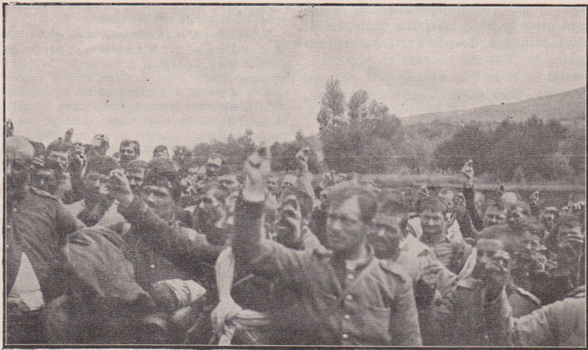
Prizonieri Bulgari jurând de a nu mai luptă — înainte de a fi liberați de Români.

teme și ramuri de migdale și flutură steaguri bulgărești. Dar sărbătoarea aceasta nu durează mult, căci firea barbară și apucăturile hoșești ale Bulgarilor se desfășoară îndată. Pornesc orbește năvălind pe la casele turcești și devastează tot ce întâlnesc. Un număr însemnat de musulmani, cari îndrăzniseră să rămâie ascunși în oraș, au fost omorâți și aruncați în drum, iar cadănele după ce erau batjocorite, fără nici o rușine, le făceau