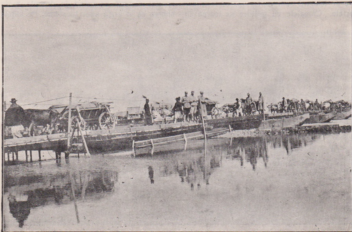
Podul de pontoane peste Dunăre la Turnu-Măgurele.

peste dealuri. Pe câmpul de luptă răniții gem desnădăjduiți. Unii lovesc cu pumnul în pământul surd, își rup hainele și blastămă pe Mohamed care le poruncește în Coran: „Cu sânge cuceriți pământurile, cu sânge dați-le“. Alții, aiurând în plânsul din urmă, scurmă cu unghiile în rană, cercând să scoată fierul morții.