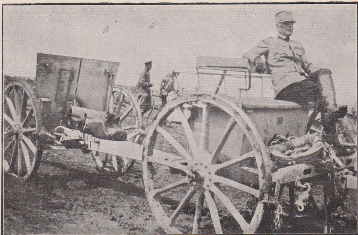
Generalul Bogdan pe unul din tunurile capturate de Români la Ferdinandovo.

În valea Telchiovei, cavalerii Kiurzi manevrează pe caii lor arăbești și scapără în vânt pistoalele. Razele soarelui, răsfrânte în luciul calpacurilor lor verzi, le dau înfățișarea unor pasări uriașe, flămânde, care așteaptă nerăb-