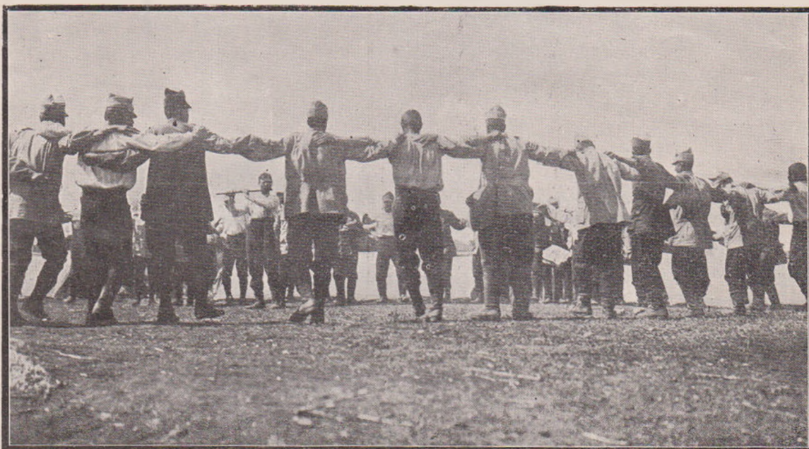
Horă pe câmpul de războiu.

ascuțite de cadâne. Sub balcoane, bătrâne sprijinite pe toiag, bătrâni neputincioși, copii, copile se opresc o clipă cercetând cu ochii împrejur și pornesc la vale cu pleoape ude. Sub streșina unei case în ruină, un arnăut uriaș, cu ochii sălbatici, robust și vânjos ca un stejar, ajută pe o cadână mititică, frumoasă, cu degetele acoperite cu pietri scumpe, să se urce în căruță. Înaintea lor, un derviş speriat aleargă scuipând în dreapta și în stânga ca 'n vraja unor blesteme. Pe ulițele