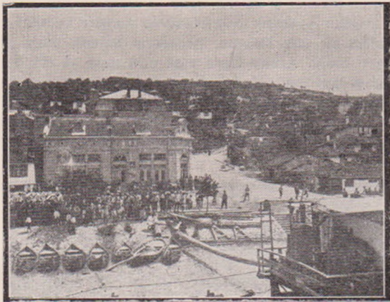
Debarcader la Turtucaia.

întinse, roșiorii noștri au înaintat până lângă trupele bulgare, le-au cuprins într'un careu, apoi au început să le dezarmeze. În primul rând au fost demontate tunurile, după aceea au fost adunate armele de mână și cartușele.