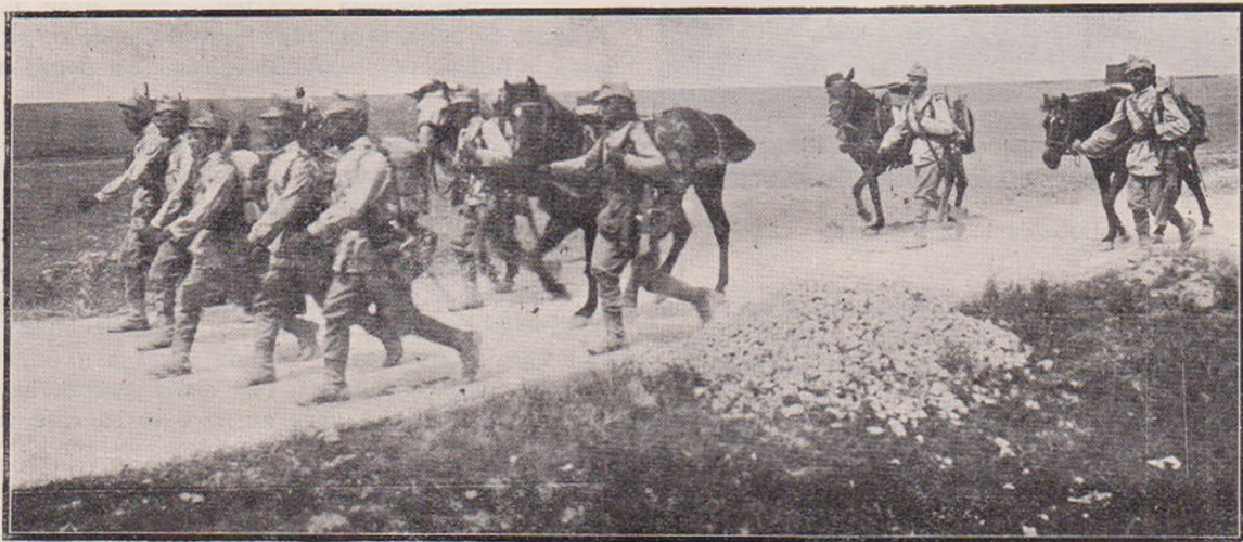
O secție de mitraliere în marș.

Aceste informațiuni, cari veneau din mai multe părți, concordau perfect. Ele m'au determinat să ordon înaintarea diviziei și să mă decid la capturarea ei. Până la această hotărîre avantposturile noastre venind în contact cu cele bulgare, avusesem soldați morți și ofițeri răniți. Aceste fapte erau de natură să mă decidă și mai mult să tai retragerea brigădei bulgare întâlnite și s'o capturez. Retragera ei eră inlesnită de calea ferată din apropiere. Prima mea grije a fost să stric aceea cale ferată. Am ordonat deci să fie