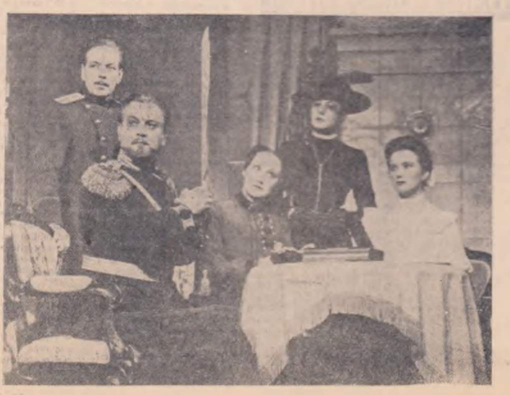
Moment din piesa lui A. P. Cehov „Trei surori”, pasă în scenă la Teatrul Academic din Moscova

„Vaporul din flota voluntară „Vladivostok”.