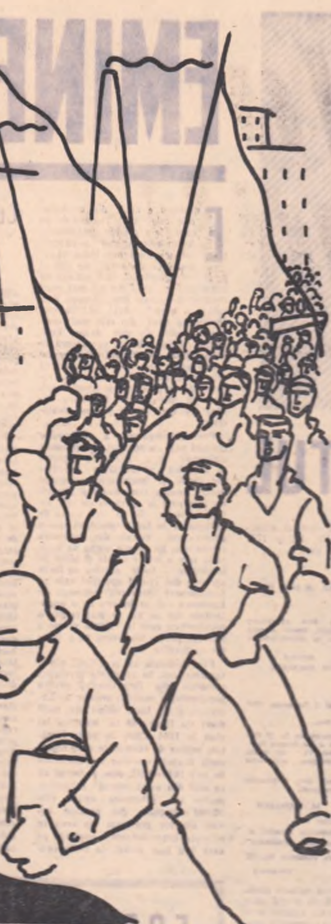
Desene de IULIAN OLARIU

În afară de această mică gospodărie care cuprin- dea tot ce era trebuitor tinerej perechi, de la pat pînă