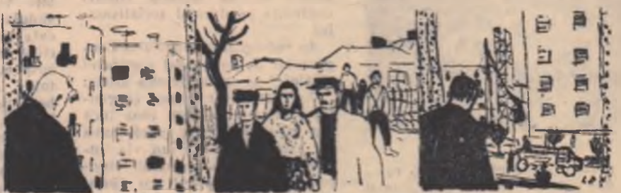
Desen de Liana Petruțiu

„Și în noaptea aceea pistolul său scuipează multe golanțe. Pistolul său și armele celorlalți. Și în noaptea