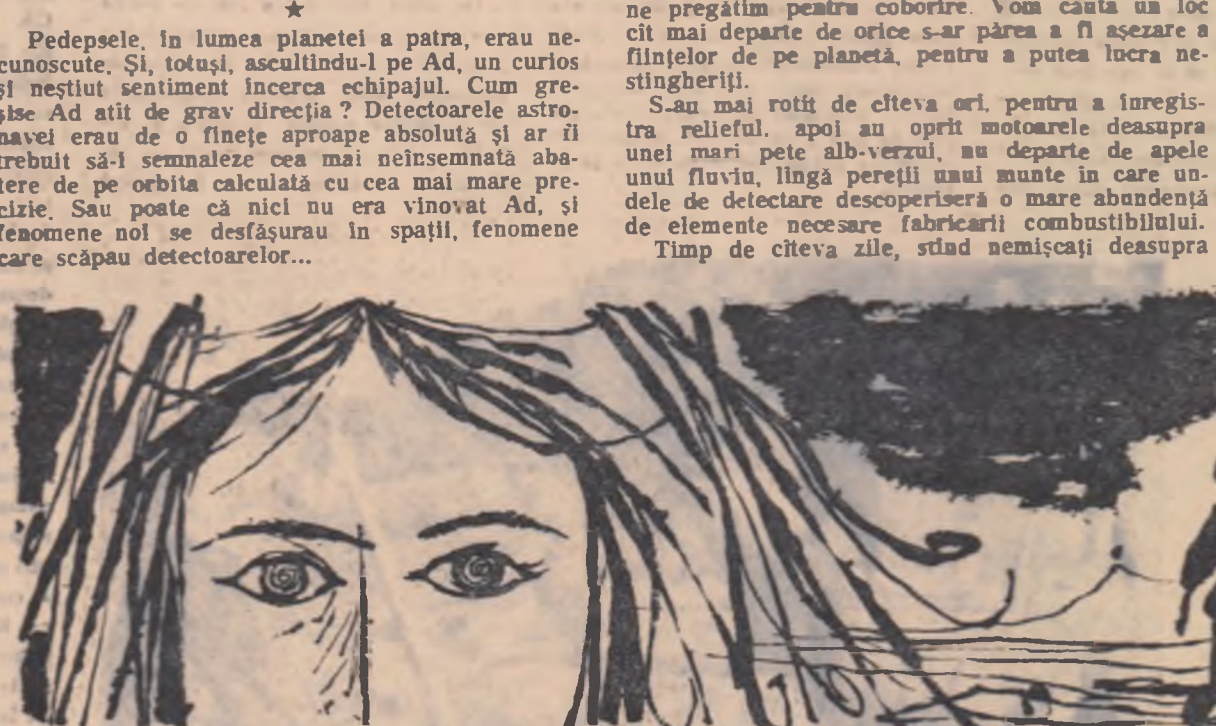
Desene de VAL MUNTEANU

Timp de cîteva zile, stătină nemicașii deasupra