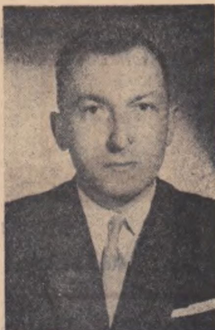
rei față de izvoare istorice precum Letopisețul lui Ion Neculce și Cronica lui Grigore Ureche și altele, identificate pentru prima dată de Boris Cazacu, ilustrind documentat procesul de maturizare artistică a scriitorului, evoluția lui ideologică și stilistică: „In Nicoră Potcoavă, Mihael Sadoveanu — se constată în conștințele studiului — a renunțat la lirismul tinereții, a înlăturat digresiunea romantică și a eliminat retoricul; urmărind realizarea unei unități lingvistice și stilistice a operei, autorul — care stăpânește perfect resursele de exprimare ale limbii din trecut și din prezent — a procedat la o selectare atentă a mijloacelor de expresie — și în special a materialului lexical — în funcție de specificul temei tratate...” (pag. 131).

Studii privitor la „Citeva aspecte ale stilului din romanul Desulcu ” de Zaharia Stancu, reprezintă o remarcabilă contribuție originală la analiza unuia dintre cele mai de seamă romane ale literaturii noastre actuale. Vibrația lirică, atit de proprie prozelui lui Zaharia Stancu, redarea acută a dramatismului vieții (ără-nești, psihologia autentică a personajelor, valoarea estetică a stilului indirect liber, sint cerceate cu pertință în expresia lor stilistică.