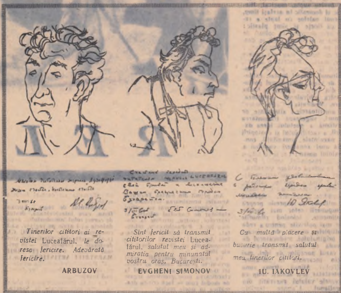
Tinerilor cititori ai revistei Luceafărul, le doresc fericire. Adevărată fericire.

„Sînt fericită, dragii mei prieteni, că mă aflu în România. Imi pare foarte rău că ședereea este atît de scurtă, dar în inimă păstrez cele mai calde amintiri despre zilele acestea. Dați-mi voie ca prin revista Luceafărul să transmit cele mai sincere sentimente de afecțiune pentru prietenii mei romîni!”