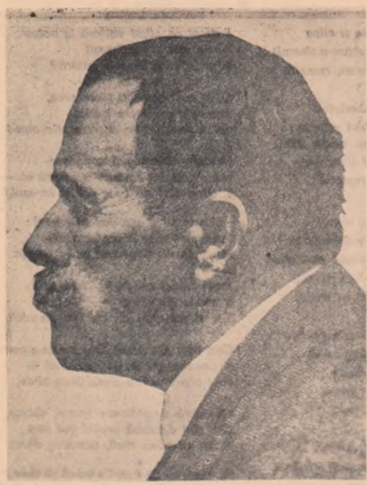
scriitorul acela sensibil ca o mîmă, care s-a înfiorat la cea mai mică nenorocire a țării acestuia. Și-n gestul laș se ascunde toată iubirea lor „sin. ceră, înșelăpă și neștirbită” pentru toți oamenii mari ai noștri. Scriitorii romini, bătrîni și tineri, s-o țînă minte aceasta!

Căci ei au găsit că e uman, e nobil, e frumos să se răzbuie astfel pe cel ce „săvîrșise păcatul” de a fi fost prietenul evreului Ronetti Roman și membrul unui partid pe care d-lor nu-l agreată. Căci ei au găsit că e nobil să cinstească așa pe