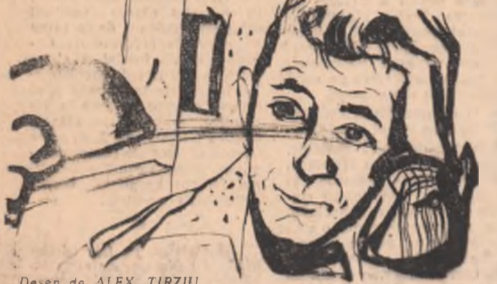
Desen de ALEX. TIRZIU