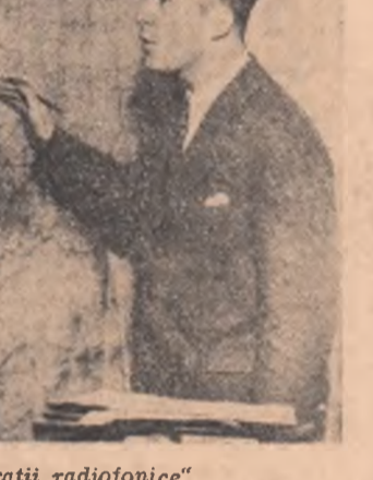
La harta „marilor operații radiofonice“

Intregul aparat este divizat în opt direcții, care, la rândul lor, se împart în birouri teritoriale, corespunzând țărilor europene din lagărul socialist.