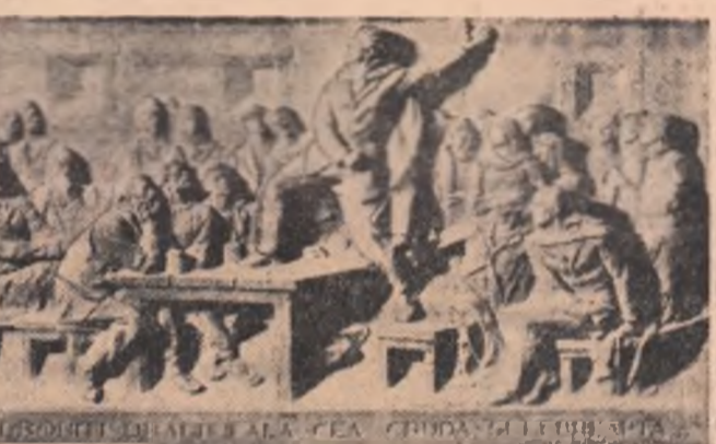
L. JALEA „Împărat și proletar”

Un capitol mai mare este rezervat importantului Muzeu de Artă al R.P.R. Trafînd separat Galeria națională, Galeria uni-