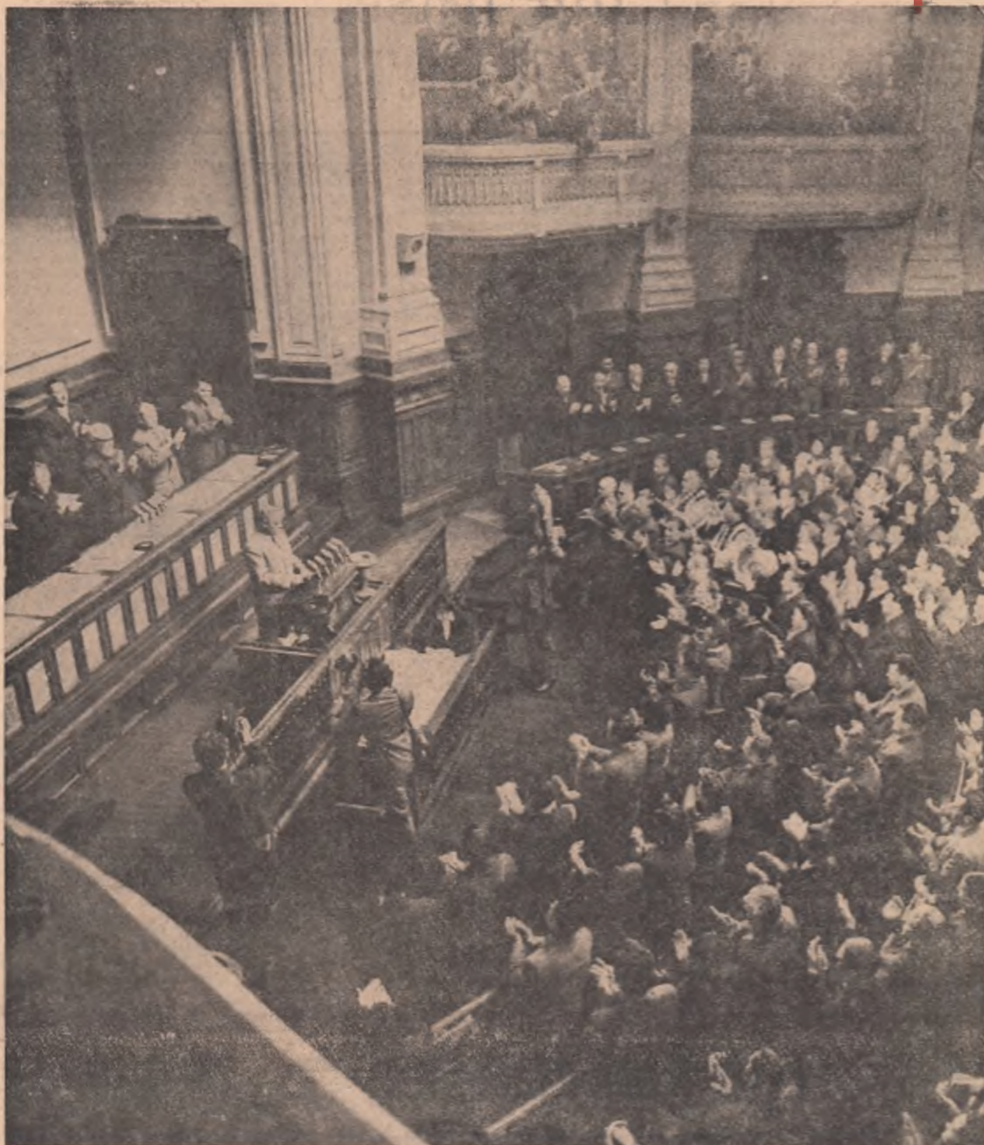
Tovarășul Gheorghe Gheorghiu-Dej vorbind la recenta sesiune a Marii Adunări Naționale.