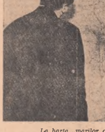
La harta „marilor operații radiofonice“