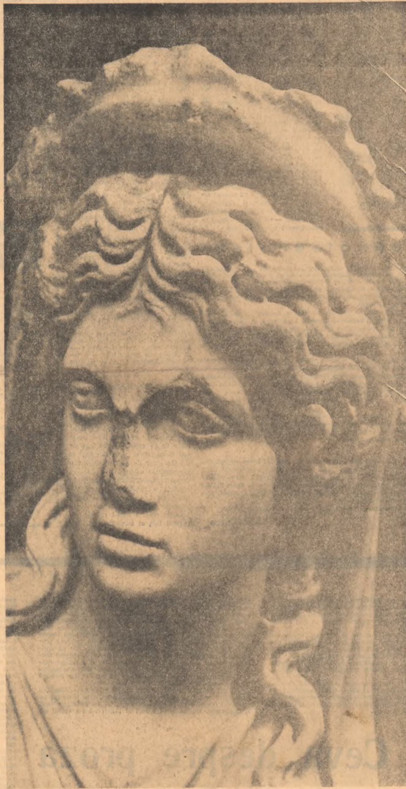
ZEIȚA FORTUNA — Detaliu