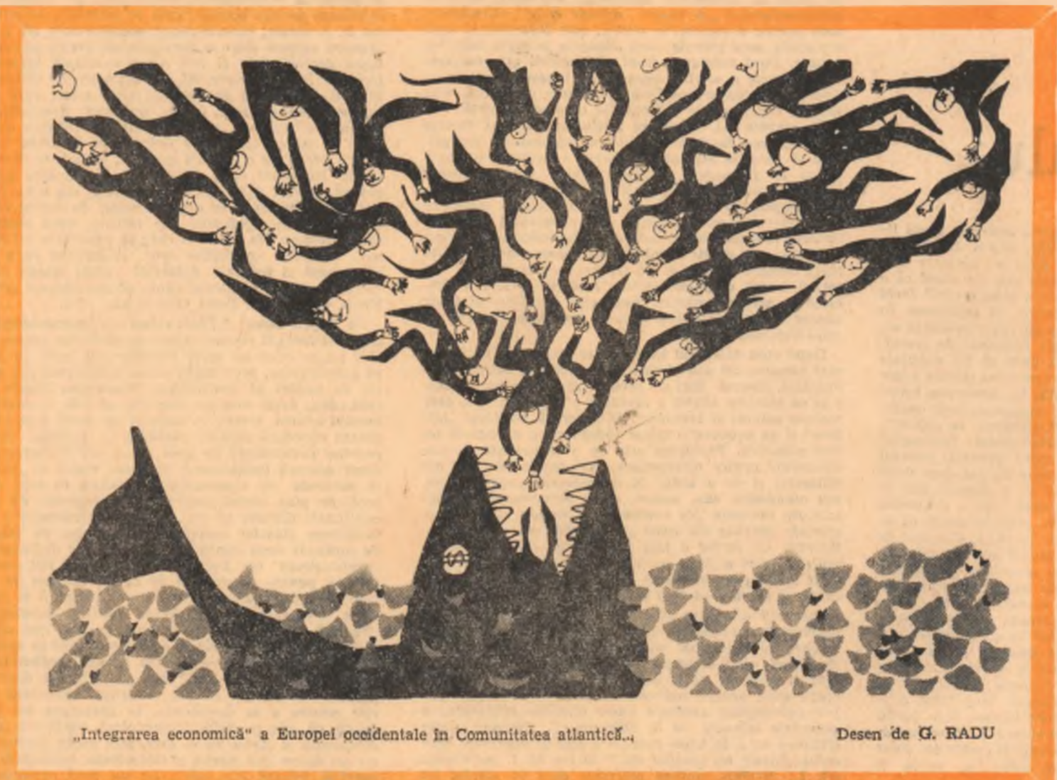
„Integrarea economică” a Europei occidentale în Comunitatea atlantică.

Critica mexicană se oprește asupra romanelor lui Sadoveanu, insistînd îndeosebi asupra „Zădărnicele cerului” și „Bălăgăniș” și „Mitrea Cocor”.