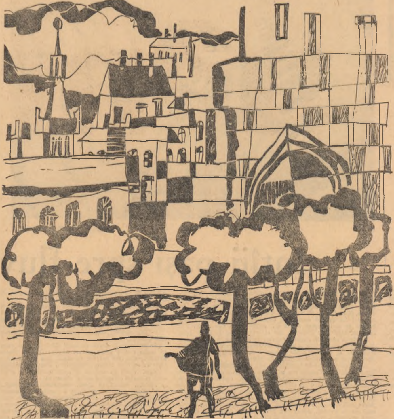
Desen de N. ZAMFIR

PANN: Între acești pereți mai pocnesc cîteodată podelele — și se mai aud... pașii lor... Dar n-am de ce să mă prind în ocolul meu... Cu gîndul mă port tot spre alt țîrîm... Pentru cele din preajmă am un ochi care vede totul și miini care