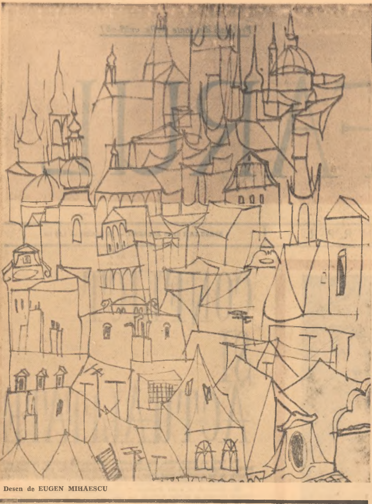
Desen de EUGEN MIHAESCU