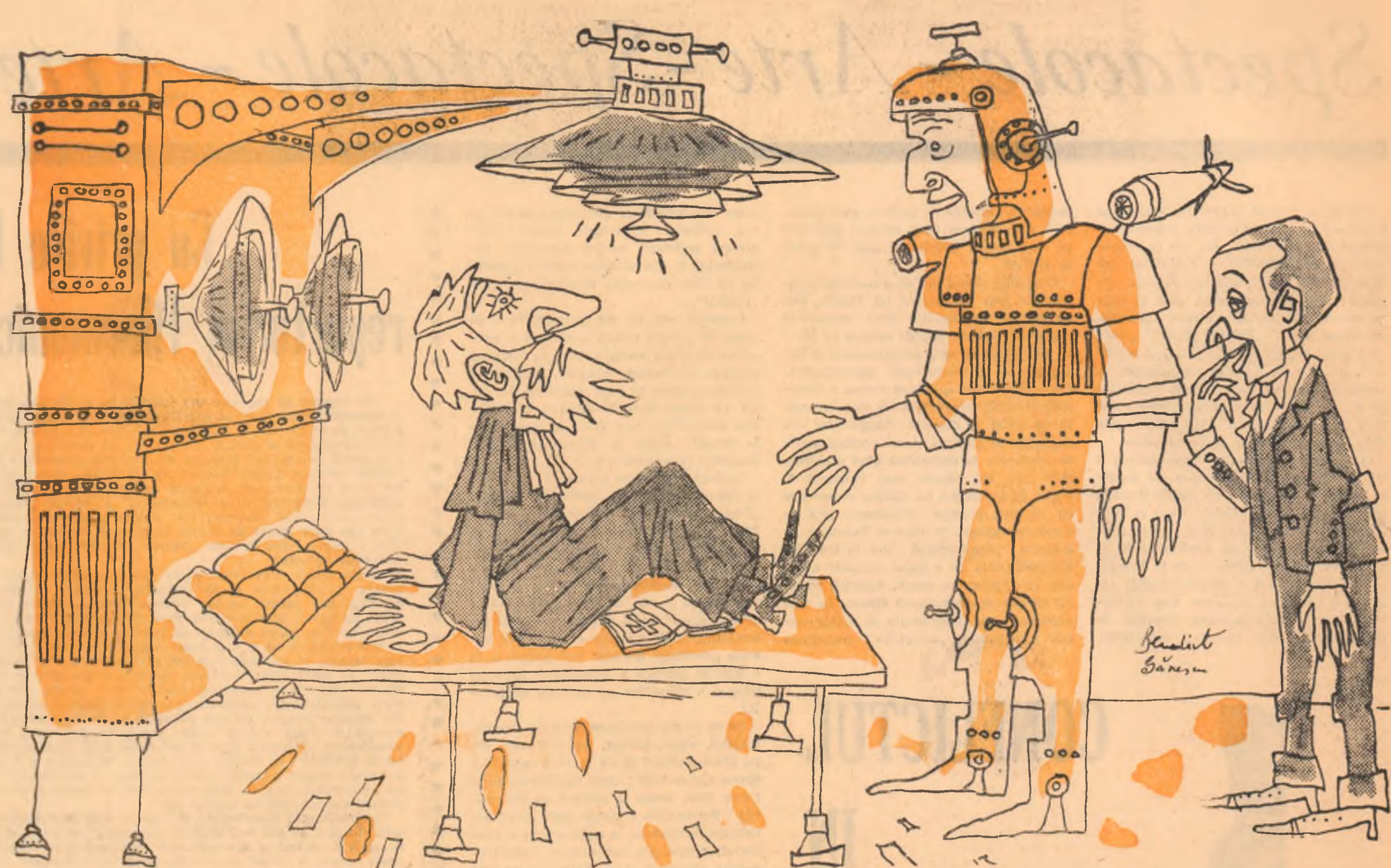
Desen de BENEDICT GĂNESCU

— A fost destul de greu. Cu ajutorul aparatelor de reanimare a noștrilor dispărute, savanta Li de la Muzeul Cosmic aflat pe Lună a identificat mizgăliurile tale și ale părintelui Joseph, adică scrisul — o metodă rudimentară de consemnare — și a mai descoperit că în buzunarele părintelui Joseph era scrisul unui popor care se numea american sau englez — e greu de precizat. Fapt este că am aflat destule amănunte despre tine și despre părintele Joseph. Dar, aproape, ce înseamnă pe timpul vostru cuvîntul acesta?