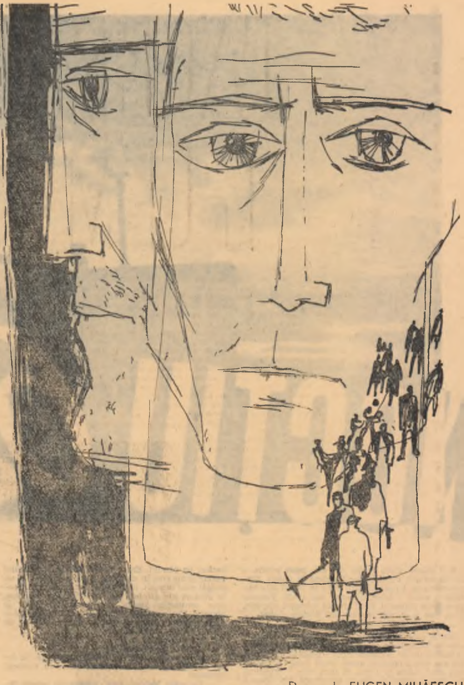
Desen de EUGEN MIHĂESCU

Începură rușii să împoacă cu rachete, fără să pună tunurile în mișcare. Veniră și cu avioanele, în zbor razant, să vadă ce se întîmplă acolo; tăiară noaptea cu două rafale de mitralieră și se culcară. Chirilă se trezi prins în fum, înconjurat de zgo-