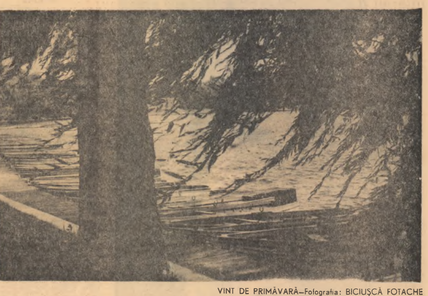
VINT DE PRIMĂVARĂ