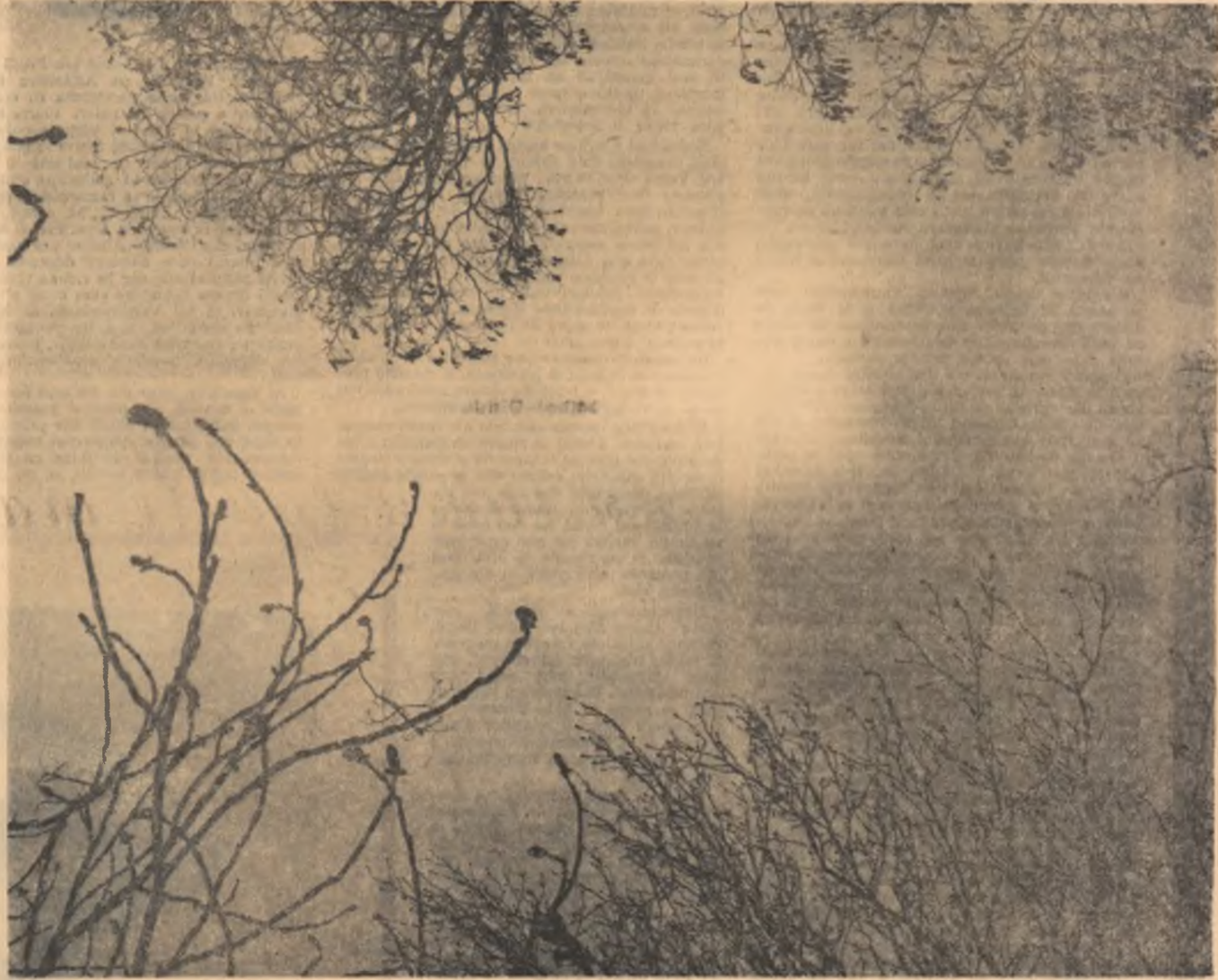
MUGURI ȘI SOARE