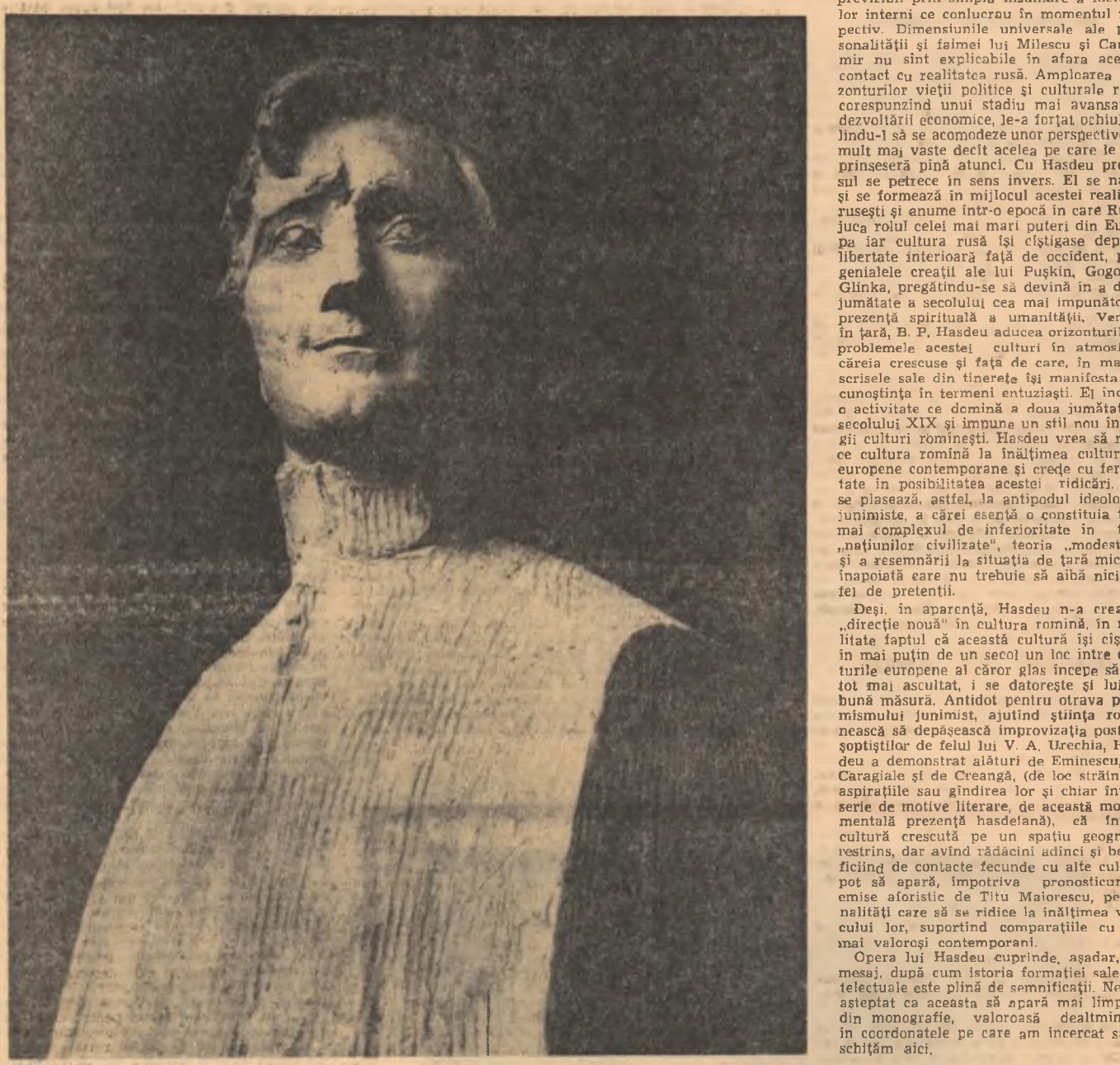
G. TOPÎRCEANU—Sculptură de ION VLAD