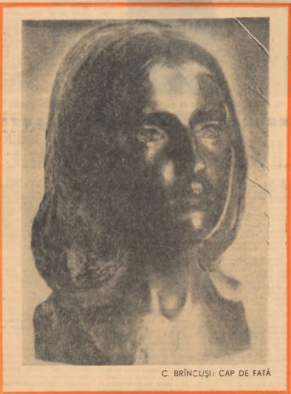
C. BRÎNCUȘI: CAP DE FATĂ