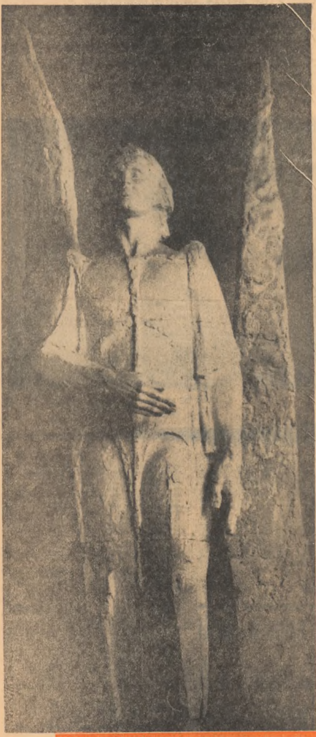
„LUCEAFĂRUL” Sculptură de ION VLAD

Are simbăla, de două ori pe lună — 12 PAGINI — 1,50 lei