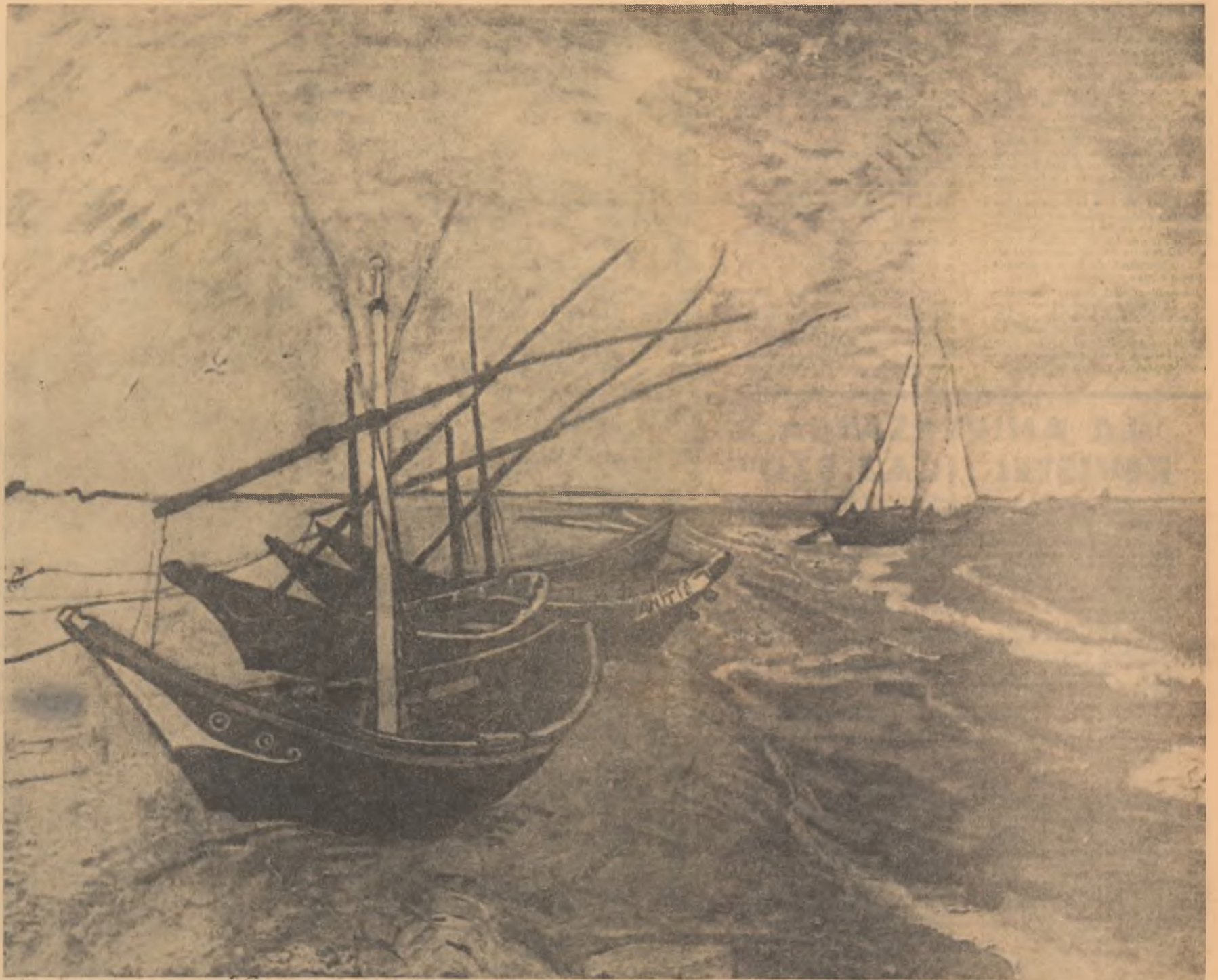
VAN GOGH — Bărci pescărești la Sainte Marie