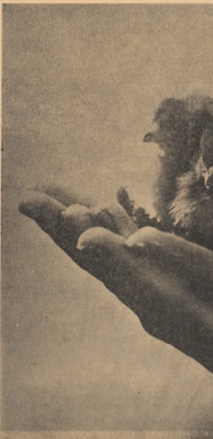
MIINI DE ZOOTEHNICIANA