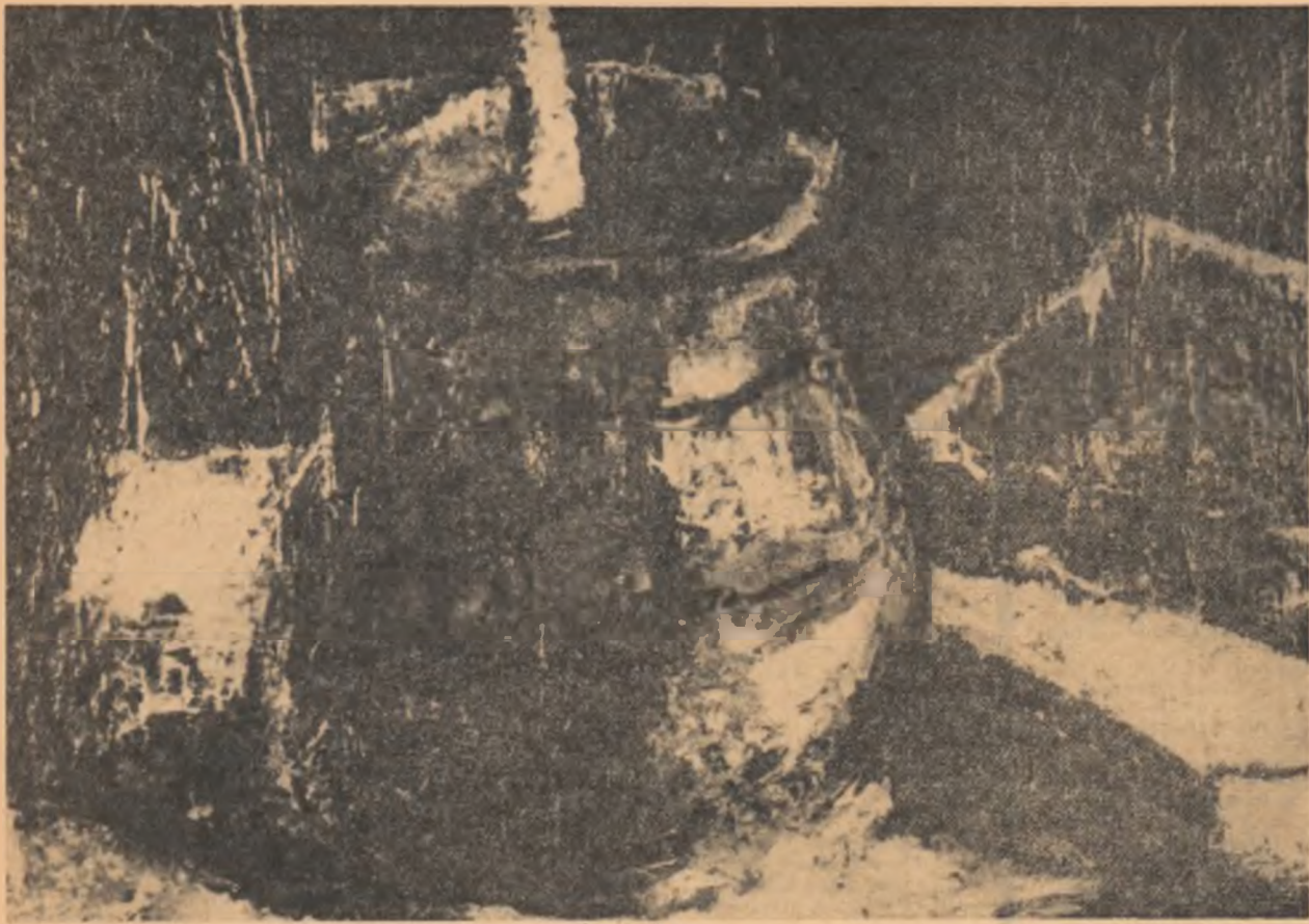
GH. PETRAȘCU — NATURĂ STATICĂ