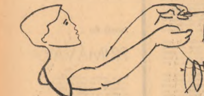
DESENE DE M. JORJOAIA

Pești păreau morți, solzii lor uscați stăteau parca gata să cadă. Îngîș pe mal, copilul îi stropi cu apă adusă în pumni. Ei încercau dar nu să zboare, guile se deschideau, cereau apă. Dar băiețușul se așeză lângă ei, pe vine, și se apucă să-și înșire unul după altul, pe o lozie jupuită; ei treceau vîrlul unei prii ca capacele urechilor și îi scotea pînă gurile rotunde. Ultimul era un boieștean îngust, cenușiu. Băiețușul privi soarele, care acum nu-i mai stătea în spate, începuse să coboare. Măscă pripit coada peștelui și o scuișă jos; rețeză la fel capul apoi îngîhîi restul, fără să-l mesteco aproape cu ochii în iarba malului. Oasele erau moi, nu-i întepau limba. Abia acum foamea năvăli din toate părțile. Carne crudă intră în cerul gurii, era amară, caldă. Al doilea pește scos de pe lozie, i se pare că-l tăcuse; pe acesta copilul îl mestecă rar, în timp ce, lășind într-o parte apă îngustă străbătută o porumbiște dată în copt, și o miștie arsă.