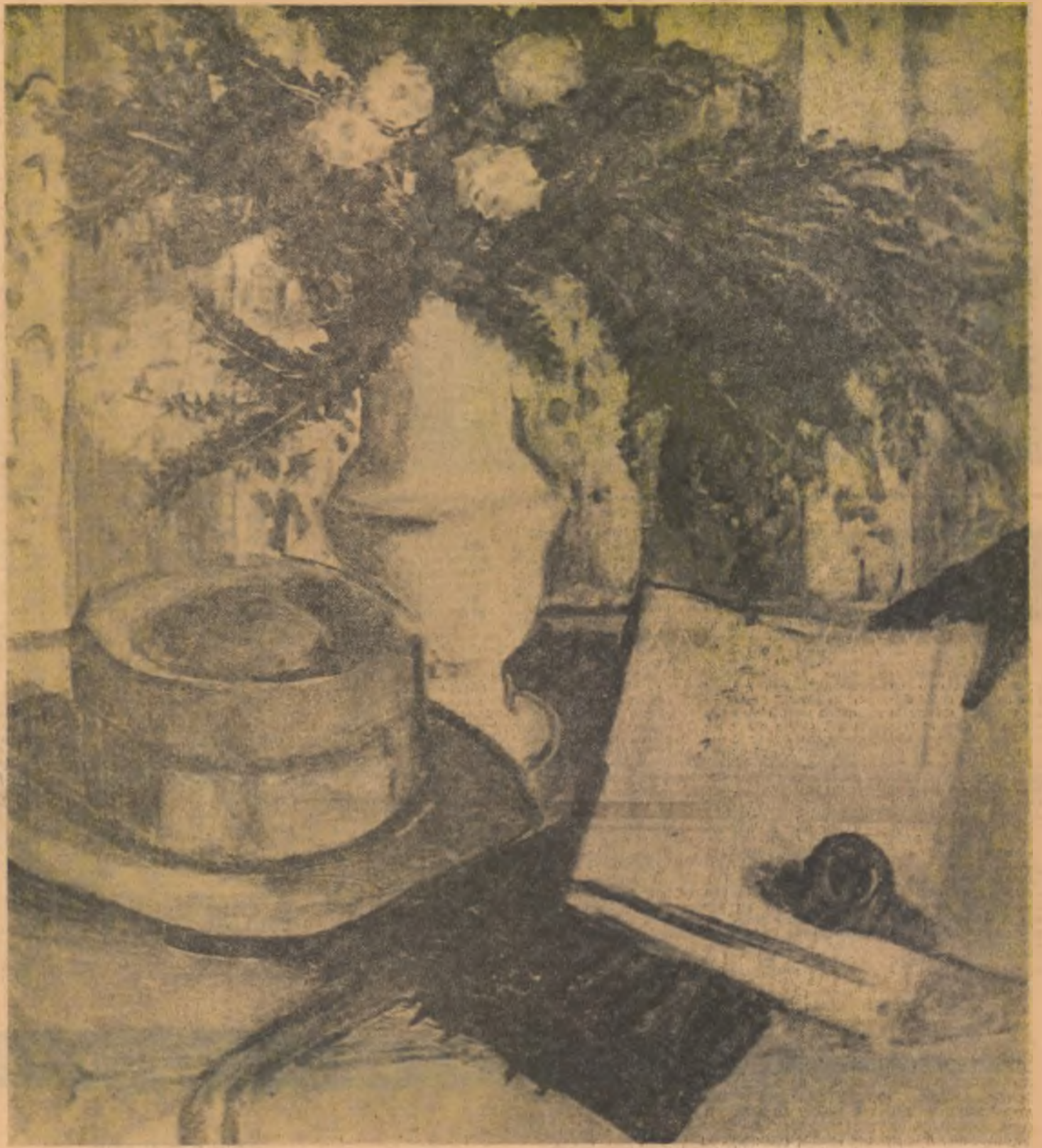
THEODOR PALLADY: „Natură statică”