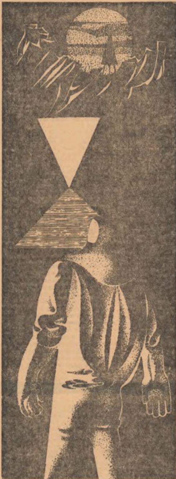
Desen de N. ȘERBAN

Era curajos că privisem tot timpul în jur, fără să țau în seamă tocmai locul unde coborisem. Cu gîndul să ocolesc