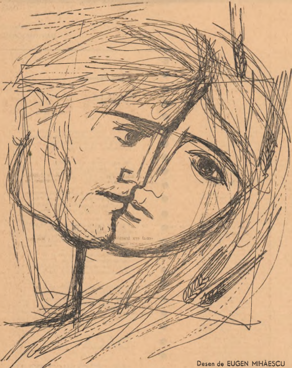
Desen de EUGEN MIHĂESCU

— Nu-i bine așa, zise el. Hai să suflăm încet spre lămpă... Așa... Hu! Hu! Hu!