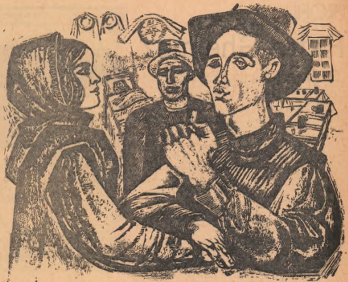
Desen de ALBIN STĂNESCU