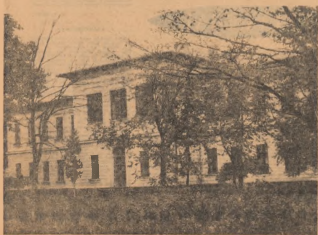
Liceul GEORGE BACOVIA din Bacău unde a învățat poetul

Miscați pînă la lacrimi fiecare Ne-am spus un basm de munci și suferință, Apoi ne despărțirăm cu-ntristare!