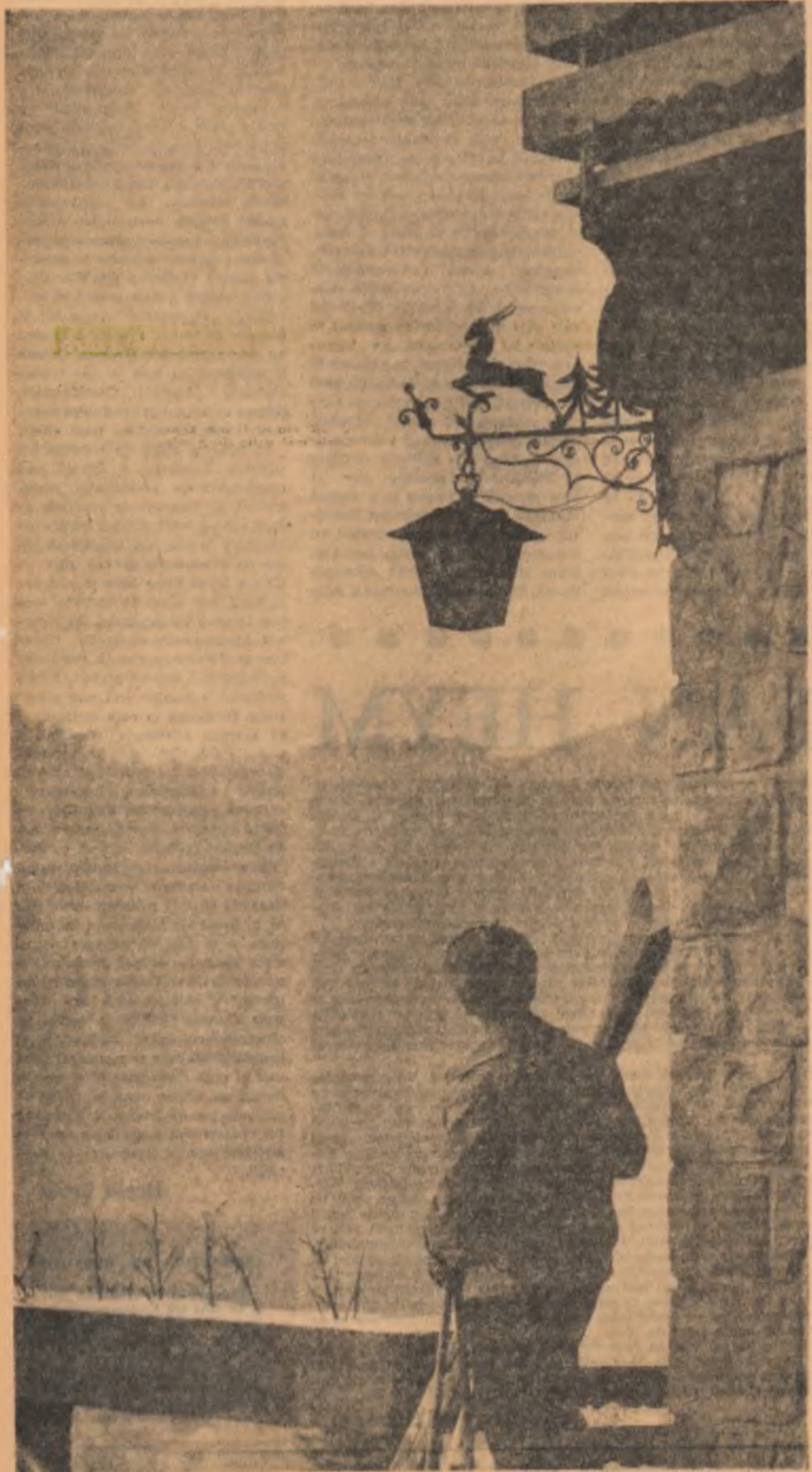
PRIMA ZĂPADĂ