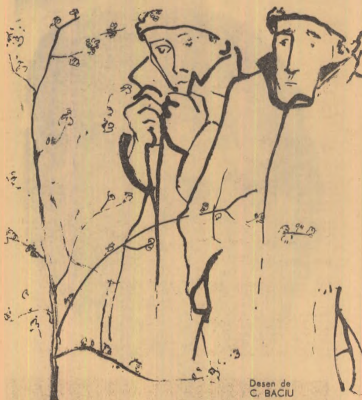
Desen de C. BACIU

Bobiță a început, primul, să se radă în fiecare