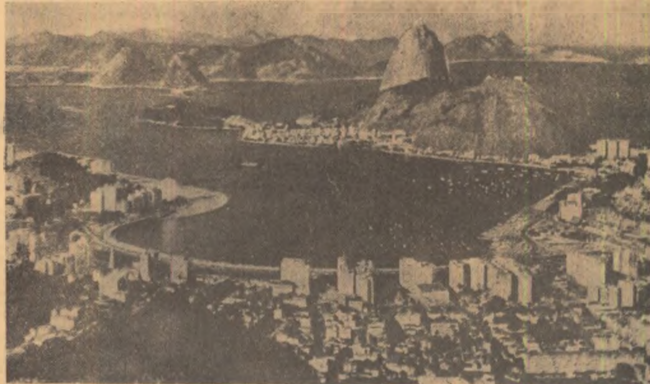
VEDERE DIN RIO DE JANEIRO

La São Paulo am găsit puține vestigii ale trecutului. Nici măcar din secolul al XIX-lea. Nomazi și emigranții