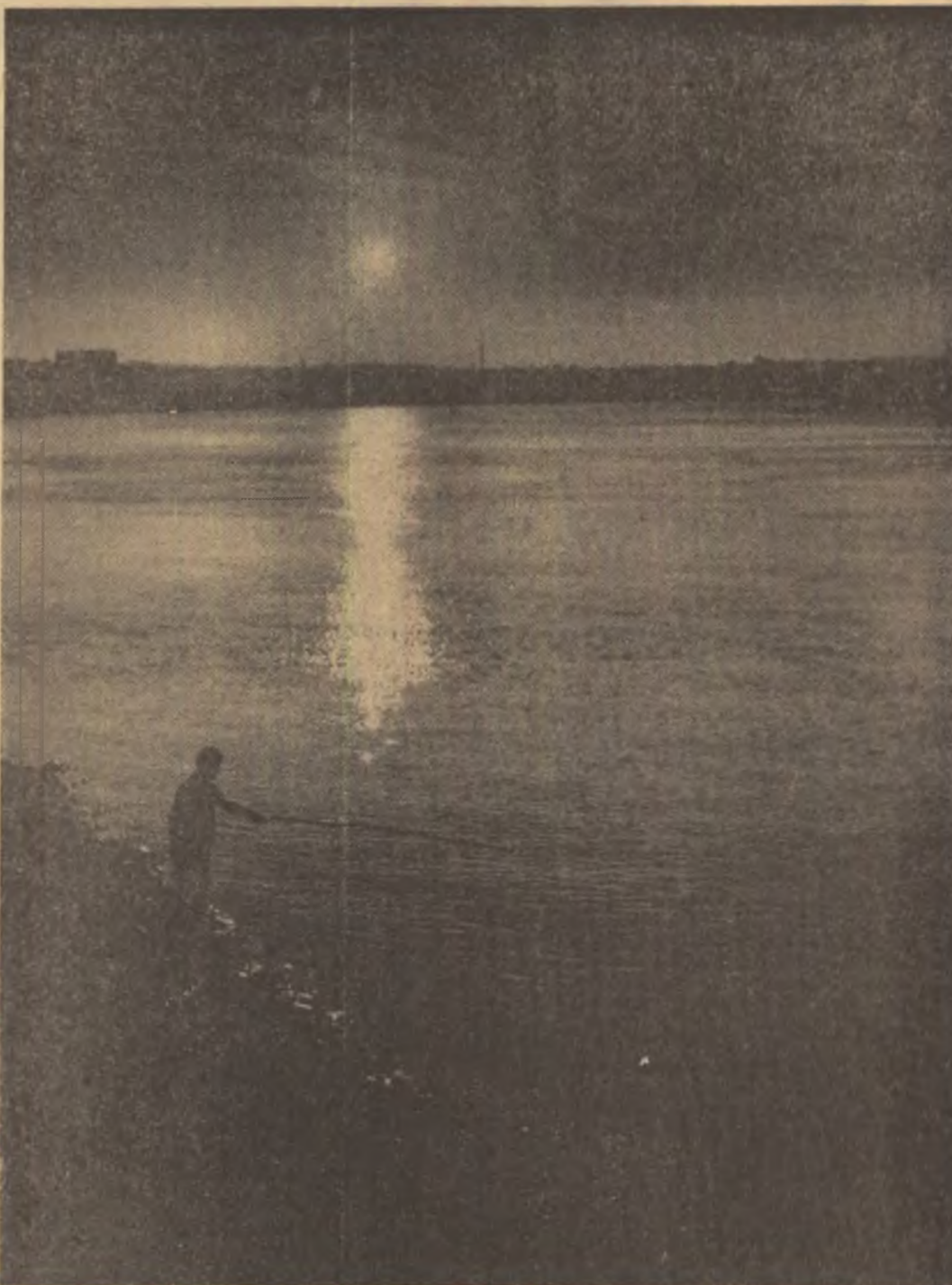
APUS DE SOARE PE DUNĂRE