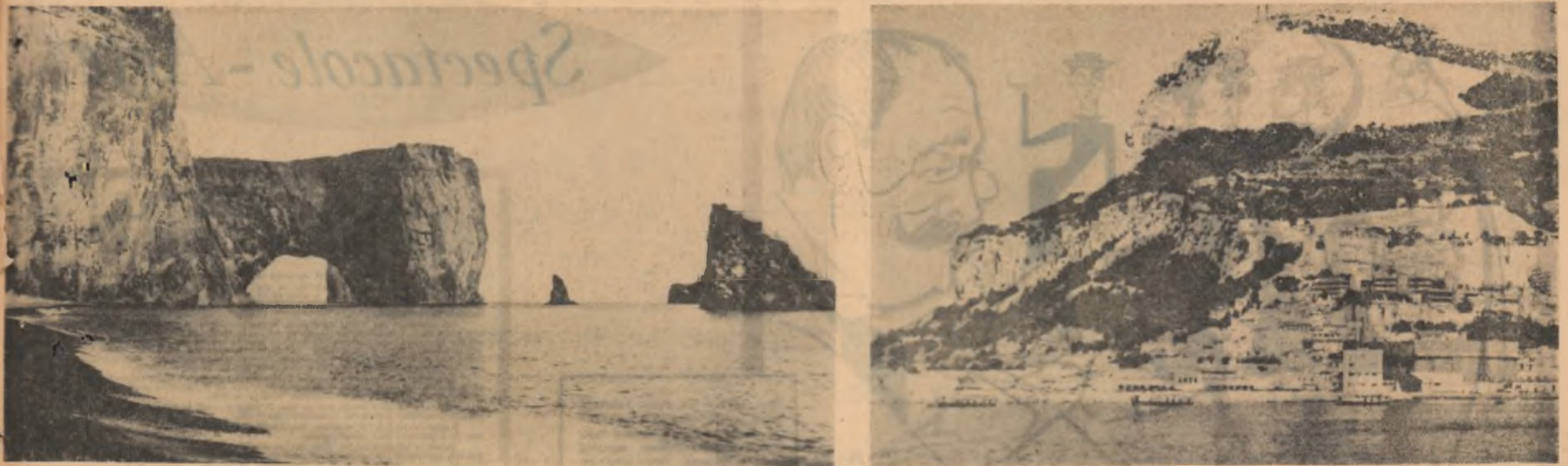
Colț stîncos al Islandei — nordul lăsat în urmă