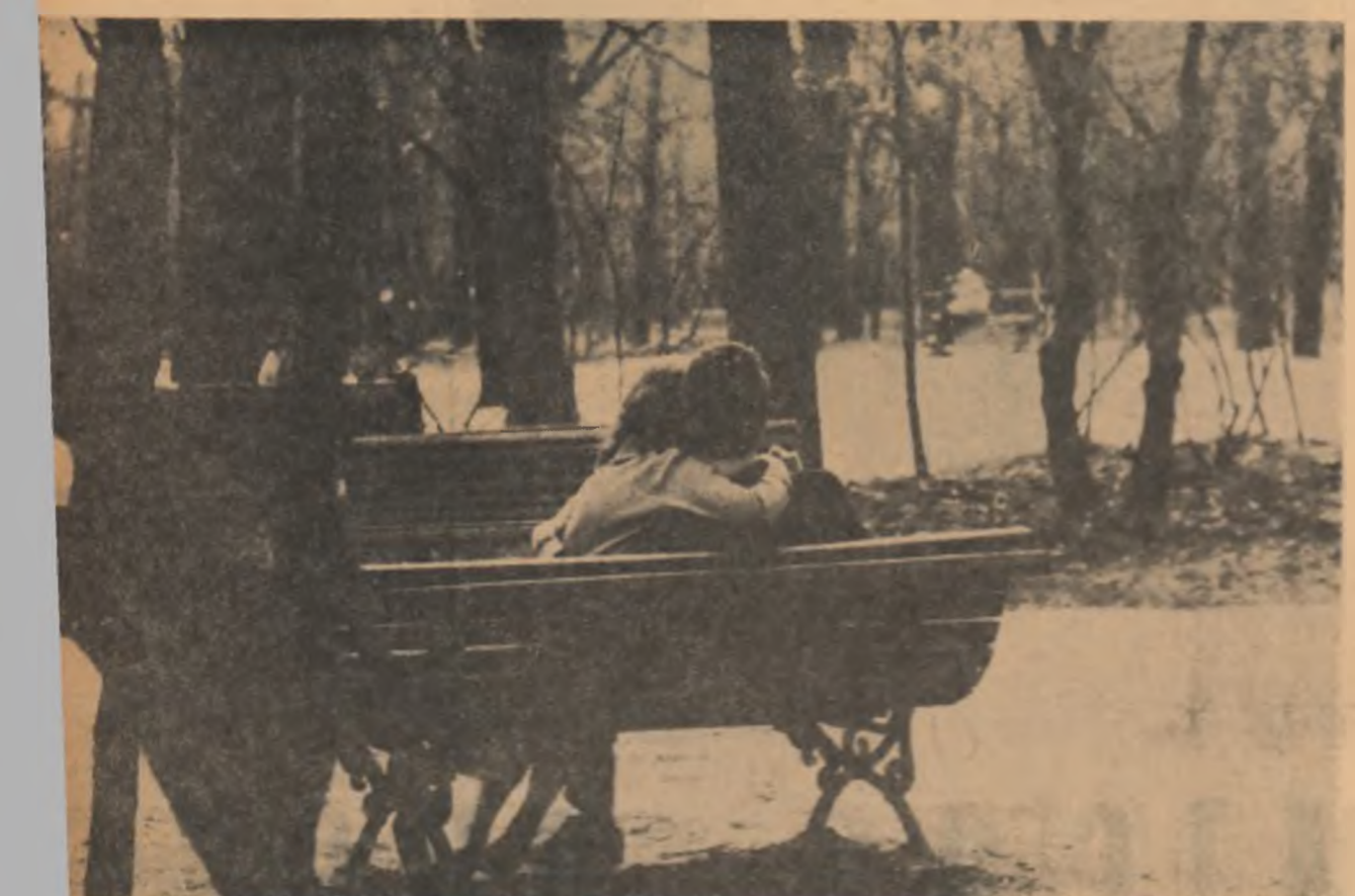
SIMFONIE DE PRIMĂVARĂ — Fotografia: DAN GRIGORESCU