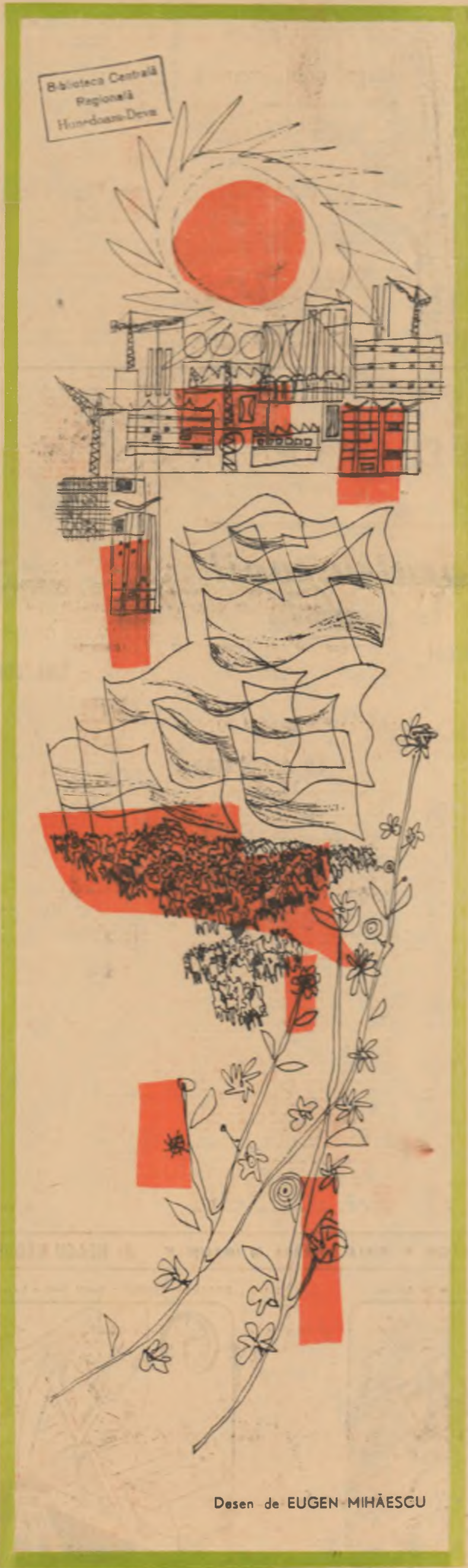
Desen de EUGEN MIHĂESCU

In pag. a 9-a DRUMUL SPRE SOARE de RADU TUDORAN