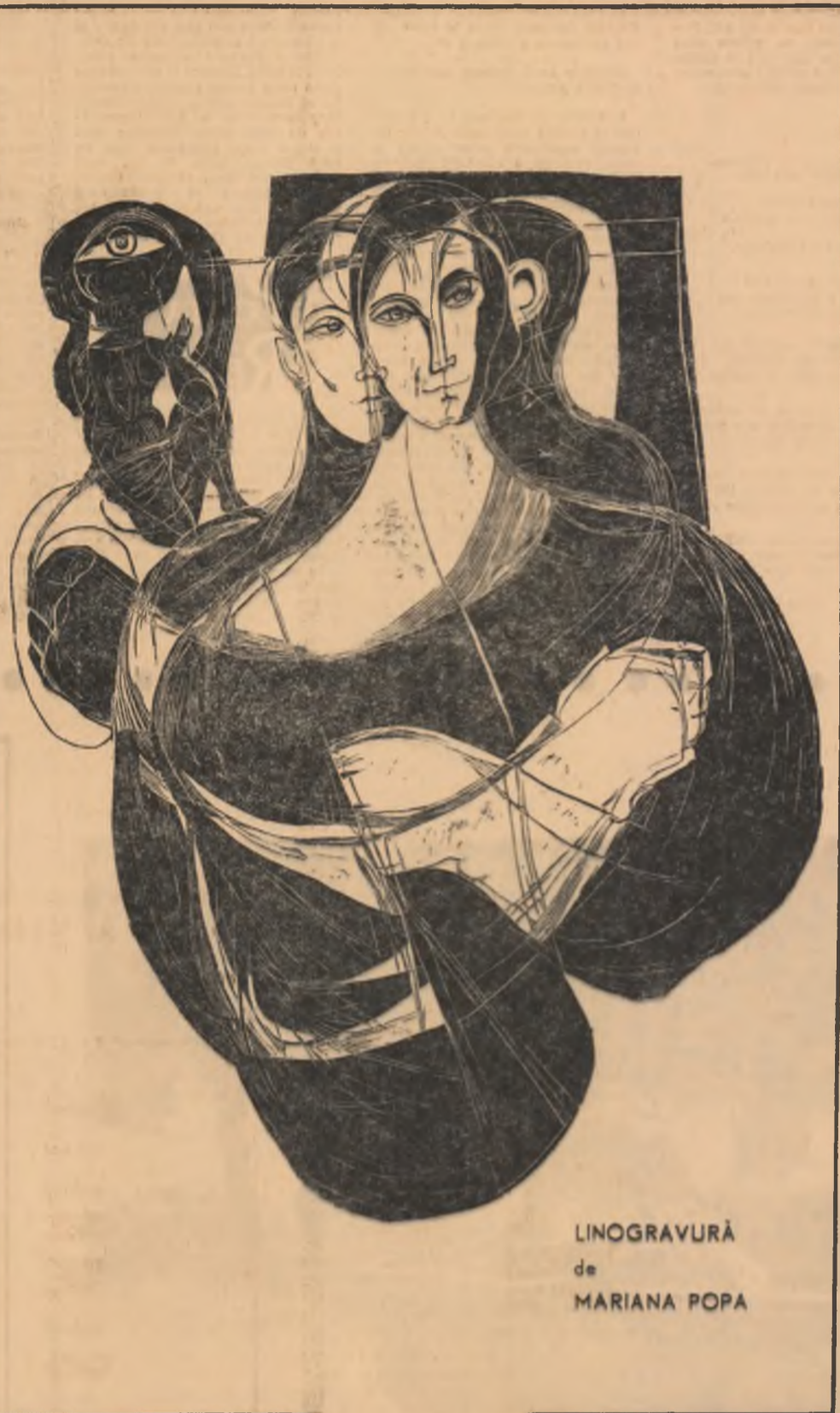
LINOGRAVURĂ de MARIANA POPA

Cele două crengi elatină ușor furoul, într-o parte și alta, ca într-un început de dans. Așa două minii verzi, înmugurite, dansează cu un furou alb cu negru, foarte viu acum, ca o flacără și ca o femeie.