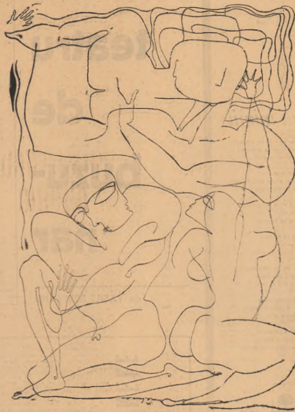
Desen de VICTOR CUPȘA

Dar iată că acum vin eu și caut eu; te voi urla c-un strigăt de bărbat nemulțumit dintr-o fereastră de sud a Casei Sînteii. Brațele tale se vor speria somnoroase, să primească plînea cea unsă cu tușul tipografic, schimbînd cerneala-n un neprihănit.