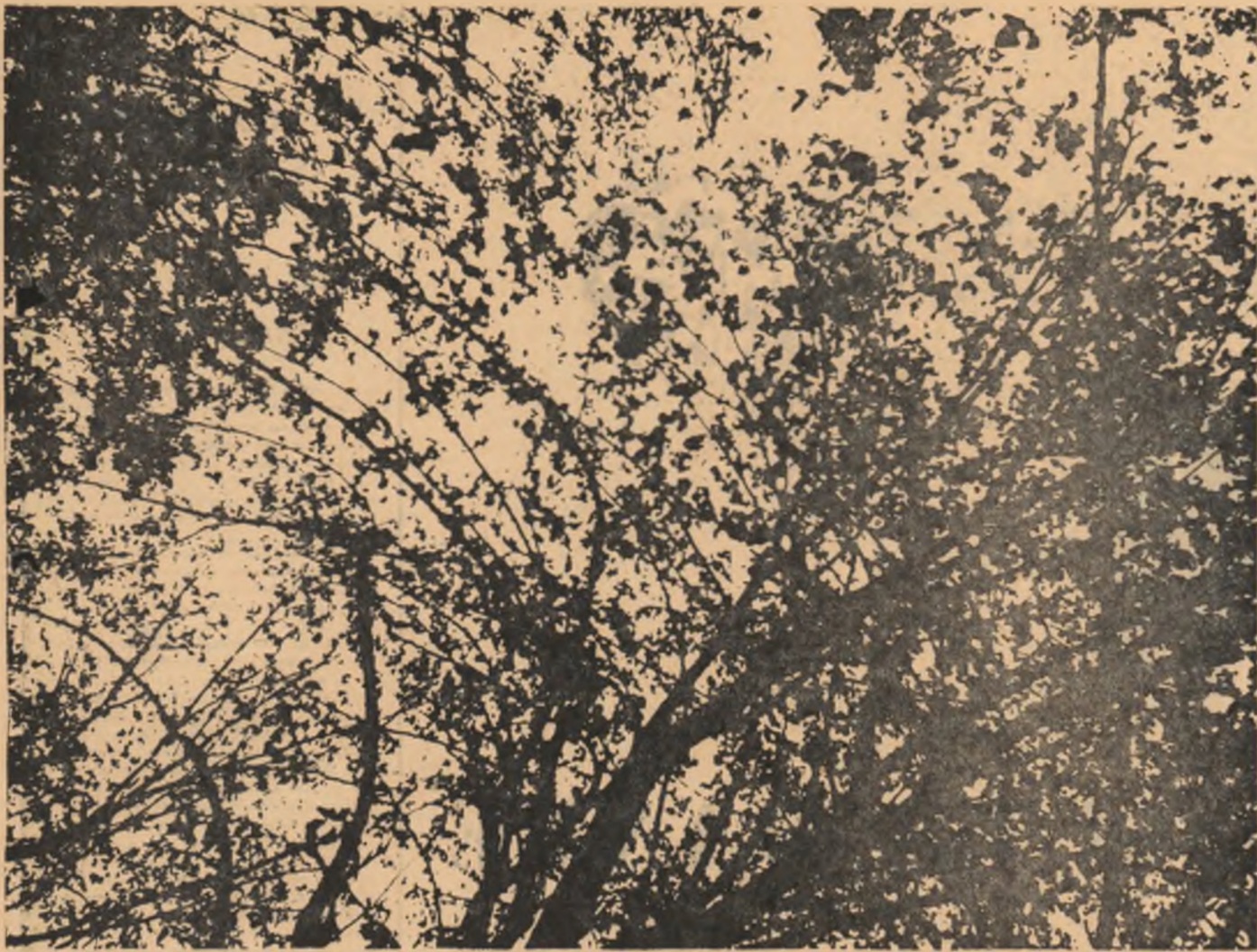
POMI INFLORIȚI