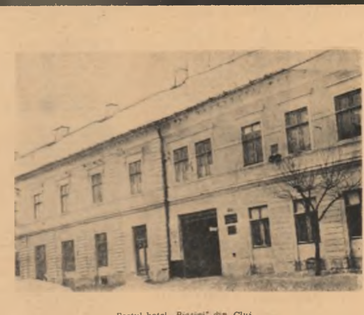
Fostul hotel „Buzzei” din Cluj.