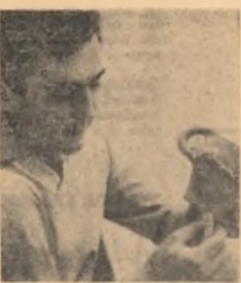
O confruntare la zi: profesorul de istorie și două milenii.

laptel, 1700 oi, 400 porci și 700 păsări-măști.)