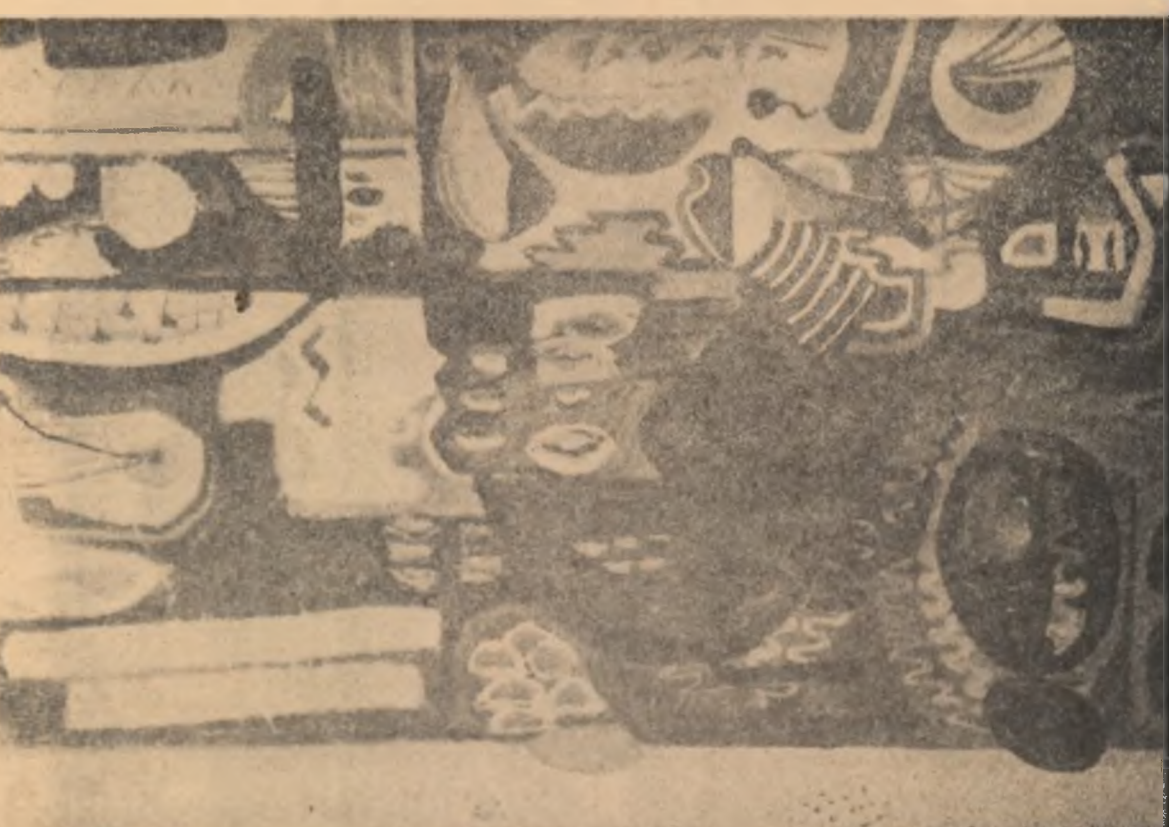
BRADUȚ COVALIU — METAFORA (ulei)

După relatarea Andronice, deputat și președinte comisiei de femei pe atunci, defectul cel mare al fostului președinte fusese că se ascumplea la țărîni și se lătmăia la lîmă. Voină să facă „economii” și cum eveau nevoie de un camion, ca de obicei din timp, președintele a plecat cu un șofer dintr-un G.A.S. vecin la București unde „um-