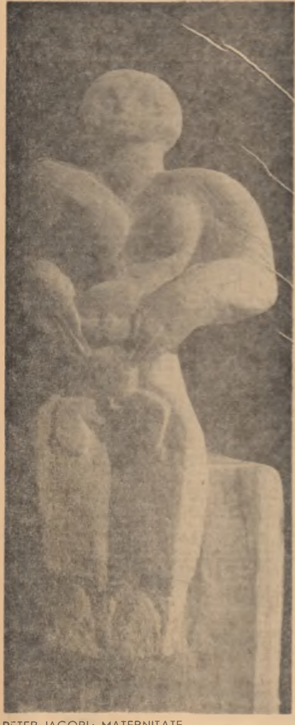
PETER JACOBI: MATERNITATE

Este o formă de publicitate care are ca scop să atragă atenția publicului asupra unor produse sau servicii. Este o formă de publicitate care are ca scop să atragă atenția publicului asupra unor produse sau servicii.