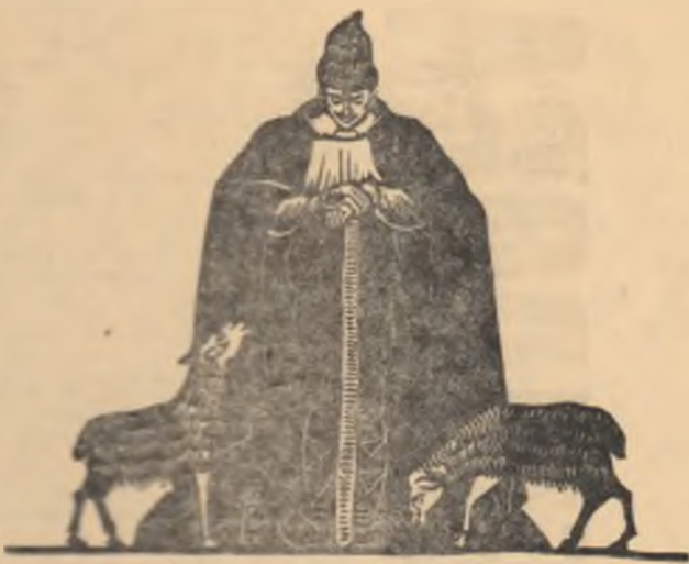
ILUSTRATIE LA 'MIORITA' DE MARCEL OLINESCU

Pentru a cunoaște odată mai mult caracterul cetățenesc al lui Vasile Alecsandri și averiunea lui față de politicianismul versatilor al vremii, publicăm mai jos patru telegrame înedite din Arhiva Mihail Kogălniceanu din Biblioteca Academiei Republicii Socialiste România.