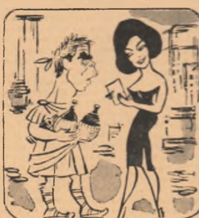
Sophia Loren: Președ. Nicuță, un autograt! Nicuță: Ah, madame! Asta, moarte mi sînt după gîulețeni!