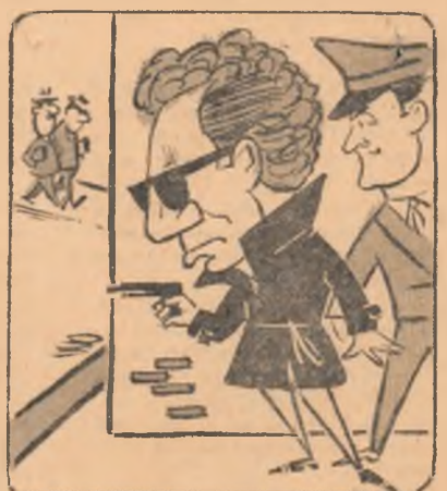
— Atenție, maestre! Doi cititori!