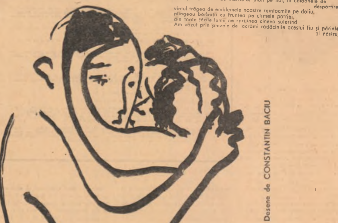
Desene de CONSTANTIN BACIU