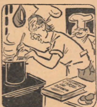
Ben Carlaciu: Am preluat personal comenziile!