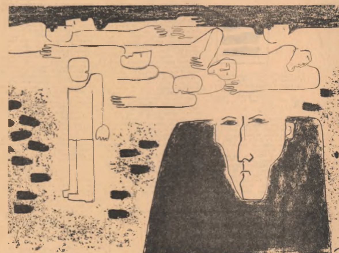
Desen de DANA CONSTANTINESCU

de la o altă garnitură, ce se repede, pe aceeași linie, asupra trenului în care mă află.