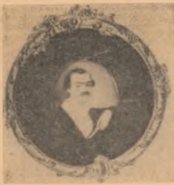
Poetul, în perioada studiilor la Paris

E o duminică de august. Preasfinșit-ul, doritor de a schimba potirul pe stacan și de a părăsi mai de grabă al-tarul pentru ca să se ducă la taraba crîșmei, citește liturgia din fugă și pleacă uitînd să stingă luminările în biserică. E vînt mare în această zi. Vîntul suflînd printr-un geam strîcat,