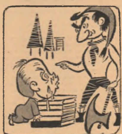
Cititorul: De data asta te ier!