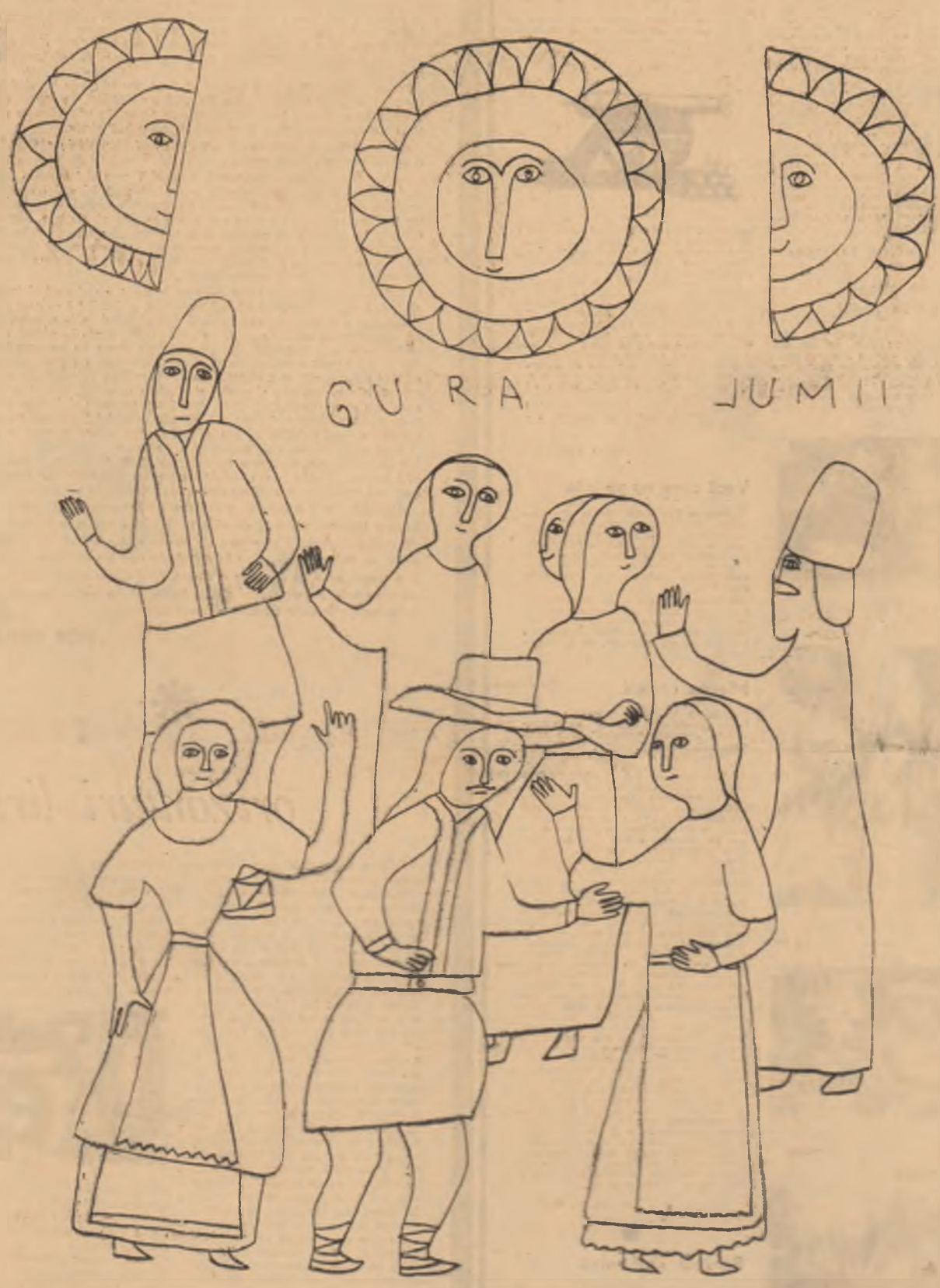
Desen de MIHAELA BARASCHI

SĂPTĂMINAL AL UNIUNII SCRITORILOR DIN REPUBLICA SOCIALISTĂ ROMÂNIA ● Redactor-șef EUGEN BARBU ● ANUL VIII—Nr. 22 (181) Simbătă 16 OCTOMBRIE 1965 — 8 PAGINI, 1 LEU