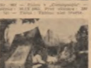
De în pasajul Vilagros, din plin centrul Capitalei, țară, va oferi o priveliște nouă...