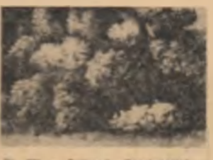
De în pasajul Vilagros, din plin centrul Capitalei, țară, va oferi o priveliște nouă...