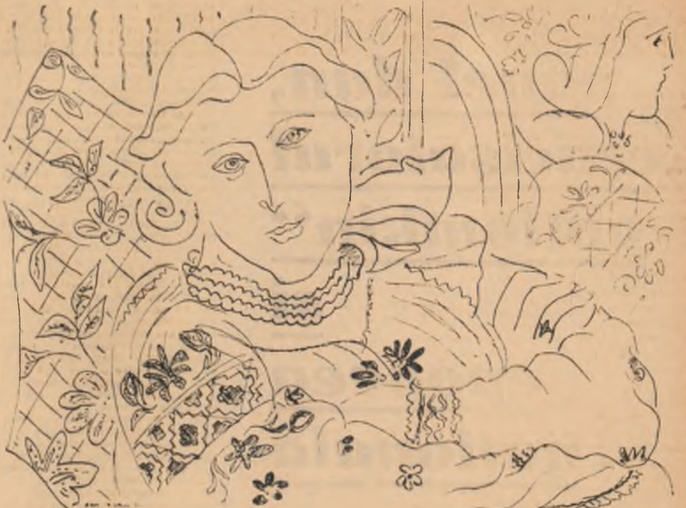
HENRI MATISSE - PORTRET DE FATĂ

„Să-mi iau, sau nu, pământul? • Fauna și flora sint, bogate. • De unde vine numele insulelor Canare? • Uf, ce caldă-i apa asta! • În Italia, la Messina, am pășit-o cu un neșter de fructe...”