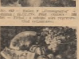
De în pasajul Vilagros, din plin centrul Capitalei, țară, va oferi o priveliște nouă...