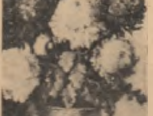
De în pasajul Vilagros, din plin centrul Capitalei, țară, va oferi o priveliște nouă...