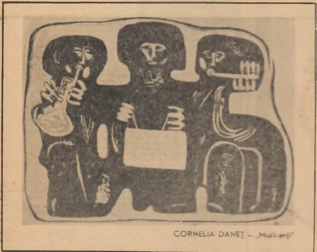
CORNELIA DANEJ - Muzicantii

A rădăci și imediat a venit un îngere îmbrăcat în uniformă de pază la castel, și mi-a spus: — Să trăiești tovarășe creator! Sînt oți venit în miliciana noastră. — El, paznicul, nu-l vedeai pe Dumnezeu pentru că se făcuse nevădit. Pentru mine nu l-am rugat pe paznic să-o ia puțin mai înaintea și am continuat discuția: — Doamnă, este pentru prima dată cînd vin aici la Casa creatorilor Dumnezeu care te așteaptă la ușă învață-mă și pe mine cum să mă comport. Să fac apel la cei 7 ani de-acasă? — La nici un caz. Fii cîți mai liniștit de modeste. Vîno te la toate deciziile creatorilor, mînuiește la ce s-a scris și nu te descurci în viața literară, spinoasă cu toate cămășile care pînă la azi sînt în viața noastră. — Mă vor învăța? — Nu. — Te înțelegi cu ceilalți creatori? — Văzutei și nevăzutei. — Cum mă simt sigurii creator de pe acest pămînt mare.