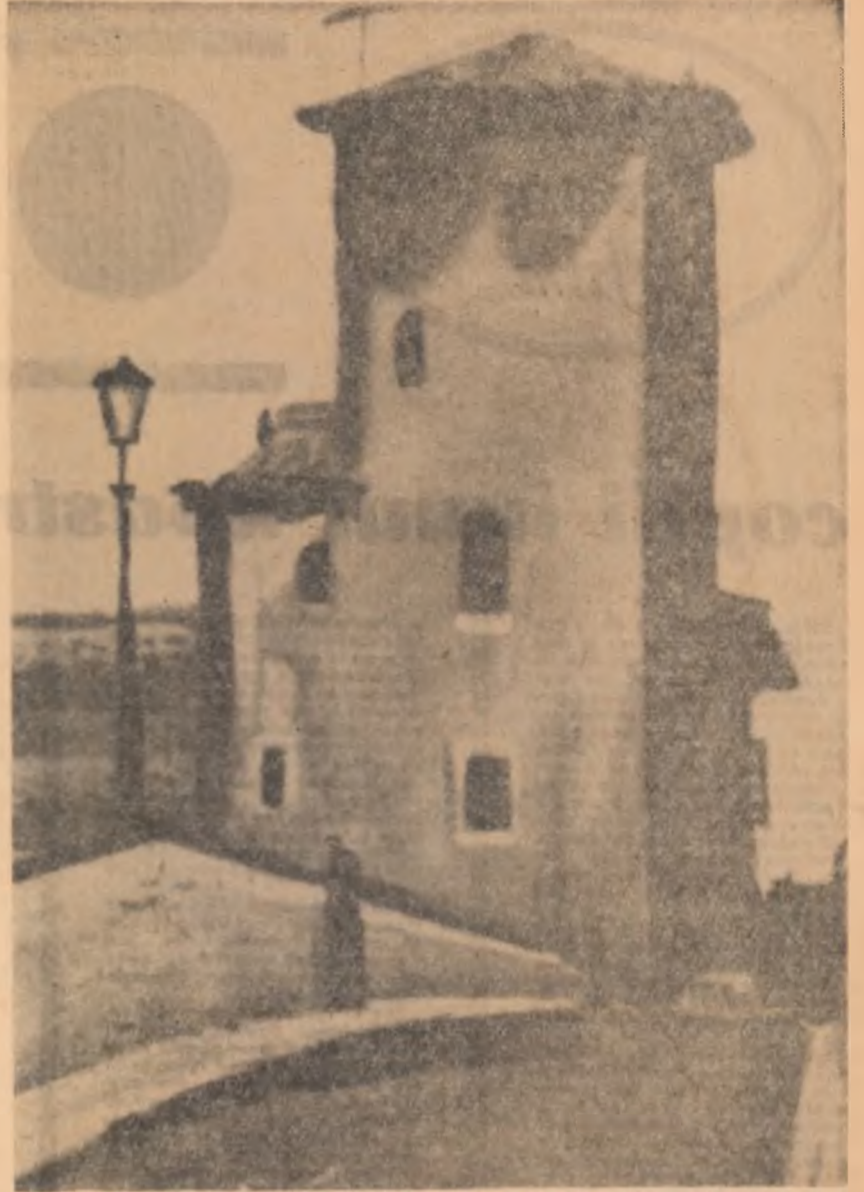
T. T. O. SALAHOV (U.R.S.S.) — Pod peste insula Tiberina