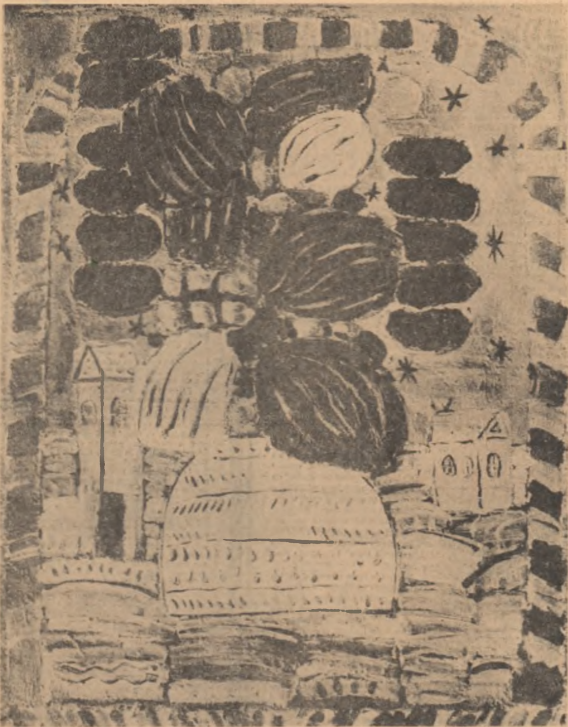
ION GHEORGHIU: FLORI