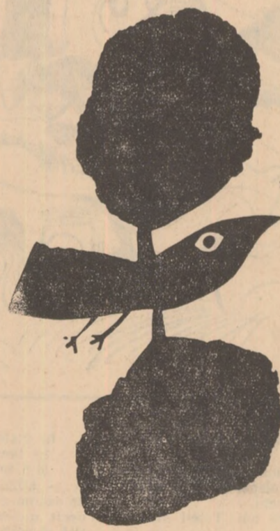
ION STENDL: „Păsări pe floarea soarelui”