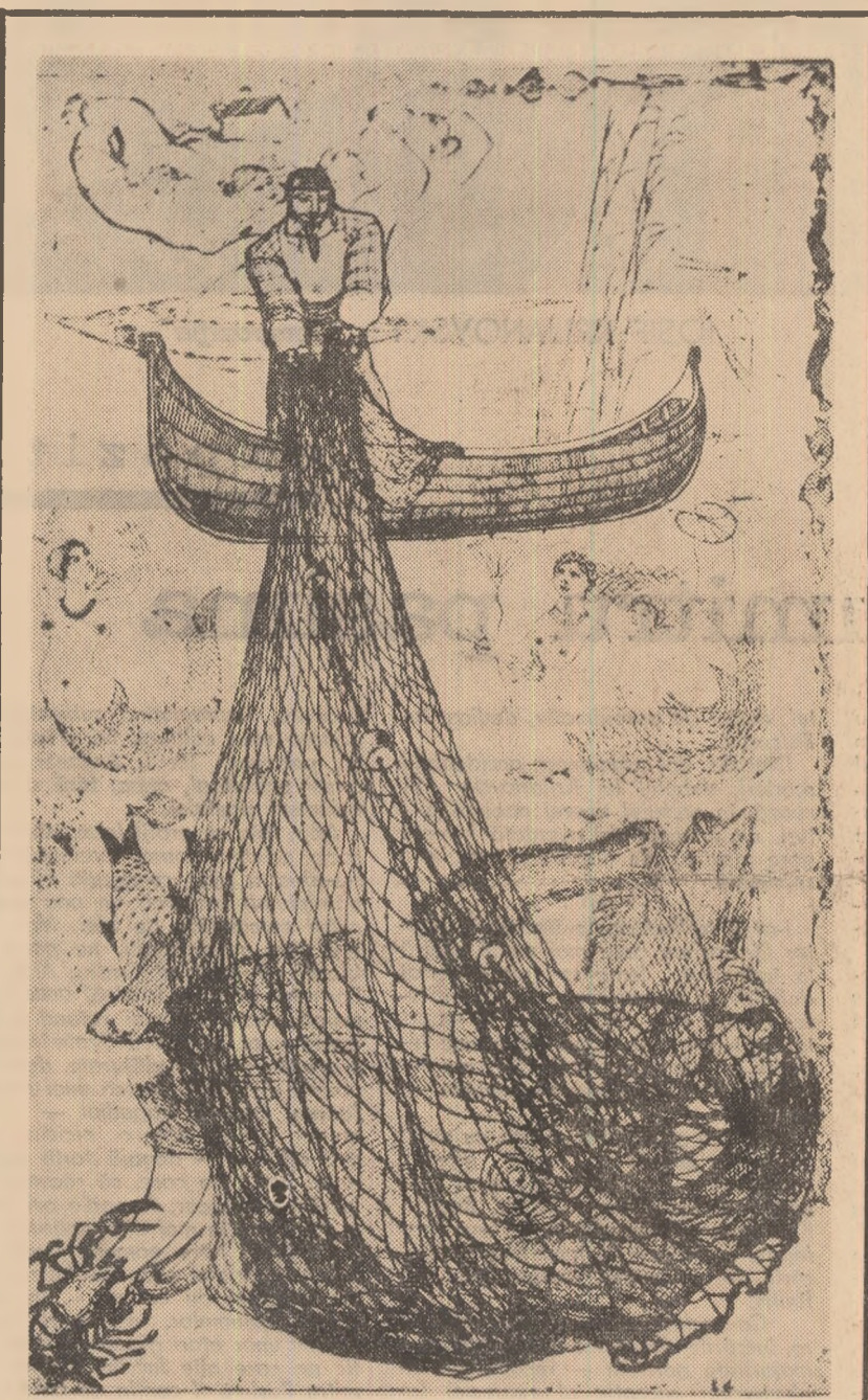
Desen de MARCEL CHIRNOAGĂ