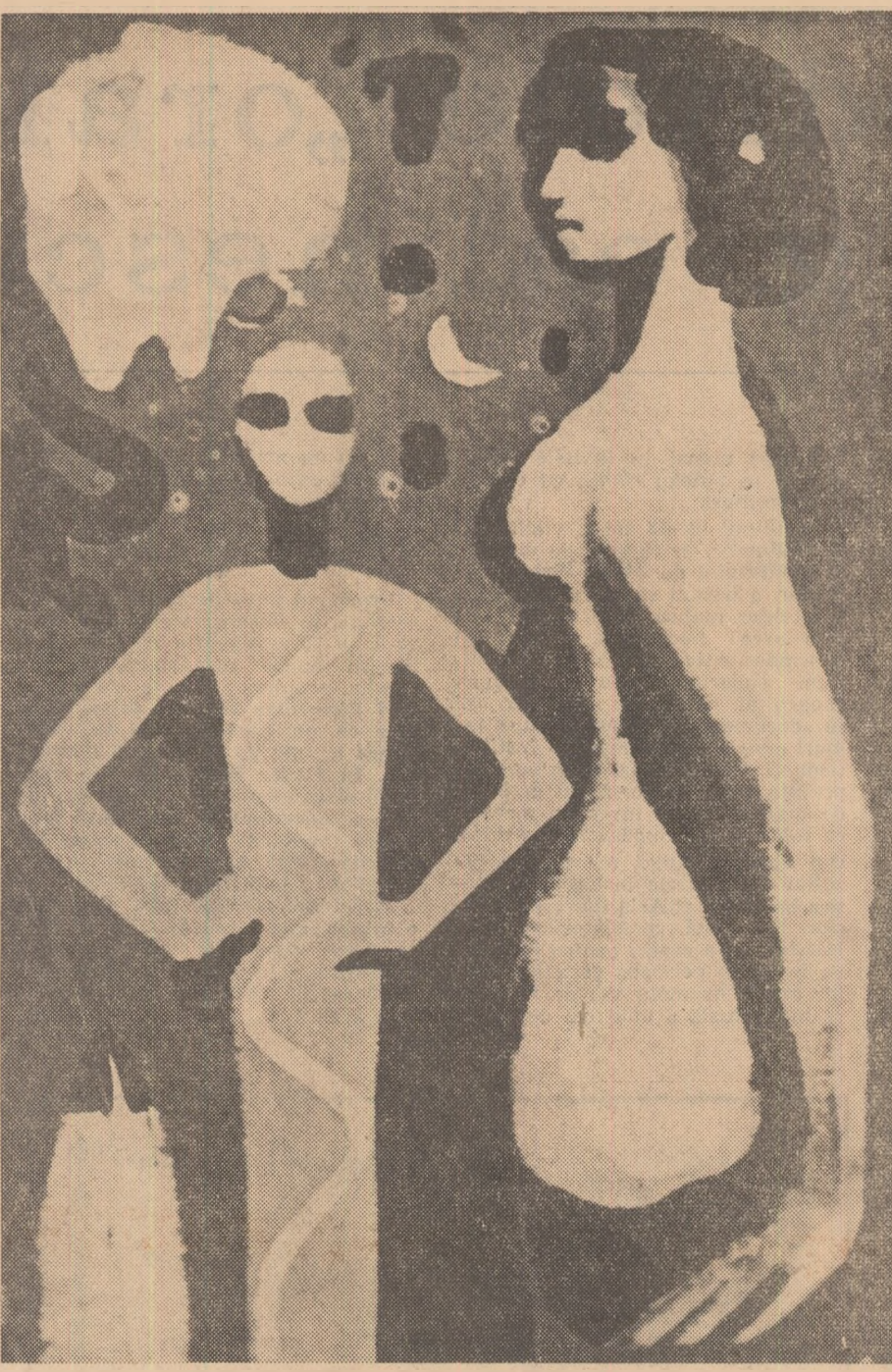
IOSIF KRIJANOVSKY: „Compoziție”