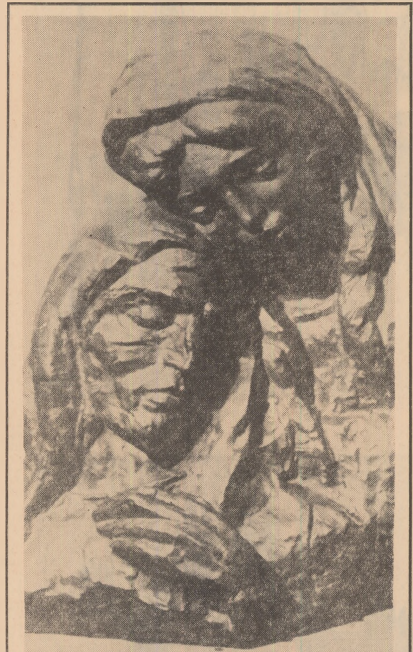
R. LADEA — sculptură (detaliu)

braz! Dacă mai îndrăznește vreuna le dau pe toate afară. Uite-le cum dau buzna de dincolo! Au lăsat-o singură pe soacră-mea și se-mping la pomană! Pomană înaintea de-a muri, ce-o să fie după aceea — își spuse și ce-o irita era că le vedea pe toate înstăpînite în casă, vioaie și vorbărețe — ultima apăru Fătărica și se așeză într-un ungher pe mincinate, c-a-un morman de plăcinte și salami, adunat în fată — parcă ea nici nu mai exista. Și se simți într-adevăr de prisos, fără nici un rost, străină în propria ei casă, mai străină decît toate străinele aceea care dirijau acum totul.