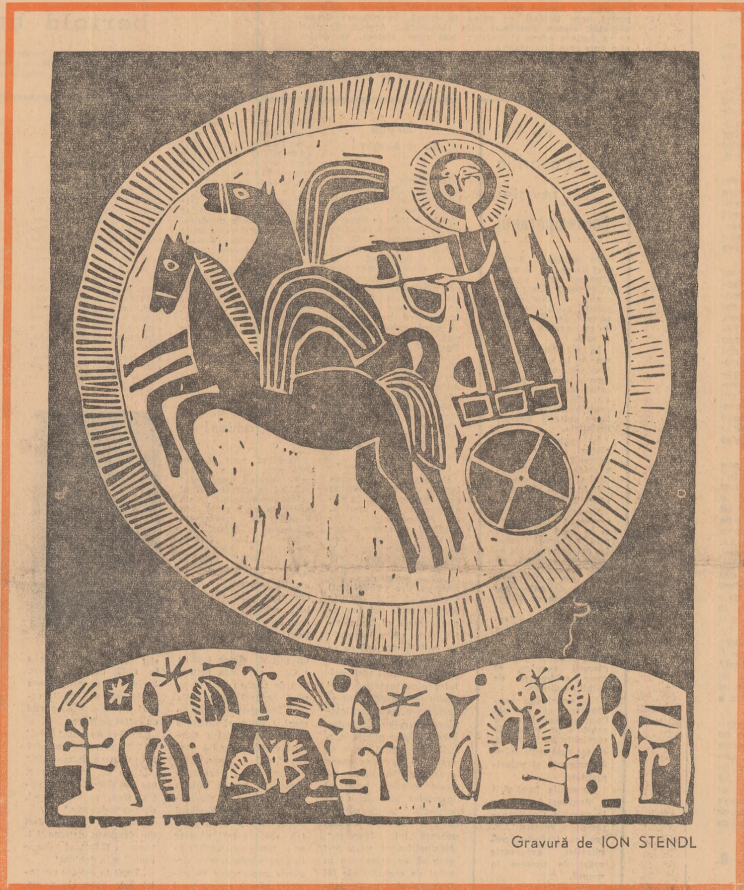
Gravură de ION STENDL

Citiți în pag. 7 DIN INEDITELE „ORALE” ALE LUI G. CĂLINESCU